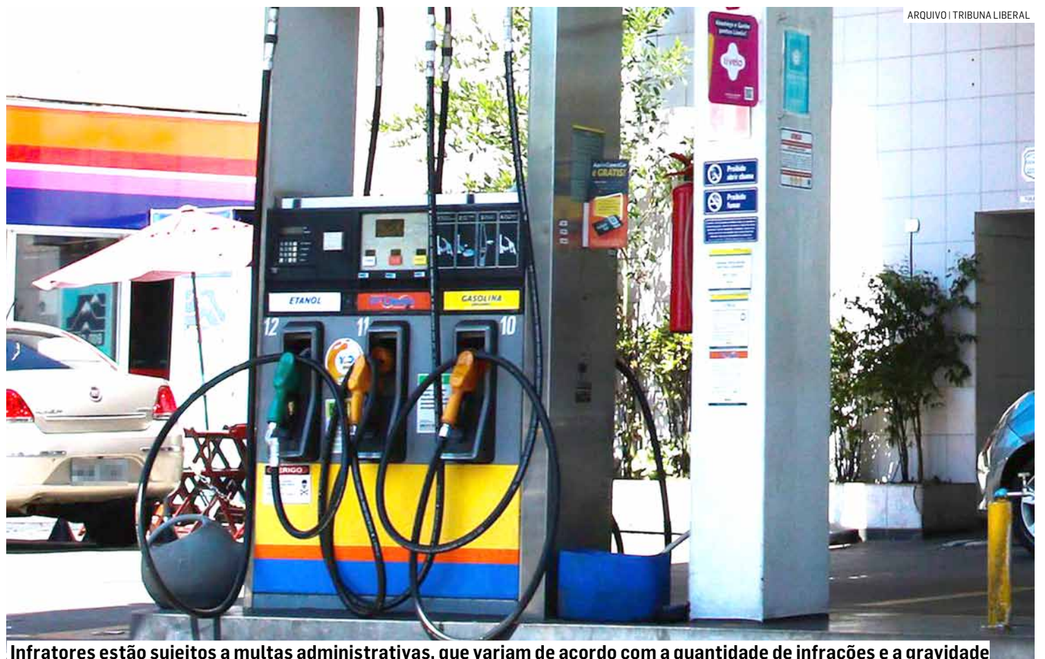
Infratores estão sujeitos a multas administrativas, que variam de acordo com a quantidade de infrações e a gravidade

Como mencionado pelo vereador na justificativa do projeto, embora a legislação federal já estabeleça o direito dos consumidores a essas informações, alguns postos de combustíveis no município têm desrespeitado essas regras, divulgando promoções com preços diferentes dos anunciados nas bombas. Os infratores estarão sujeitos a multas administrativas, que variam de acordo com a quantidade de infrações e a gravidade, podendo chegar a