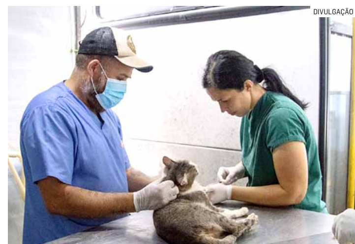
Mais de 550 procedimentos gratuitos serão disponibilizados

O DPBEA informa ainda que, no dia agendado para a castração, o atendimento será feito por or-