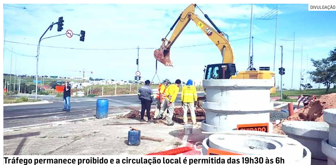
Tráfego permanece proibido e a circulação local é permitida das 19h30 às 6h

Da Redação • HORTOLÂNDIA tribunaliberal@tribunaliberal.com.br