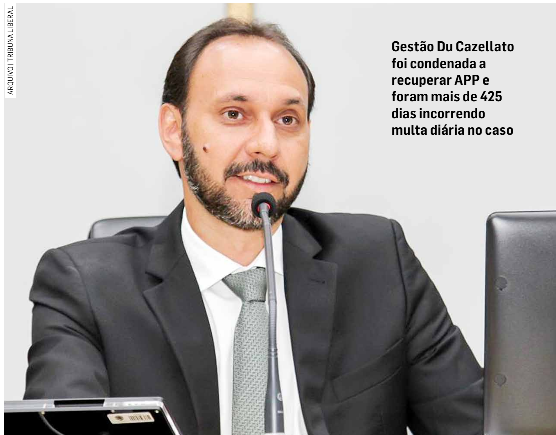
Gestão Du Cazellato foi condenada a recuperar APP e foram mais de 425 dias incorrendo multa diária no caso

Segundo a Promotoria, não foi juntado nenhum documento atualizado que comprovasse a inte-