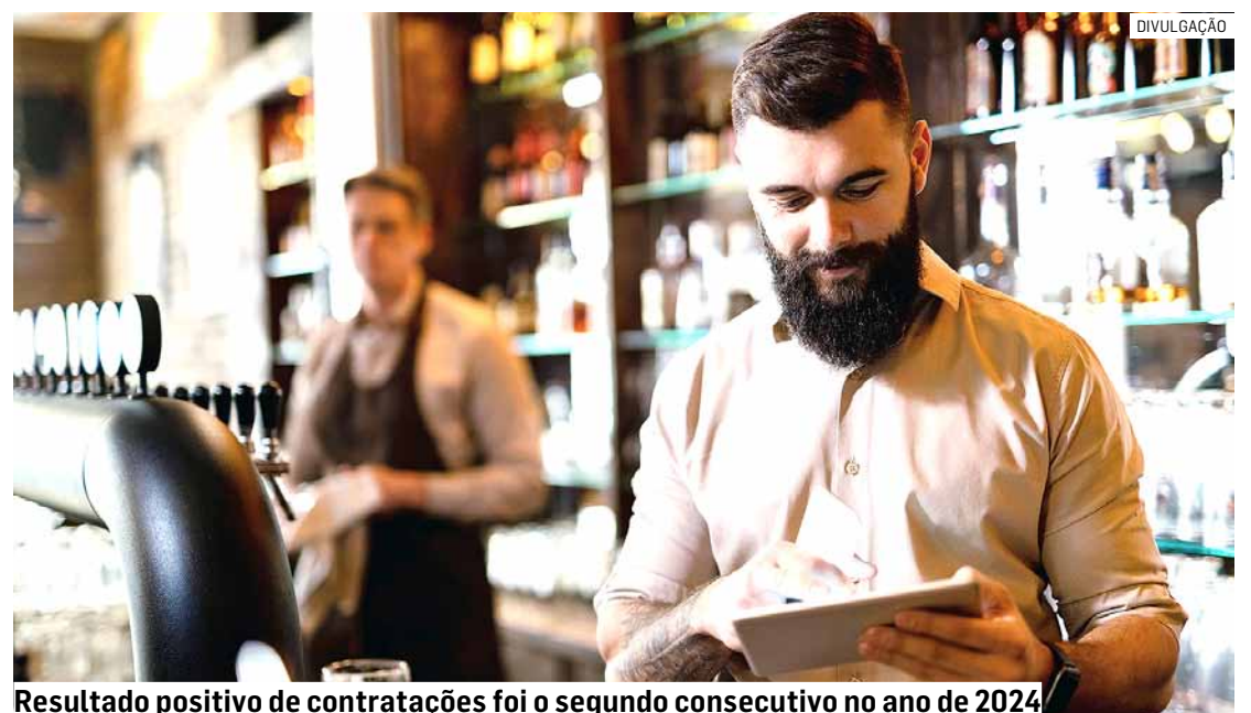
Resultado positivo de contratações foi o segundo consecutivo no ano de 2024

Da Redação • REGIÃO tribunaliberal@tribunaliberal.com.br