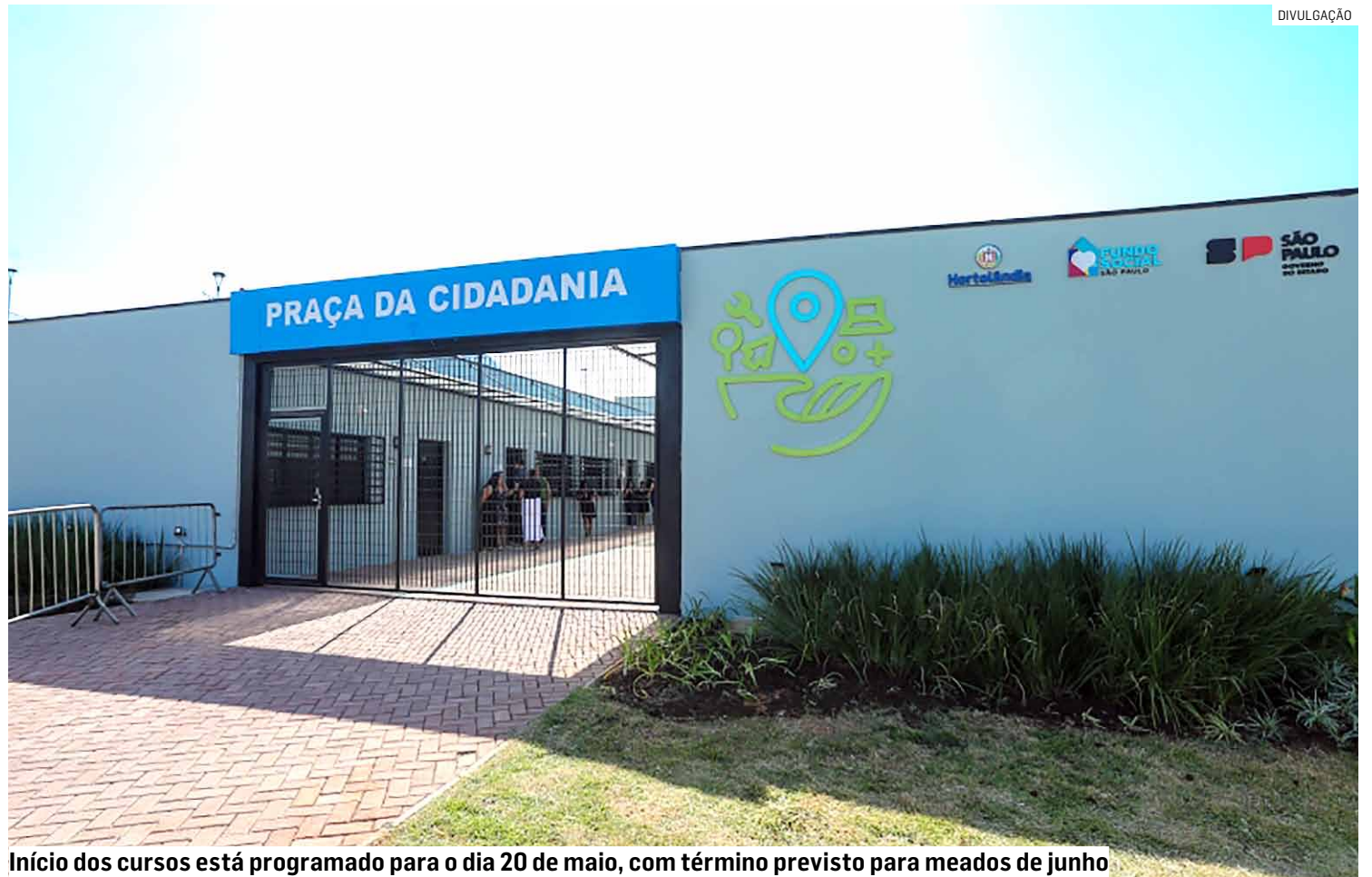
Início dos cursos está programado para o dia 20 de maio, com término previsto para meados de junho

A Praça da Cidadania é um programa estadual que promove a convivência comunitária por meio do fomento ao esporte, lazer e à capacitação profissionalizante, sobretudo a pessoas