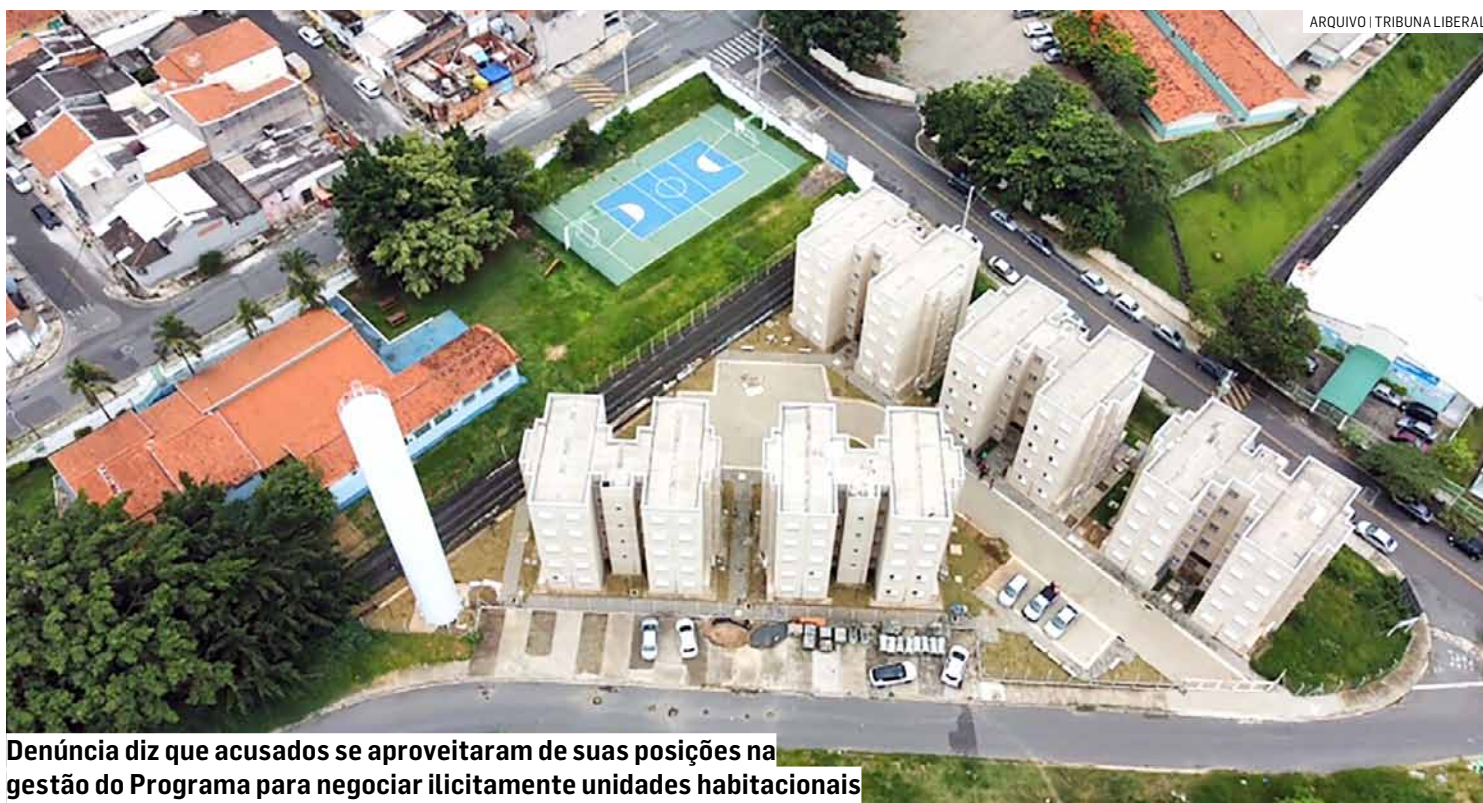
Denúncia diz que acusados se aproveitaram de suas posições na gestão do Programa para negociar ilicitamente unidades habitacionais

"As denúncias apresentadas são de moradores inadimplentes que estavam insatisfeitos com a cobrança do condomínio sendo que há débitos de algumas unidades até a presente data como pode ser comprovado. O condomínio é pobre e a inadimplência começou a ser muito grande, tendo em vista que o condomínio não conseguia pagar a folha de funcionários e nem as despesas mensais, foram feitas ações judiciais para a cobrança de condomínio, bem como da exclusão dos moradores dos condomínios pelas inadimplências, visto que o poder público nada fazia. O síndico nunca tirou nin-