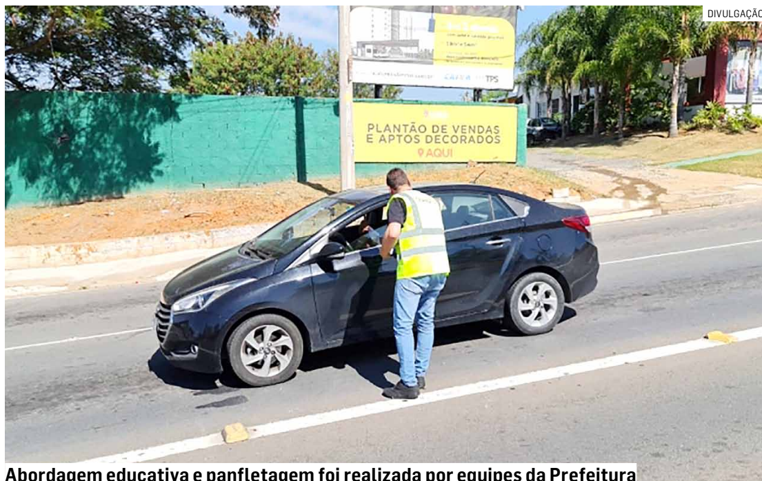
Abordagem educativa e panfletagem foi realizada por equipes da Prefeitura

Outra ação educativa aconteceu em parceria com a Secretaria de Educação,