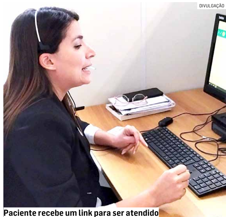
Paciente recebe um link para ser atendido