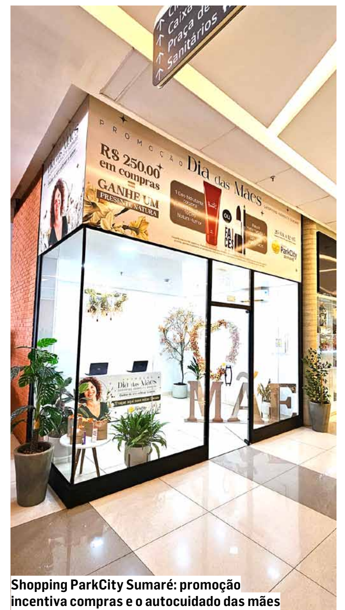
Shopping ParkCity Sumaré: promoção incentiva compras e o autocuidado das mães