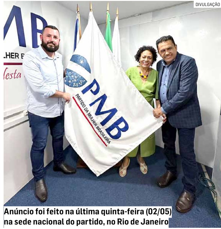
Anúncio foi feito na última quinta-feira (02/05) na sede nacional do partido, no Rio de Janeiro

A presidente do PMB acredita que a representatividade feminina nas esferas decisórias contribui para a implementação de políticas que promovam a equidade de gênero, o combate à violência contra a mulher, o acesso à saúde reprodutiva e outros temas relevantes para a construção de uma sociedade mais justa e igualitária. Dessa forma, a participação ativa das mulheres na gestão de políticas públicas municipais é essencial para garantir uma governança inclusiva e alinhada com as demandas da sociedade atual.