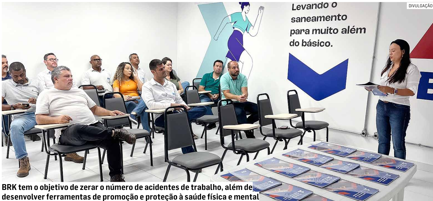
BRK tem o objetivo de zerar o número de acidentes de trabalho, além de desenvolver ferramentas de promoção e proteção à saúde física e mental

Com a cartilha reforçando os procedimentos de segurança, a empresa visa facilitar a compreensão e implementação das melhores práticas para evitar acidentes no local de trabalho, especialmente em tarefas críticas.