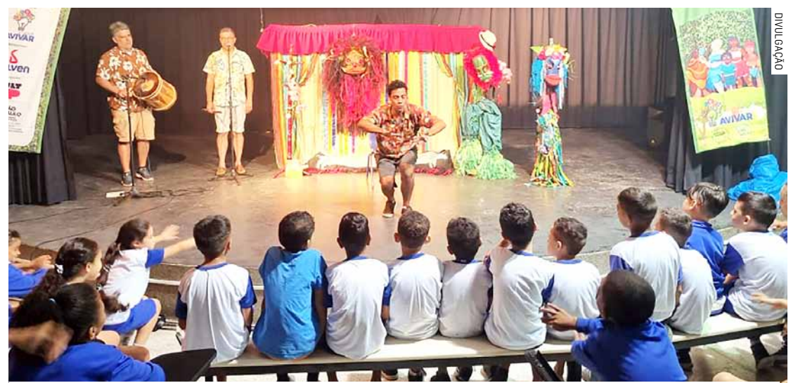
Iniciativa leva cultura a mais de 450 estudantes da Emef Salvador Zacharias Pereira Júnior

Da Redação • HORTOLÂNDIA tribunaliberal@tribunaliberal.com.br