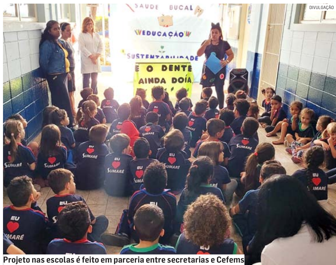
Projeto nas escolas é feito em parceria entre secretarias e Cefems