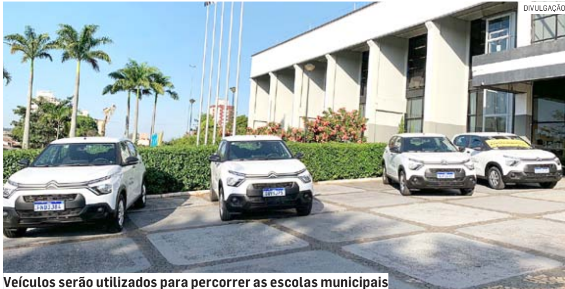
Veículos serão utilizados para percorrer as escolas municipais