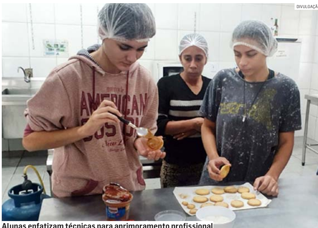
Alunas enfatizam técnicas para aprimoramento profissional

Iniciada em 17 de abril, a formação contou com dois módulos – "Bolos Caseiros" e "Produtos de Confeitaria para Cafeterias", com aulas ao longo de três semanas, tanto no período da manhã, quanto no da tarde.