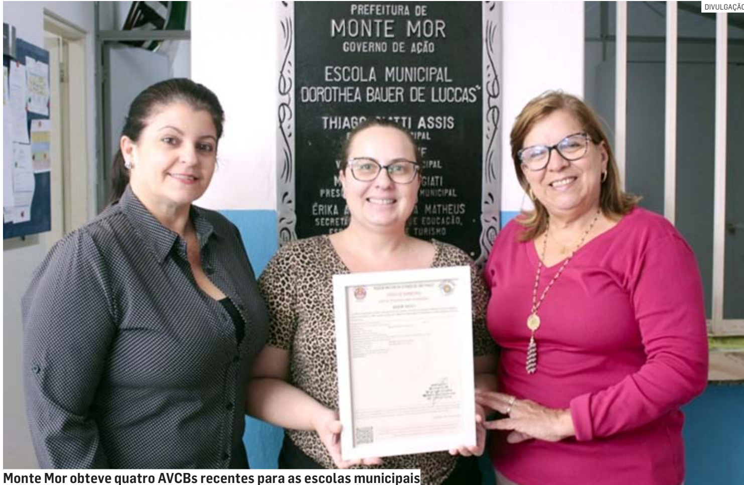
Monte Mor obteve quatro AVCBs recentes para as escolas municipais