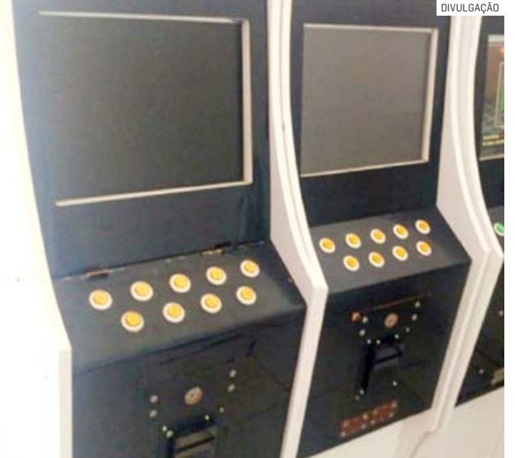
Máquinas de jogos de azar foram removidas de adega

Durante a averiguação no interior do estabelecimento, a polícia encontrou três máquinas caça niqueis funcionando atrás de um biombo.