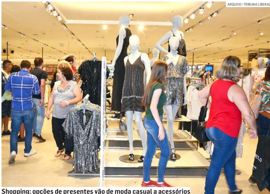
Shopping: opções de presentes vão de moda casual a acessórios

“As mães que apreciam os passeios na praia ou um dia de sol na piscina também não dispensam uma peça nova, que estão disponíveis na Boss