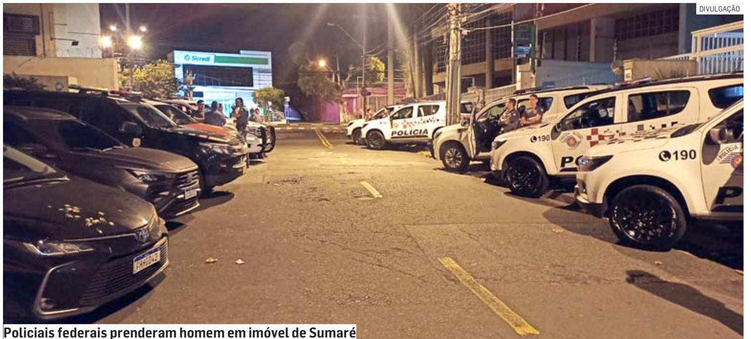
Policiais federais prenderam homem em imóvel de Sumaré

Em Hortolândia, cinco endereços foram alvos de buscas: Parque Orestes Ongaro, Jardim Nova Hortolândia, Jardim Nova América e Jardim Santana.