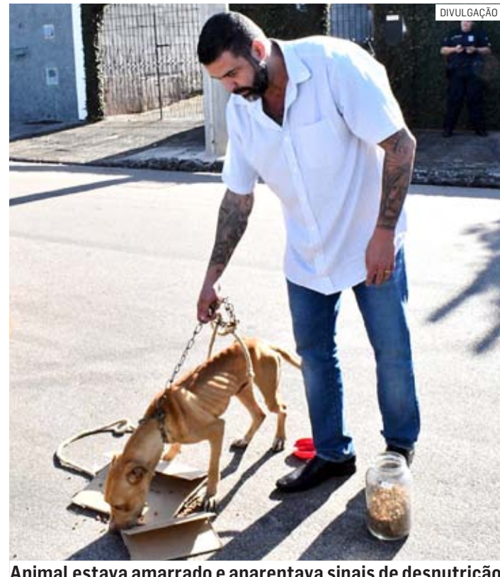
Animal estava amarrado e aparentava sinais de desnutrição