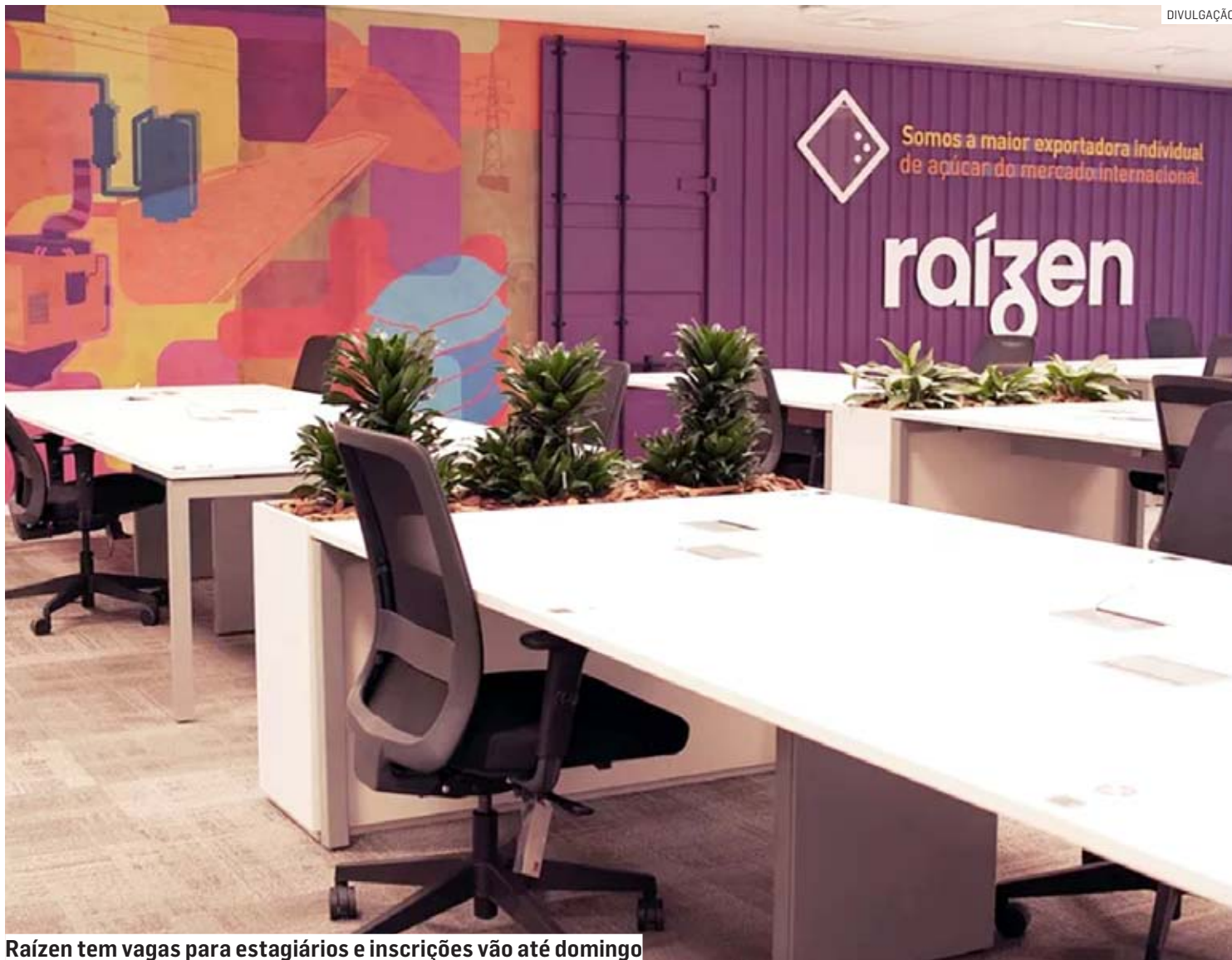
Raízen tem vagas para estagiários e inscrições vão até domingo

Podem concorrer estudantes de graduação com conclusão prevista entre julho de 2024 e julho de 2025. As vagas não exigem conhecimento na língua inglesa e nem experiência prévia. A carga horária é de seis horas diárias, com bolsa-auxílio mensal de R$ 2 mil e benefícios.