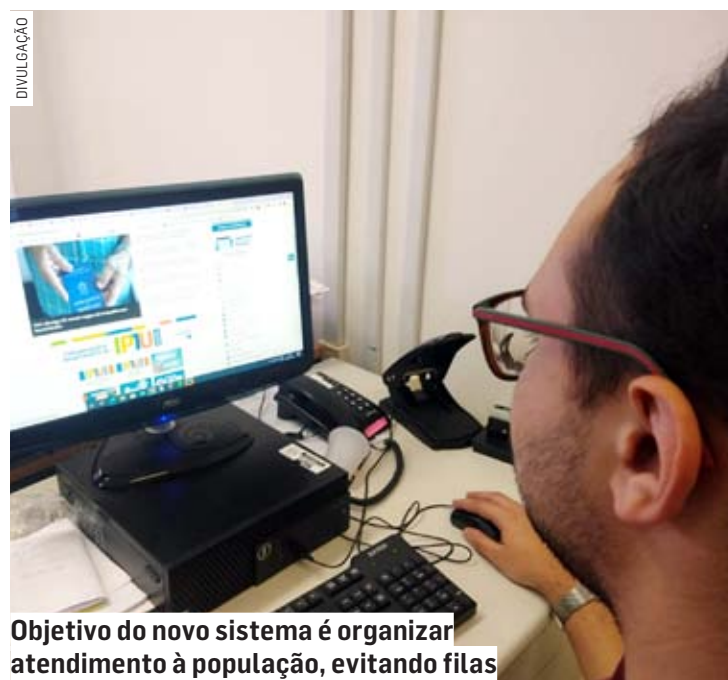
Objetivo do novo sistema é organizar atendimento à população, evitando filas