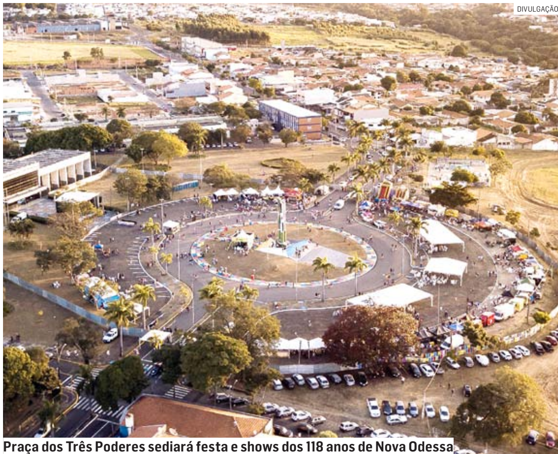
Praça dos Três Poderes sediará festa e shows dos 118 anos de Nova Odessa