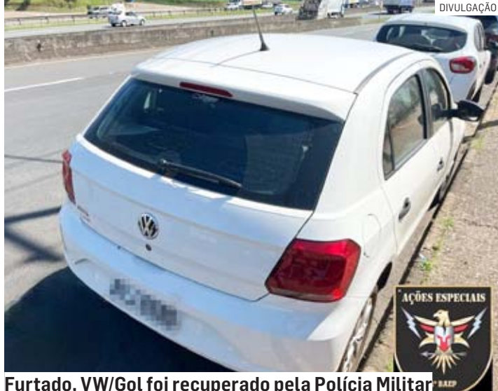
Furtado, VW/Gol foi recuperado pela Polícia Militar

Em seguida, policiais se deslocaram ao local e na rodovia acharam dois in-