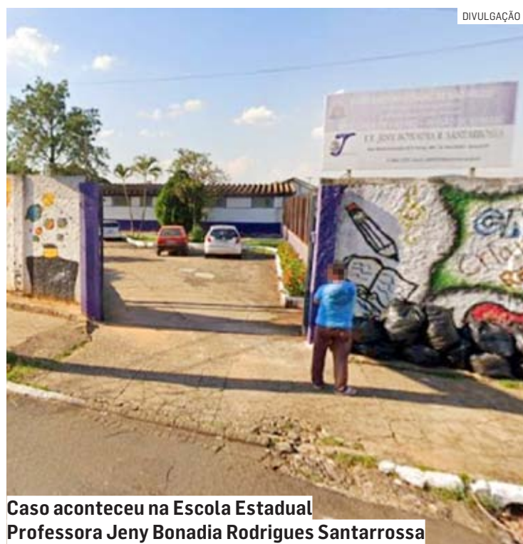
Caso aconteceu na Escola Estadual Professora Jeny Bonadia Rodrigues Santarossa