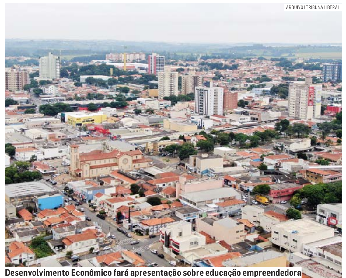
Desenvolvimento Econômico fará apresentação sobre educação empreendedora

Realizado anualmente durante 65 anos, o evento é ponto de encontro, de construção de alianças, mas sobretudo, de aprendizagem. Um ambiente que recebe também a iniciativa privada e a sociedade civil para o debate de ideias e de propostas, seja em forma de palestras e discussões plenárias, seja no espaço de convivência, onde acontece a exposição de produtos e projetos que visam auxiliar os gestores municipais na busca de soluções e inovação na esfera pública.