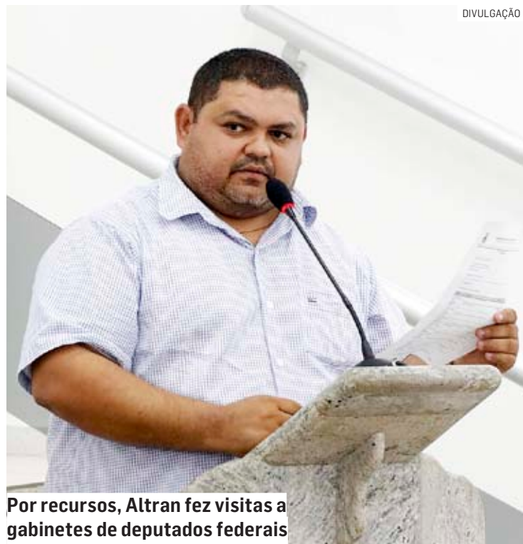
Por recursos, Altran fez visitas a gabinetes de deputados federais