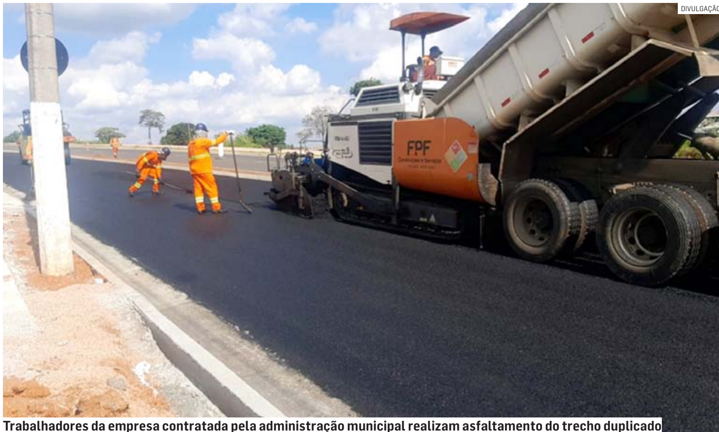
Trabalhadores da empresa contratada pela administração municipal realizam asfaltamento do trecho duplicado

De acordo com a empresa, o asfaltamento foi feito em um trecho de 600 metros, que vai da rotatória inaugurada até a altura da entrada do Residencial Anauá. A extensão total da duplicação da estrada é de um quilômetro, terminando em outra rotatória