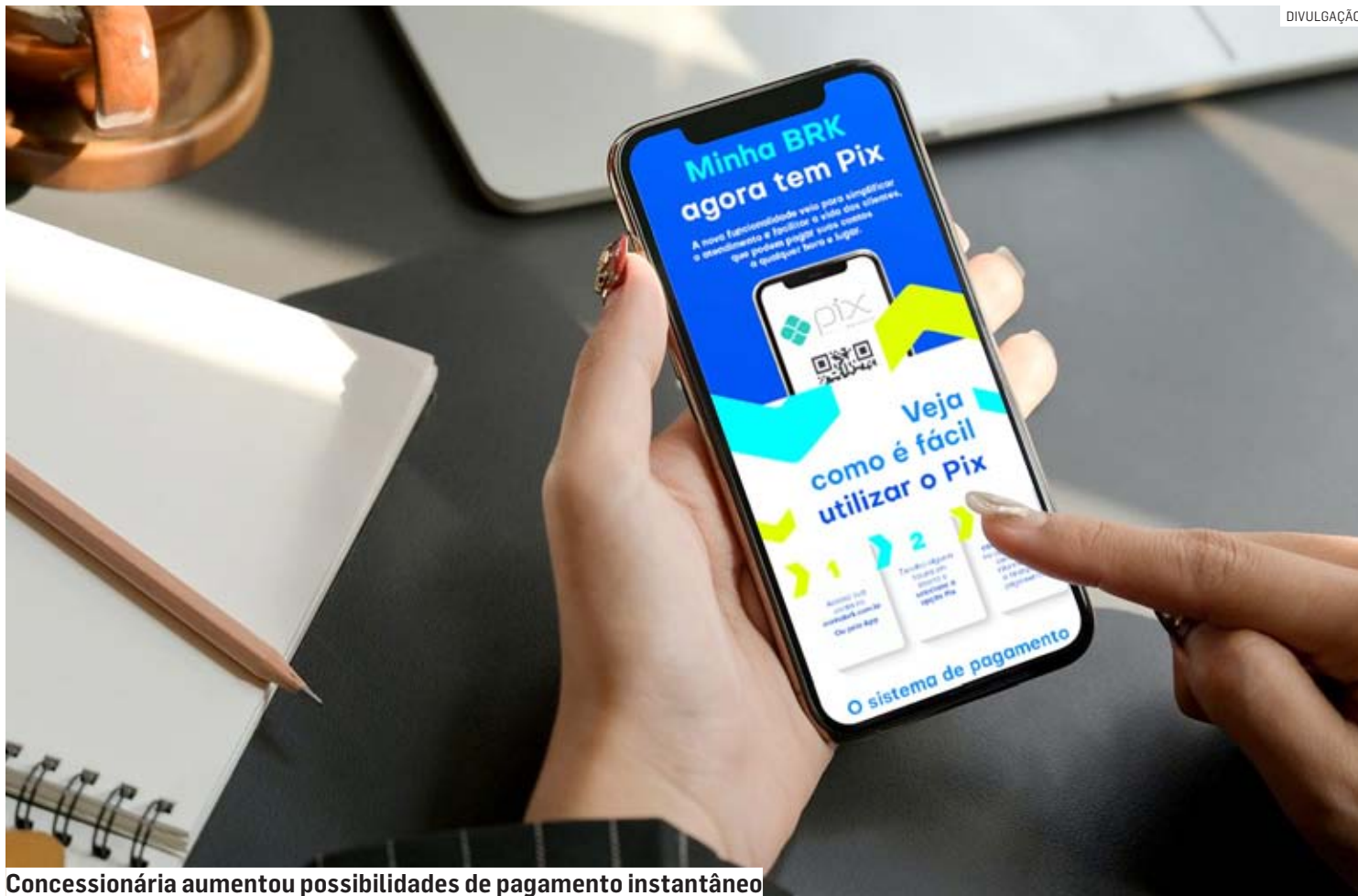
Concessionária aumentou possibilidades de pagamento instantâneo

“Desde que o PIX foi incorporado às opções de pagamento da concessionária, o número de transações por esse mecanismo instantâneo só cresce. Trata-se de uma tendência comercial, o pagamento eletrônico é realizado em tempo real. E