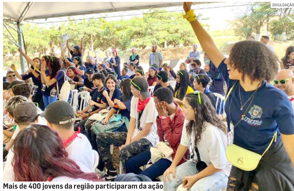
Mais de 400 jovens da região participaram da ação