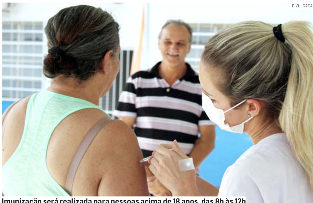
Imunização será realizada para pessoas acima de 18 anos, das 8h às 12h

A vacinação contra a Covid será em crianças de seis meses a 11 anos e pessoas a partir de 18 anos. Também será disponibilizada no sábado a vacina bivalente contra a Co-