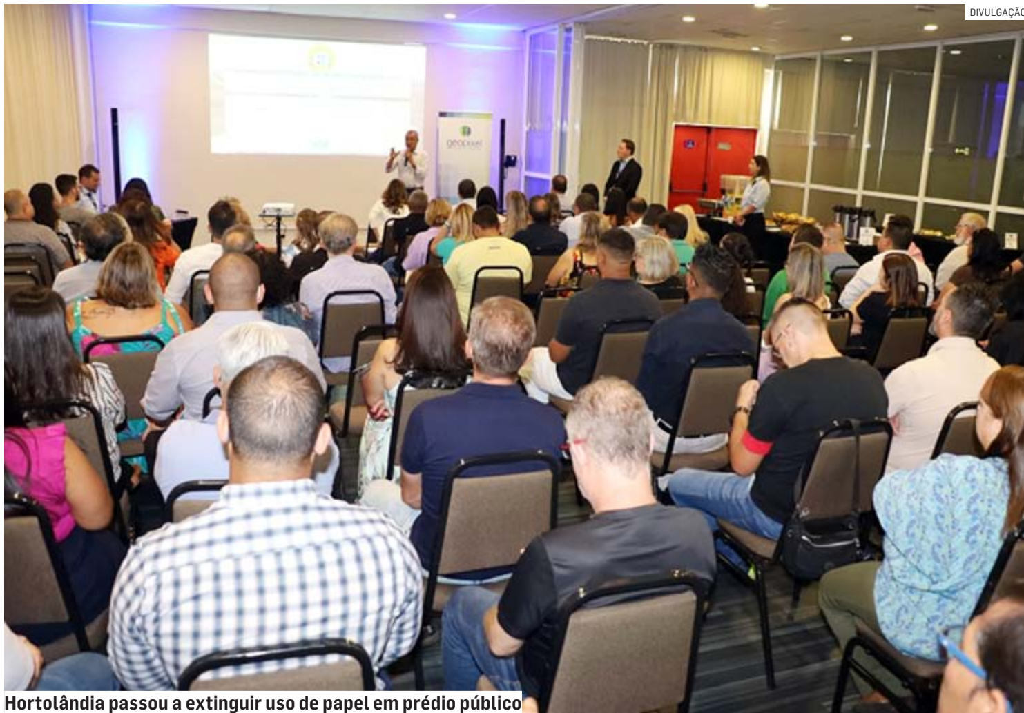
Hortolândia passou a extinguir uso de papel em prédio público

De acordo com o prefeito José Nazareno Zezé Gomes (PL), o tempo de aprovação de serviços relacionados à construção civil em Hortolândia caiu pela metade. Além disso, pelo novo modelo de solicitação ser totalmente digital, não há necessidade do uso do papel. "Definitivamente, Hortolândia está entrando de cabeça no Século XXI. A aprovação online vem sendo um sucesso. Ela facilita a vida dos proprietários que buscam construir, reformar, demolir, ampliar, entre outras ações que necessitam de aprovação por parte do poder públi-