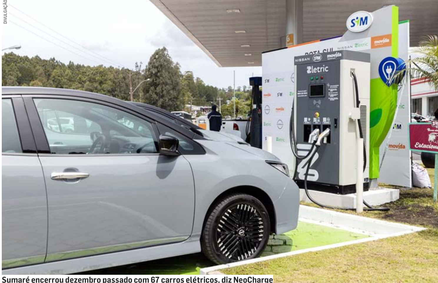
Sumaré encerrou dezembro passado com 67 carros elétricos, diz NeoCharge

Tais veículos vêm ganhando adeptos, mesmo com os valores ainda pouco acessíveis: há veículos a partir da faixa dos R$ 150 mil. O mercado de veículos leves eletrificados no Brasil entra em 2023 com mais um recorde a comemorar: as vendas de 2022 atingiram 49.245 veículos, ou 41% acima de 2021 (34.990). É um total próximo da meta anunciada pela ABVE (Associação Brasileira de Veículos Elétricos), de