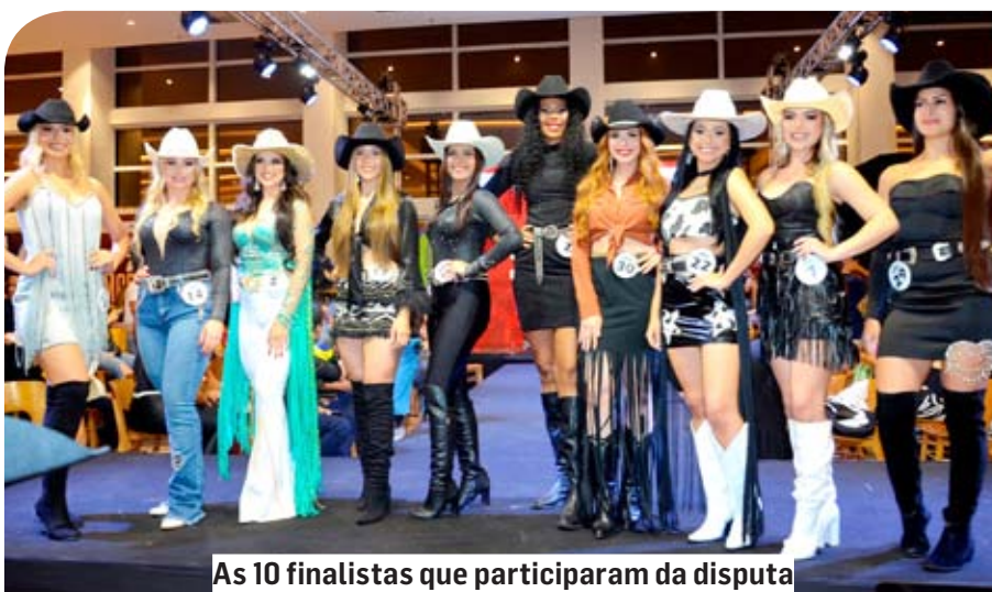
As 10 finalistas que participaram da disputa