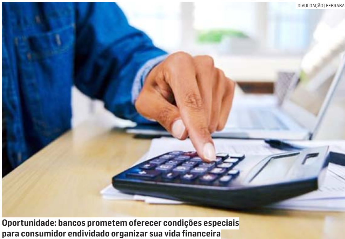
Oportunidade: bancos prometem oferecer condições especiais para consumidor endividado organizar sua vida financeira

“Quem trabalha por conta passou momentos difíceis durante a pandemia. Fiz o empréstimo porque estava com dificuldade para comprar até comida. Me enrolei e acabei ficando em dívida com o banco. Espero conseguir uma boa proposta na negociação para acertar o que devo”, afirma a artesã, que pediu para