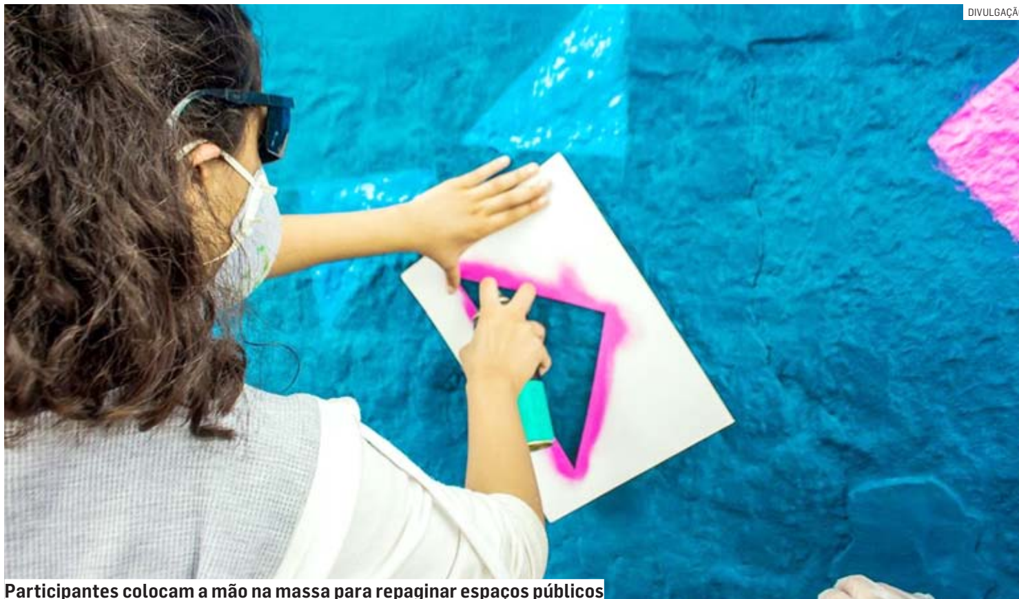
Participantes colocam a mão na massa para repaginar espaços públicos

Socialização e cidadania: segunda edição do projeto realizado pela Numen Produtora ministra aulas de grafite e desenvolvimento de mobiliário urbano para jovens a partir dos 14 anos em duas escolas