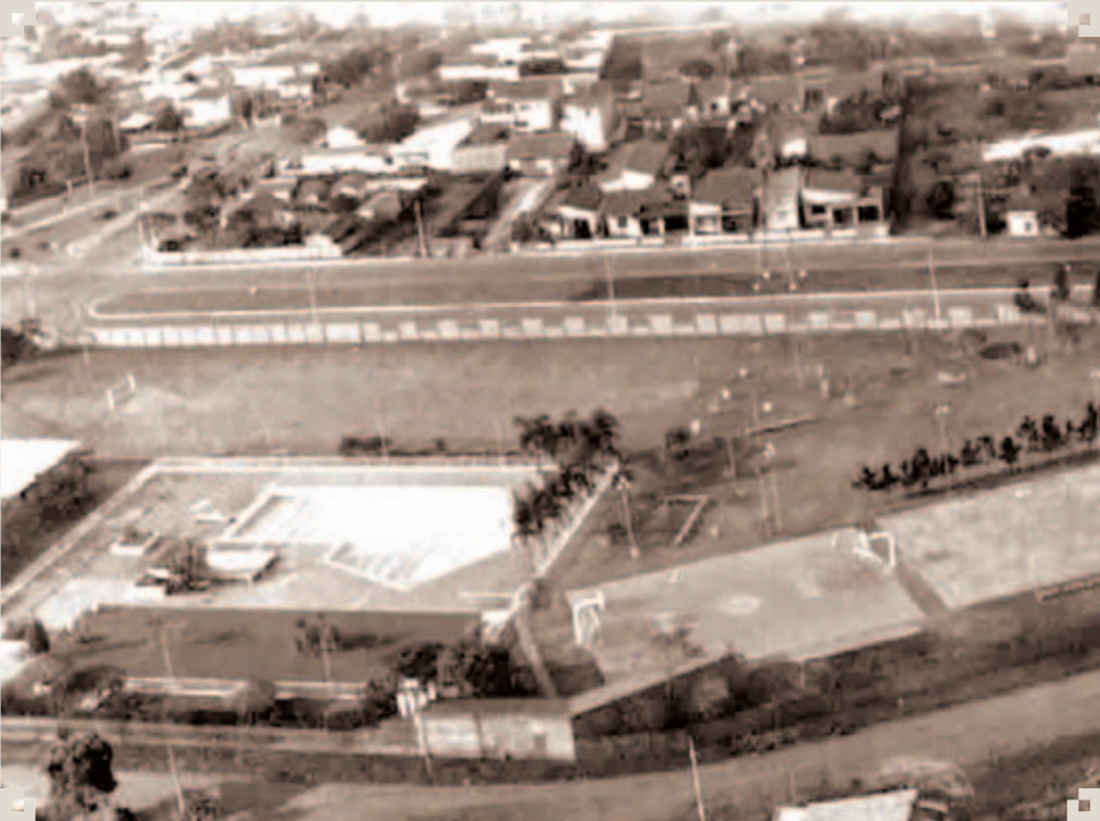
Foto de meados dos anos 1970, do conjunto poliesportivo da Avenida Rebouças do Clube Recreativo Sumaré. Ao fundo, fazendo frente para a Avenida, o muro divisório que estava sendo construído; destaque para as árvores que tinham plantadas recentemente. Ao fundo, notam-se inúmeros lotes vazios, com frente para a Avenida Rebouças.