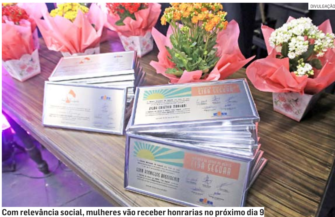
Com relevância social, mulheres vão receber honrarias no próximo dia 9

“Os diplomas Cida Segura e Anita Garibaldi são uma importante realização da Câmara, que na atual legislatura conta apenas com vereadores homens. É uma forma de trazer as mu-