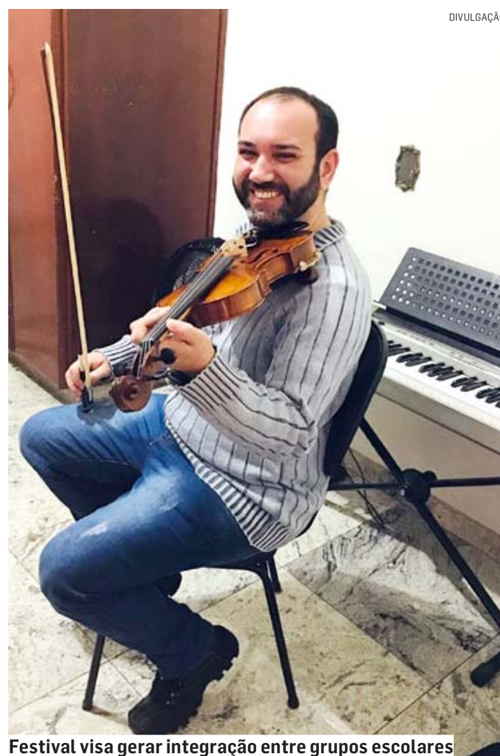
Festival visa gerar integração entre grupos escolares

Os interessados deverão acessar a plataforma online, disponibilizada nas redes sociais e diretamente na Escola e Conservatório Coronato e se atentar aos prazos. A data limite para as ins-