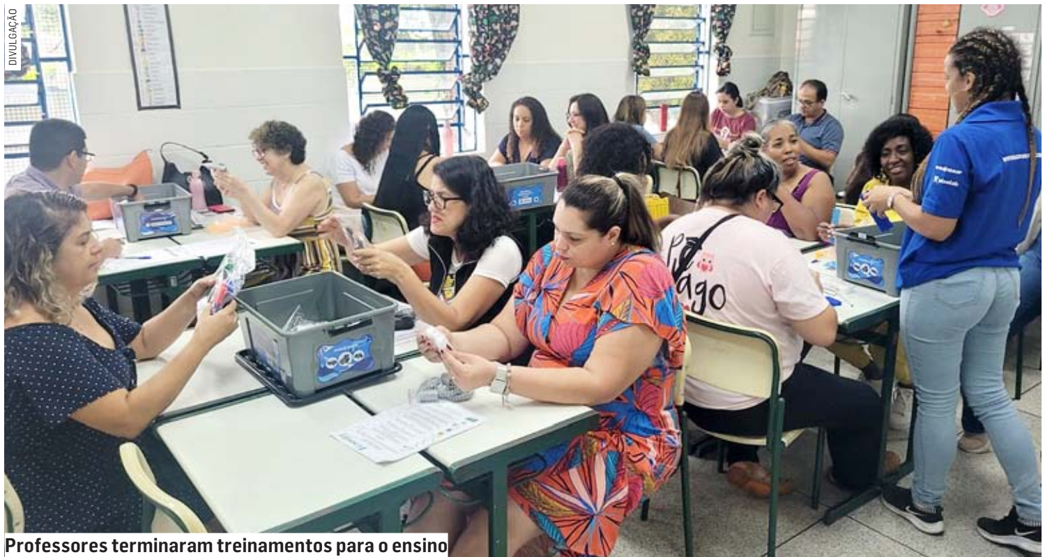
Professores terminaram treinamentos para o ensino