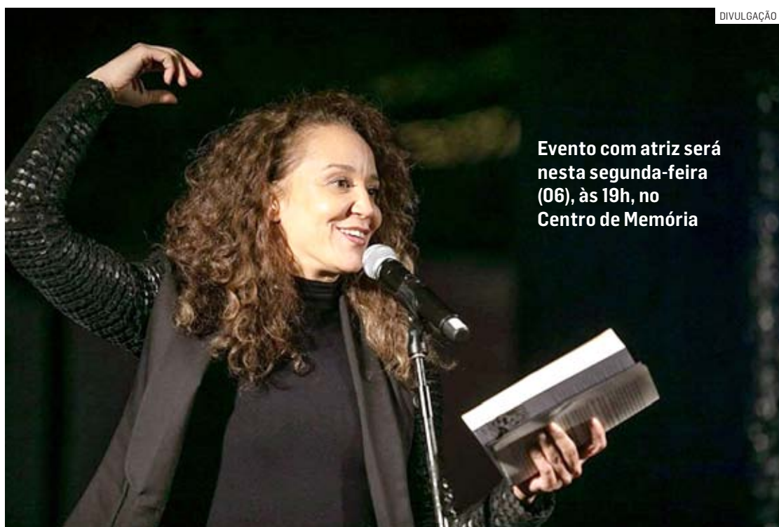
Evento com atriz será nesta segunda-feira (06), às 19h, no Centro de Memória