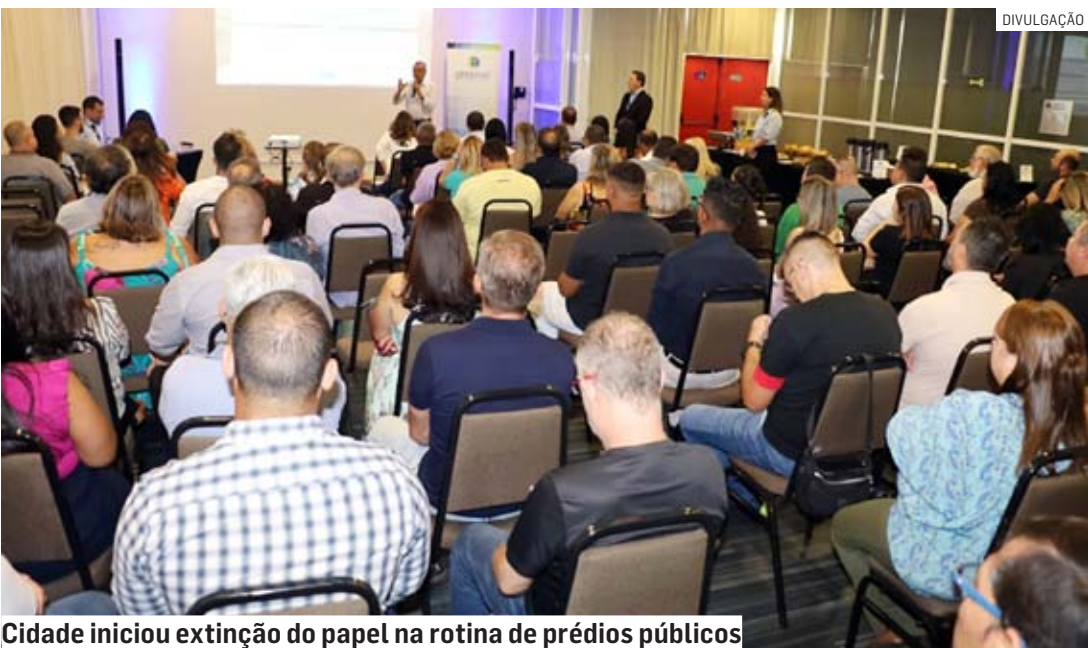
Cidade iniciou extinção do papel na rotina de prédios públicos