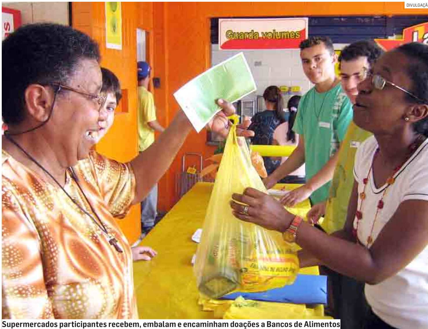
Supermercados participantes recebem, embalam e encaminham doações a Bancos de Alimentos

Material arrecadado será encaminhado para Bancos de Alimentos de cada cidade, e posteriormente distribuído para instituições carentes