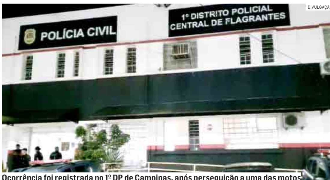
Ocorrência foi registrada no 1º DP de Campinas, após perseguição a uma das motos

um condutor desviou pela contramão e o outro tomou sentido Campinas. A viatura resolveu seguir em acompanhamento.