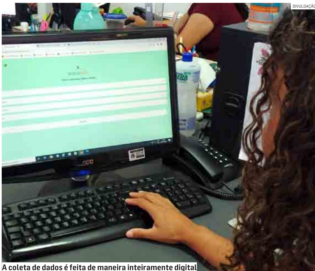
A coleta de dados é feita de maneira inteiramente digital

Segundo dados encaminhados ao Hortoprev, até 31 de outubro, 521 nomes haviam sido enviados para a base de dados da autarquia, sendo que, destes, 178 apresentavam pendências. A empresa contratada pela autarquia encaminhará ao Departamento de Gestão de Pessoas a rela-