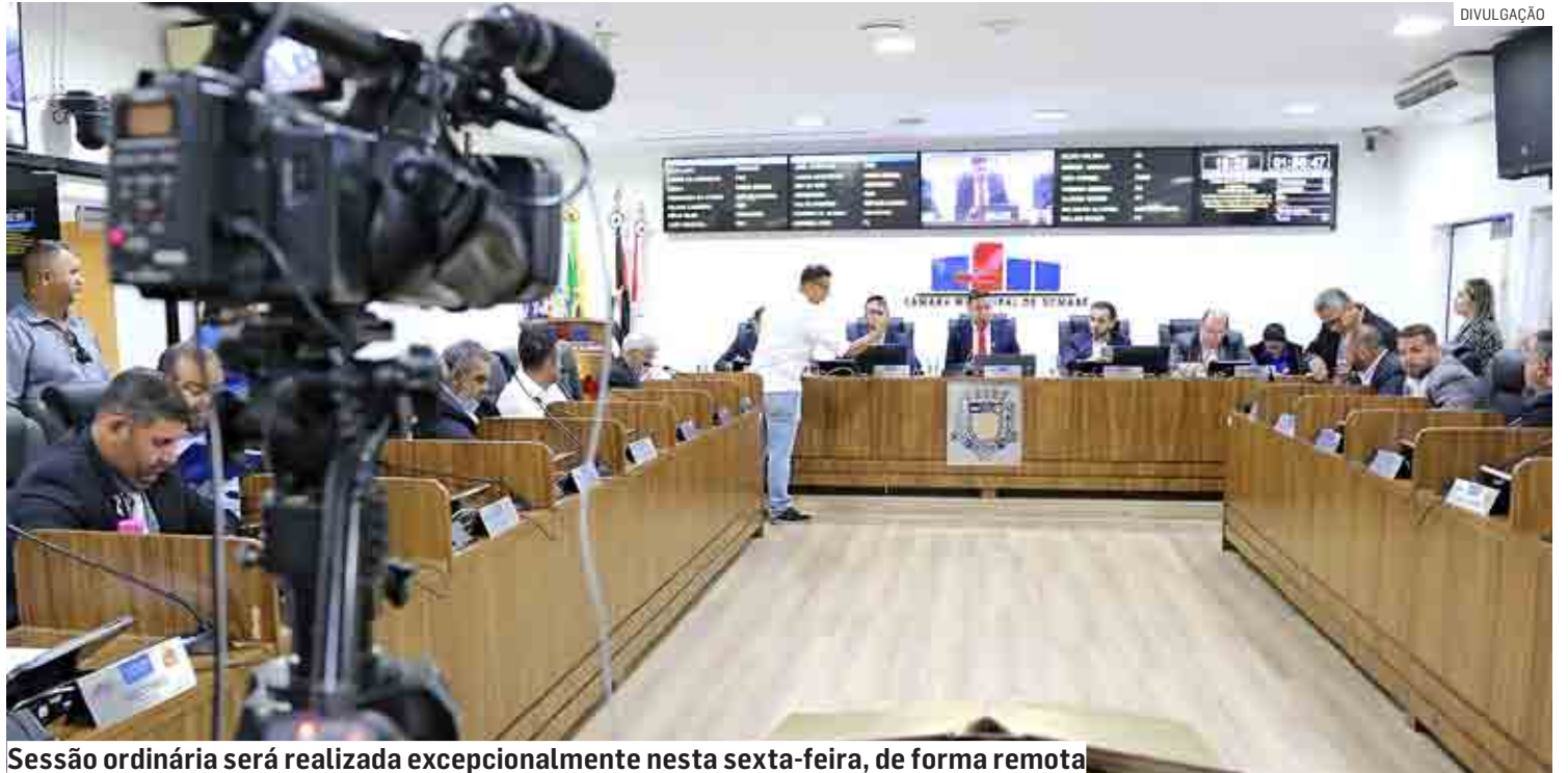
Sessão ordinária será realizada excepcionalmente nesta sexta-feira, de forma remota

A Câmara realiza sessão ordinária nesta sexta-feira (4), a partir das 10h, de forma remota, com os vereadores participando por videoconferência. O encontro será transmitido para a população pelo canal da Câmara no YouTube, em tempo real, como normalmente já acontece. Regimentalmente realiza-se às terças-feiras, a sessão