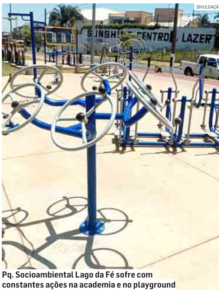
Pq. Socioambiental Lago da Fé sofre com constantes ações na academia e no playground

cessitam de mais de um dia para concluir as ações. O tempo do serviço também aumenta quando estas áreas públicas de lazer sofrem com o vandalismo. Há necessidade de arrumar os brinquedos do playground ou aparelhos da academia de ginástica, peças que mais sofrem com o vandalismo, por is-