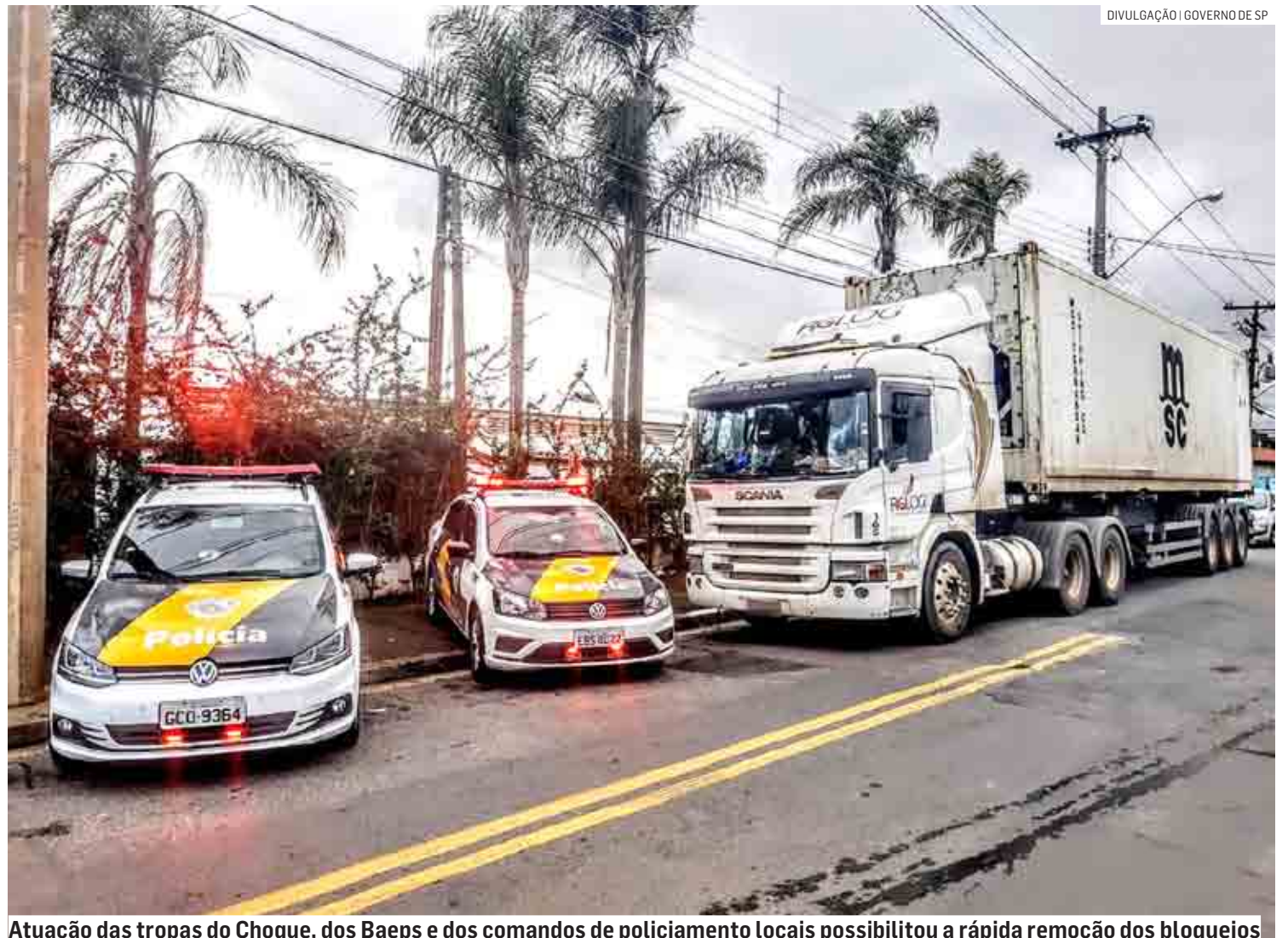
Atuação das tropas do Choque, dos Baeps e dos comandos de policiamento locais possibilitou a rápida remoção dos bloqueios

Na tarde desta quarta-feira (2), a Rodovia Castello Branco foi liberada por equipes do Batalhão de Choque da PM por meio de ação de controle de distúrbios, em que foram utilizados o veículo lançador de água e