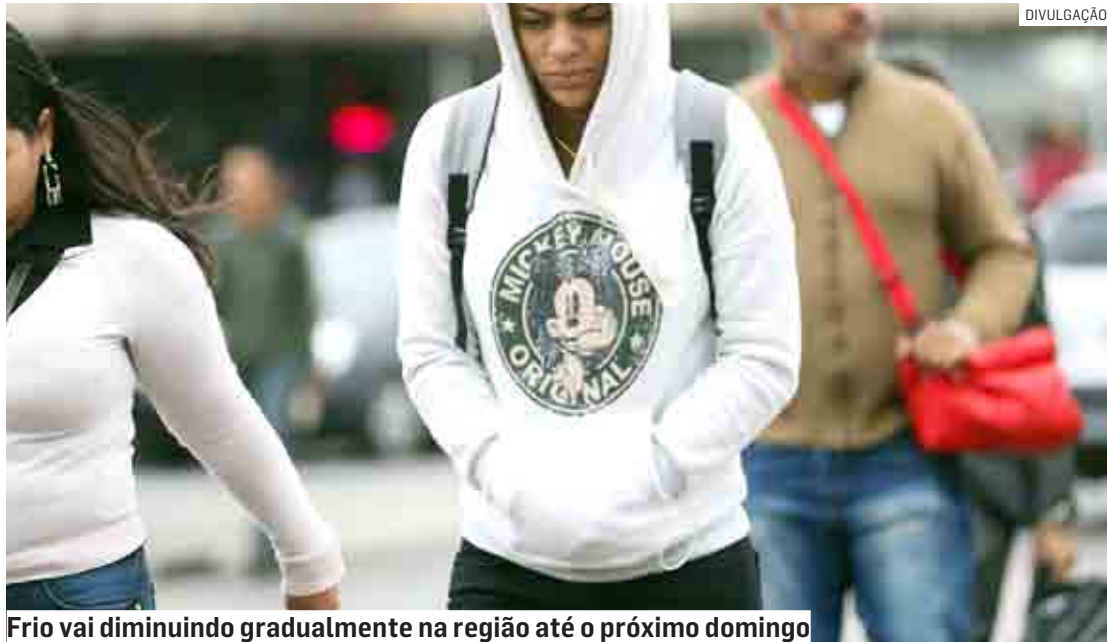
Frio vai diminuindo gradualmente na região até o próximo domingo