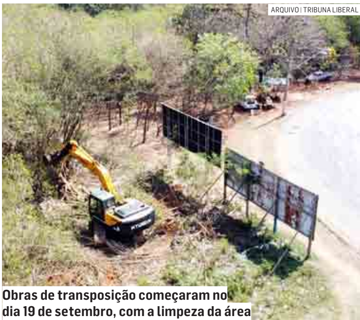
Obras de transposição começaram no dia 19 de setembro, com a limpeza da área

Cristiane Caldeira | SUMARÉ cris.caldeira@tribunaliberal.com.br