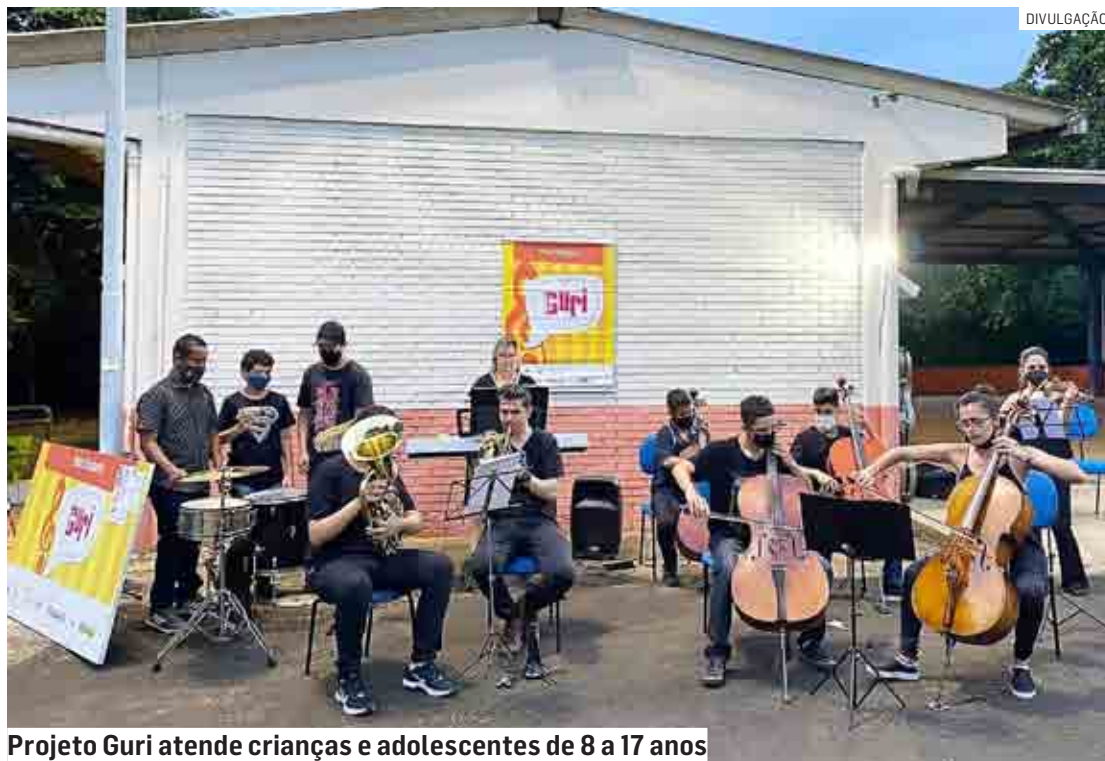
Projeto Guri atende crianças e adolescentes de 8 a 17 anos

Na audição, os estudantes mostram aos professores e convidados as habilidades conquistadas durante as aulas do projeto. A apresentação contará