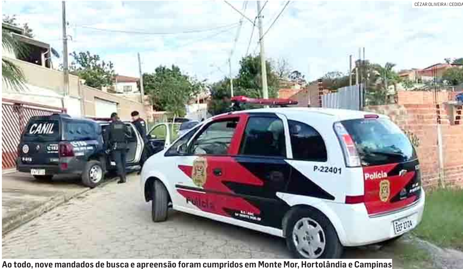
Ao todo, nove mandados de busca e apreensão foram cumpridos em Monte Mor, Hortolândia e Campinas

As detenções foram feitas pela Polícia Civil, com apoio da Polícia Militar e Guarda Civil Municipal, que cumpriram nove mandados de busca e apreensão no bairro Santa Clara do Lago, próximo a Campinas. Ao todo, nove mandados de busca e apreensão