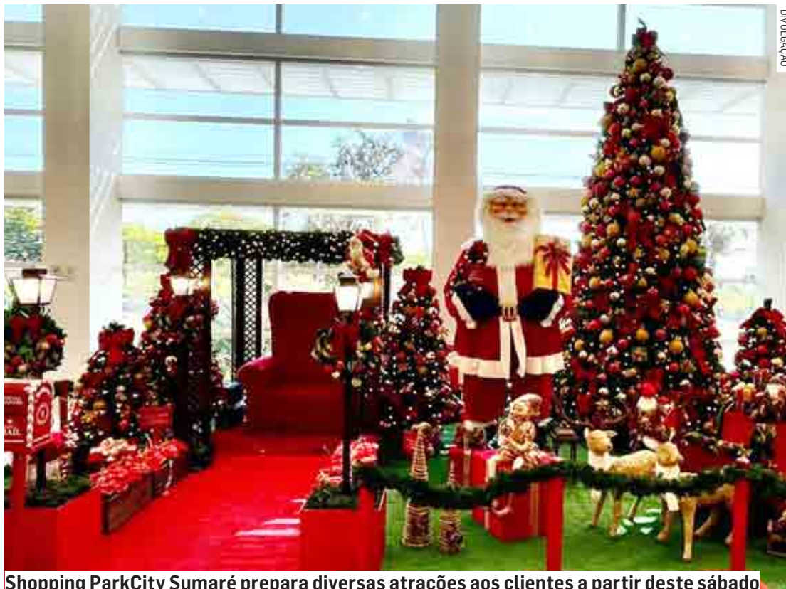
Shopping ParkCity Sumaré prepara diversas atrações aos clientes a partir deste sábado.

“Tudo estará muito iluminado e festivo. Não serão apenas os dois cenários com detalhes natalinos. A decoração do Shopping estará em todos os locais, com outras