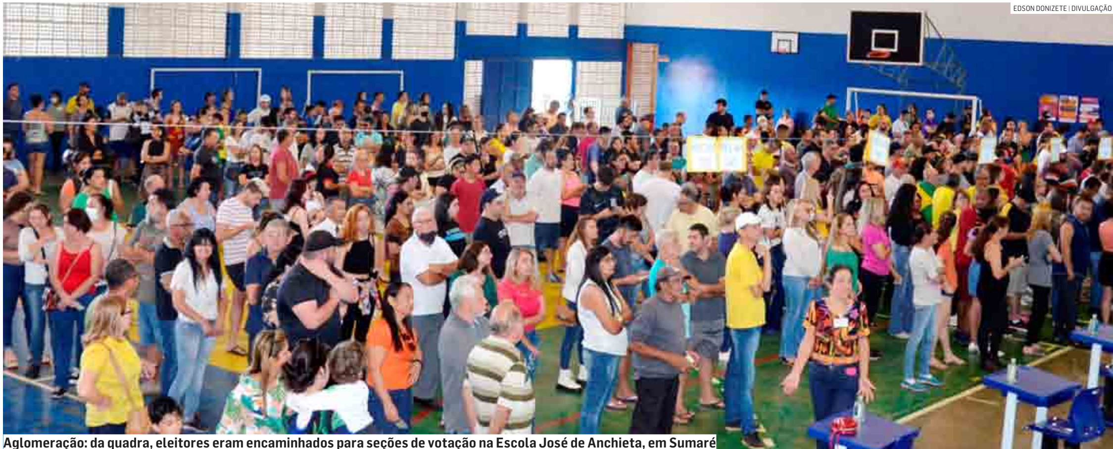
Agglomeração: da quadra, eleitores eram encaminhados para seções de votação na Escola José de Anchieta, em Sumaré