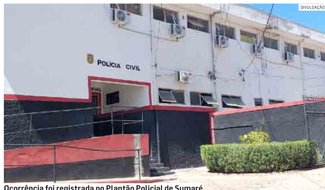
Ocorrência foi registrada no Plantão Policial de Sumaré

A ocorrência foi registrada no Plantão Policial de Sumaré, onde o caso será investigado.