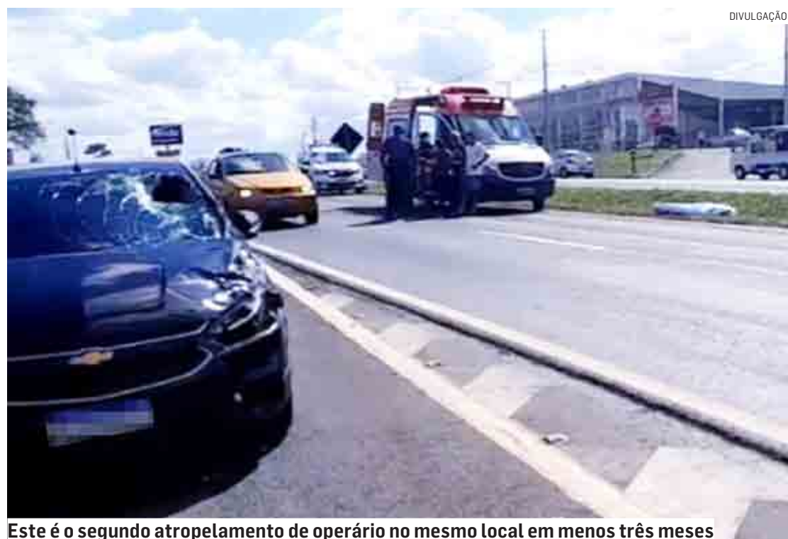
Este é o segundo atropelamento de operário no mesmo local em menos três meses

O motorista fez teste de bafômetro, que não acusou embriaguez. Após todos os procedimentos, a polícia registrou o caso no Plantão Policial de Sumaré.