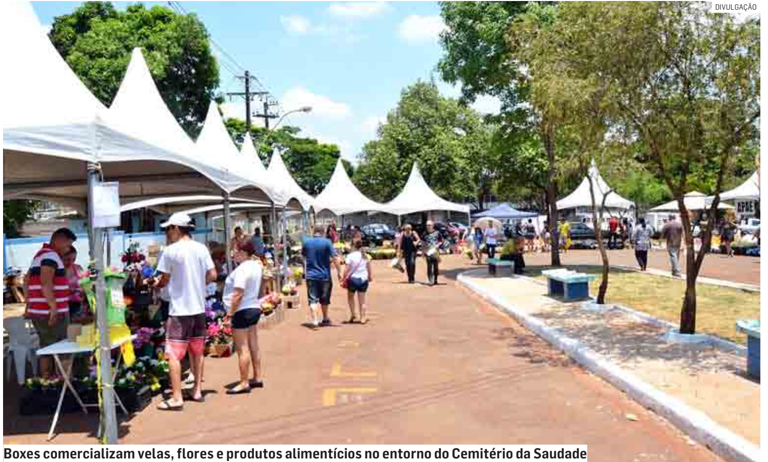
Boxes comercializam velas, flores e produtos alimentícios no entorno do Cemitério da Saudade

da Secretaria de Serviços Públicos, na Rua Antônio Pereira de Camargo, 276, no Centro. O sorteio dos comerciantes selecionados acontece no dia 17 de outubro, às 14h, no Anfiteatro Dirce Pinto Dalben, no Centro Administrativo de Nova Veneza. Para efetivar a inscrição, os comerciantes deverão apresentar cópias e originais do RG, CPF, certidão de nascimento, certidão de casamento, comprovante de endereço, inscrição municipal e o carnê do ISSQN (Imposto Sobre Serviços de Qualquer Natureza). Podem participar apenas residentes em Sumaré. “Realizado o sorteio, a fiscalização avaliará os documentos dos inscritos. É importante ressaltar que somente será autorizado um box por pessoa física e não mais do que um por família, isto não é, não será permiti-