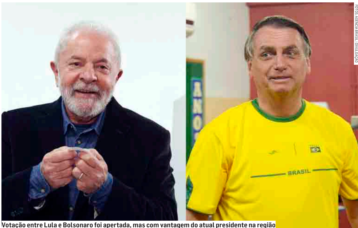
Votação entre Lula e Bolsonaro foi apertada, mas com vantagem do atual presidente na região

O mesmo cenário foi observado na disputa pelo governo do Estado. Tarcísio de Freitas (Republicanos) venceu Fernando Haddad (PT) em todas as cidades. O candidato do presidente Jair Bolsonaro obteve 51,21% dos votos em Nova Odes-