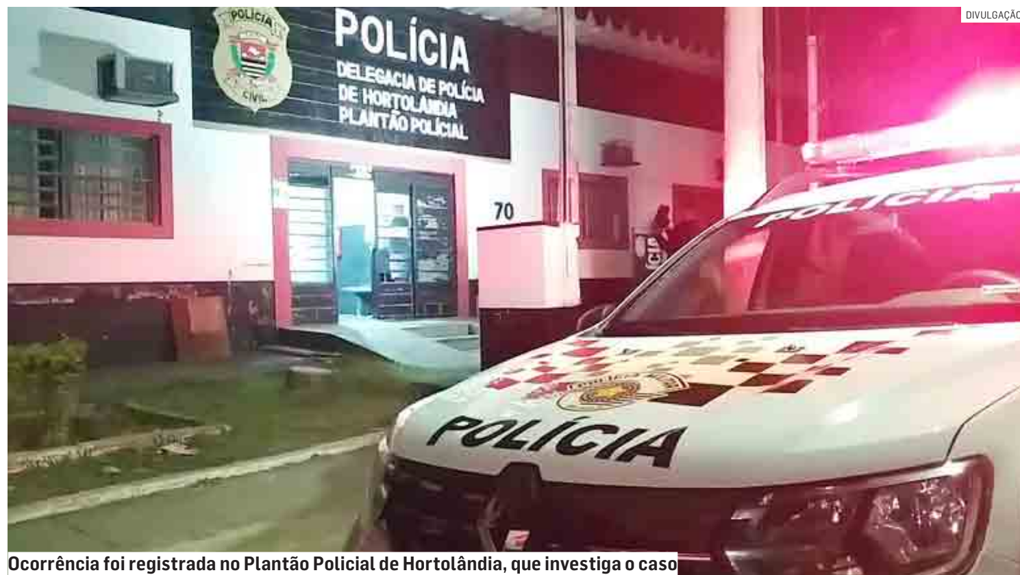
Ocorrência foi registrada no Plantão Policial de Hortolândia, que investiga o caso

Segundo testemunha, vítima estava em frente da residência quando um homem usando touca ninja e armado desceu de um veículo, anunciou assalto e correu atrás dela, que tentou se proteger dentro do banheiro