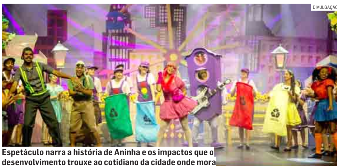
Espectáculo narra a história de Aninha e os impactos que o desenvolvimento trouxe ao cotidiano da cidade onde mora

O espetáculo narra a história de Aninha e os impactos que o desenvolvimento trouxe ao cotidiano da cidade onde mora. Com o objetivo de estimular a consciência sobre trânsito e meio ambiente, a menina, sua boneca Lili, o Sr. Agente de Trânsito e o Sr. Semáforo se reúnem com as outras crianças do lugar para transformar a maneira com que os moradores se relacionam com a cidade.