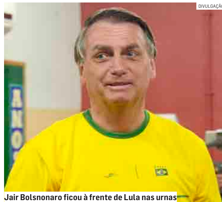
Jair Bolsonaro ficou à frente de Lula nas urnas

Jair Messias Bolsonaro (PL) foi o candidato mais votado em todas as cidades da região. A cidade em que o atual presidente obteve mais vantagem em relação a Luiz Inácio Lula da Silva (PT) foi em Nova Odessa, onde teve 56,29% dos votos (20.467 votos), contra 34,61% (12.583 votos) do adversário. Em Sumaré, o atual presidente teve 51,02% dos votos (75.666 votos) contra 40,76% de Lula (60.453 votos). PÁGINA 08