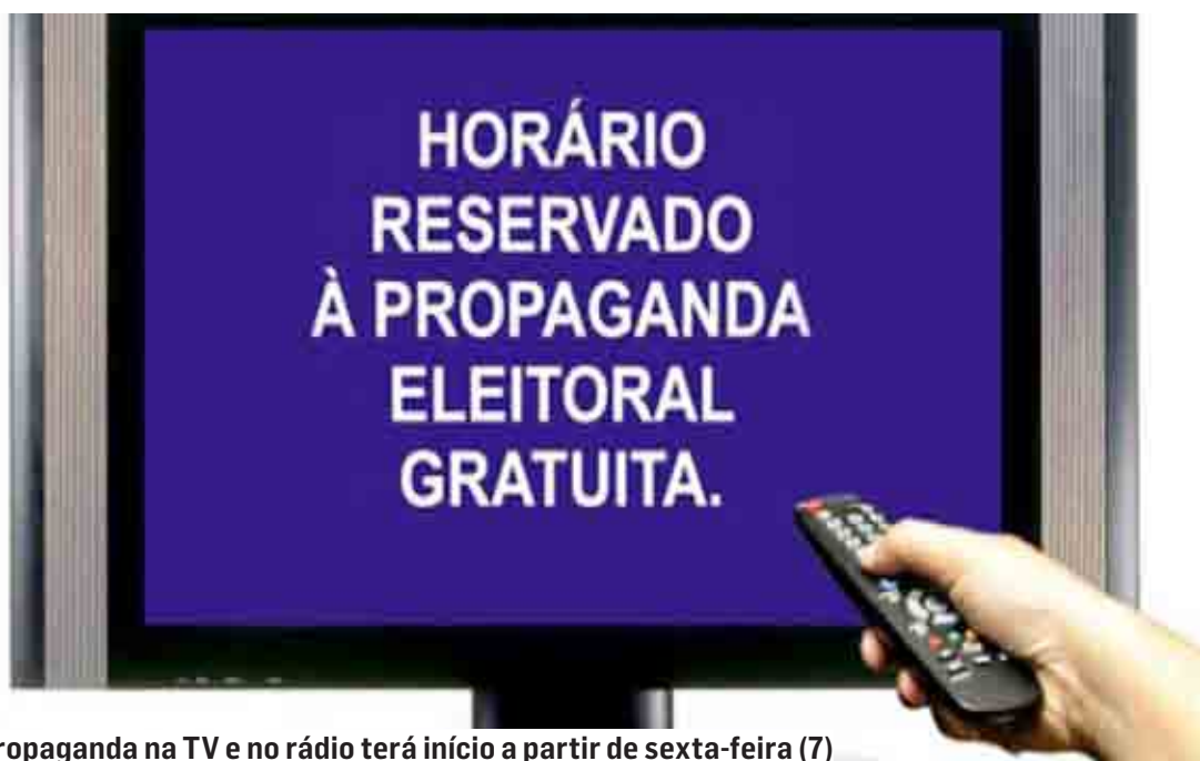
Propaganda na TV e no rádio terá início a partir de sexta-feira (7)

Desde as 17h desta segunda-feira (3), estão liberadas a propaganda eleitoral por alto-falantes ou amplificadores de som – das 8h às 22h – bem como a distribuição de material gráfico, caminhada, carreta ou passeata, acompanhada ou não por carro de som ou minitrío. Também estão liberados os comícios e a propaganda na internet.