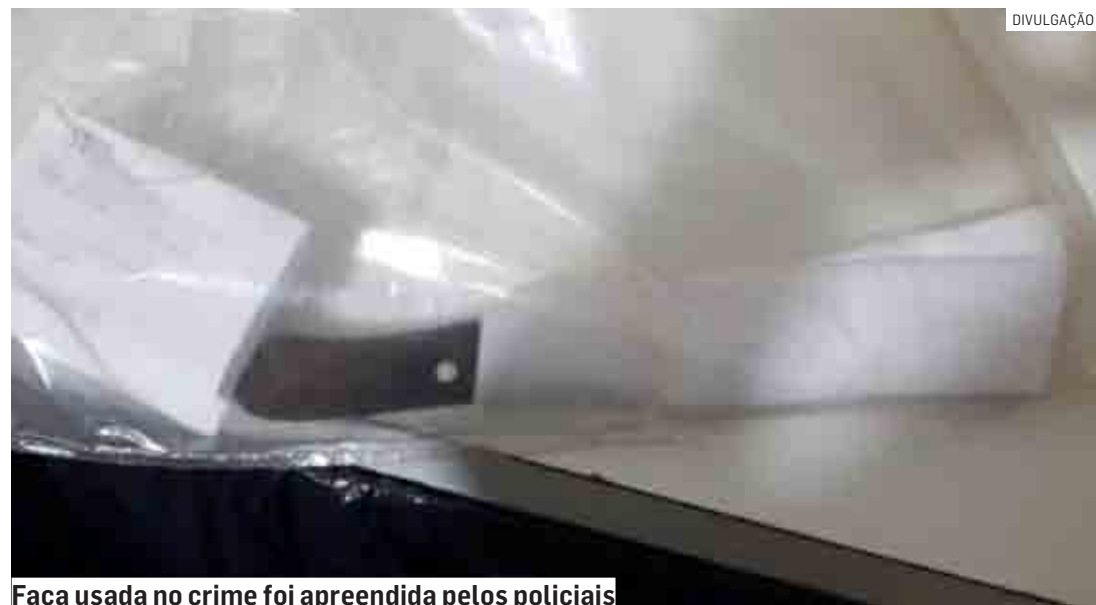
Faca usada no crime foi apreendida pelos policiais

Cézar Oliveira | HORTOLÂNDIA tribunaliberal@tribunaliberal.com.br