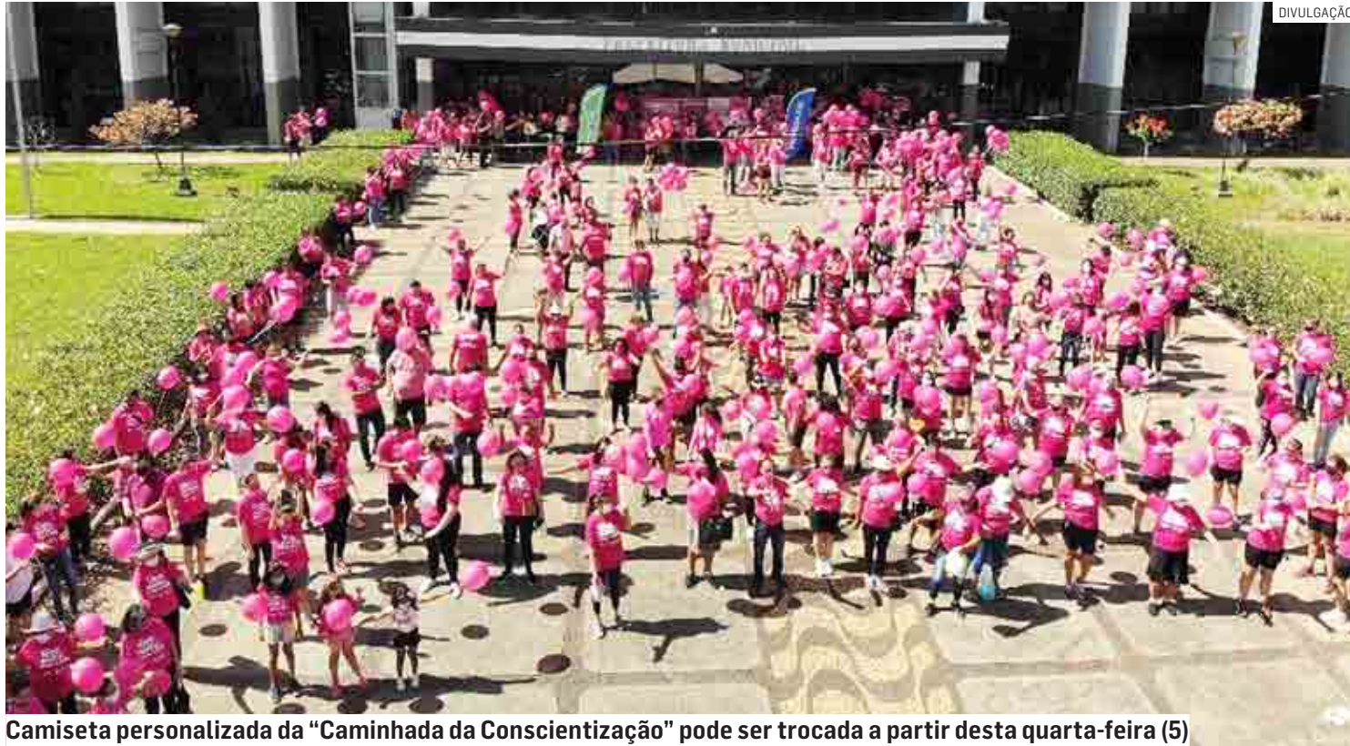
Camiseta personalizada da "Caminhada da Conscientização" pode ser trocada a partir desta quarta-feira (5)

A troca de um pacote de fraldas ou três litros de leite por uma camiseta personalizada da "Ca-