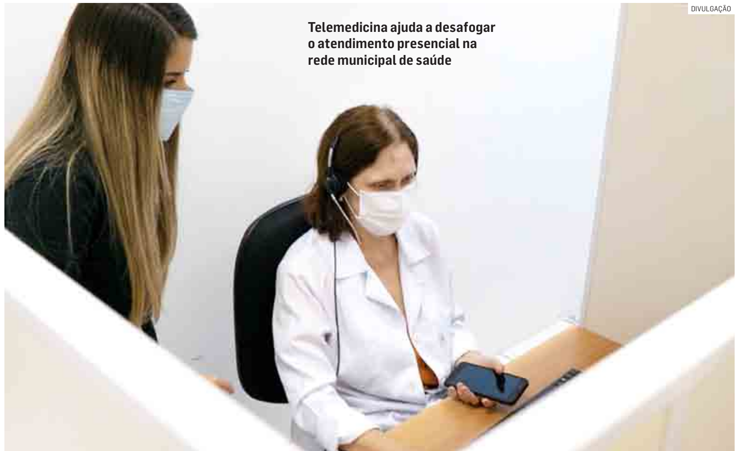
Telemedicina ajuda a desafogar o atendimento presencial na rede municipal de saúde

“Com a telemedicina, a proposta é mudar o foco de atendimento de saúde por meio de orientação aos pacientes para ajudá-los a prevenir doenças. O objetivo é implementar uma visão de saúde integral. Por isso é importante oferecer atendimento à população de diferentes especialidades médicas. Para isso, já estamos trabalhando para incluir na equipe da telemedicina um profissional de psicologia”, des-