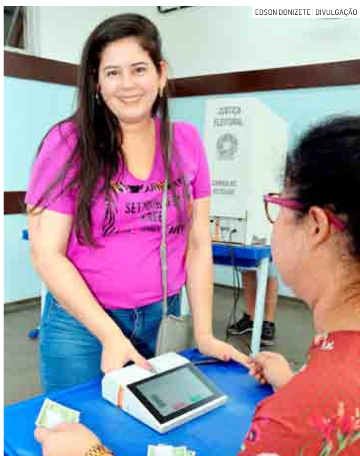
Expectativa do TSE é de que o eleitor leve menos tempo para votar no segundo turno, por serem apenas dois cargos

Em alguns casos, o leitor biométrico também não conseguiu verificar a identidade do eleitor. “Isso é um problema que, [conforme] alguns especialistas afirmam, a utilização de dois anos de álcool em gel, às vezes,