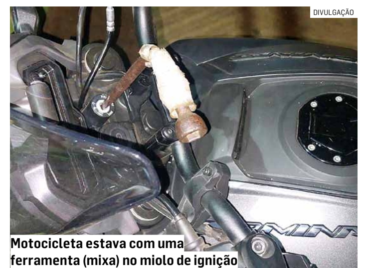
Motocicleta estava com uma ferramenta (mixa) no miolo de ignição

A dupla foi apreendida e conduzida ao Plantão Policial de Monte Mor, onde foi elaborado boletim de ocorrência de ato infracional de furto tentado, sendo os dois adolescentes liberados para os seus responsáveis.