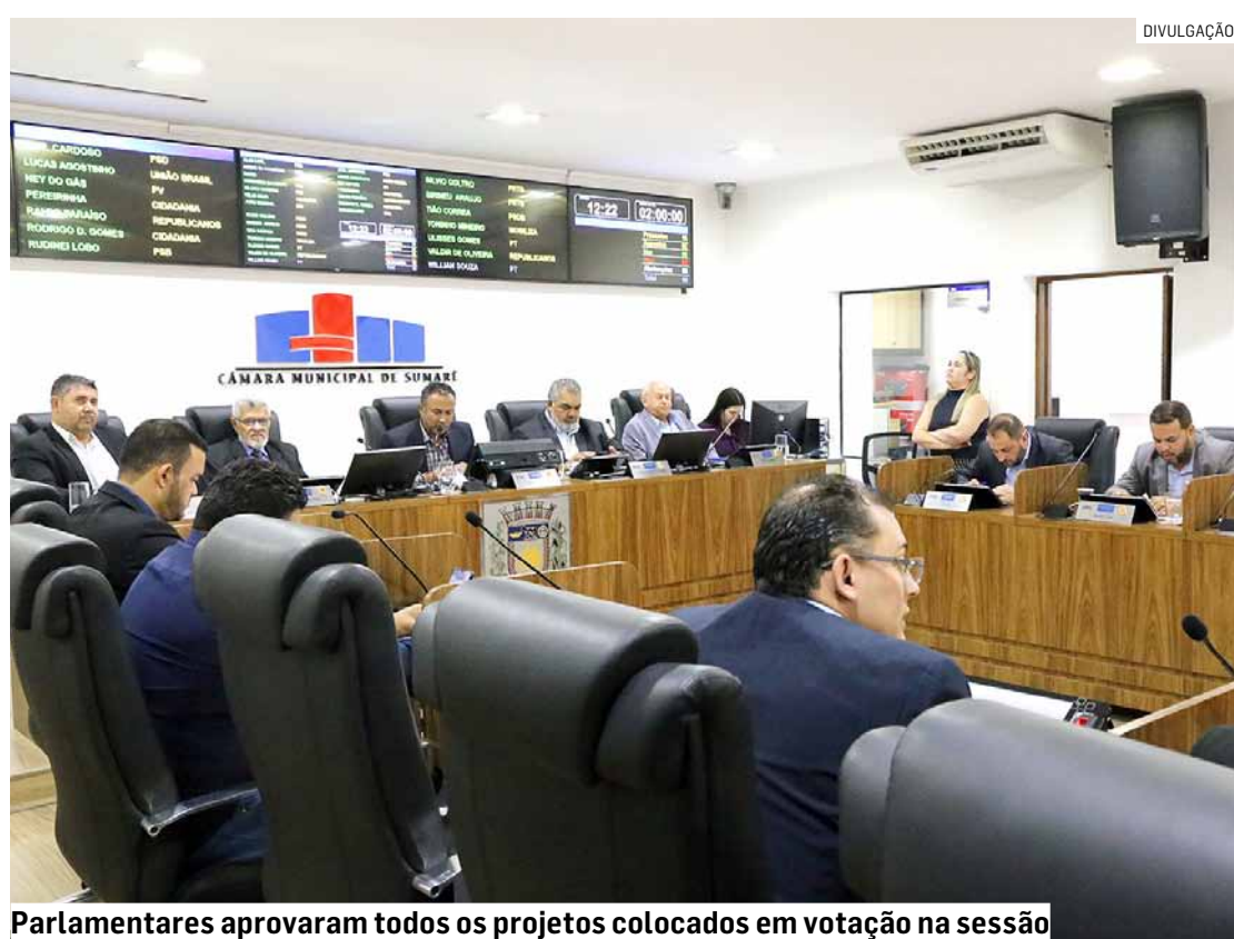
Parlamentares aprovaram todos os projetos colocados em votação na sessão