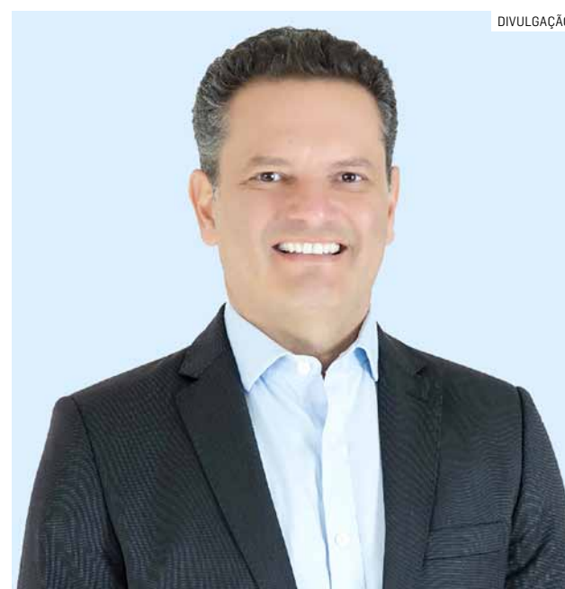
Ex-prefeito é o favorito para 36% dos entrevistados