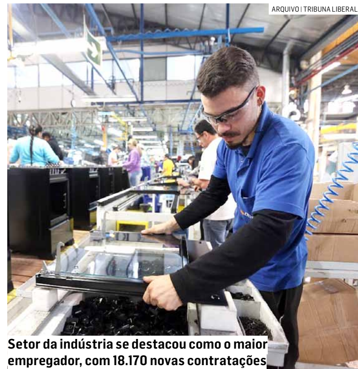
Setor da indústria se destacou como o maior empregador, com 18.170 novas contratações