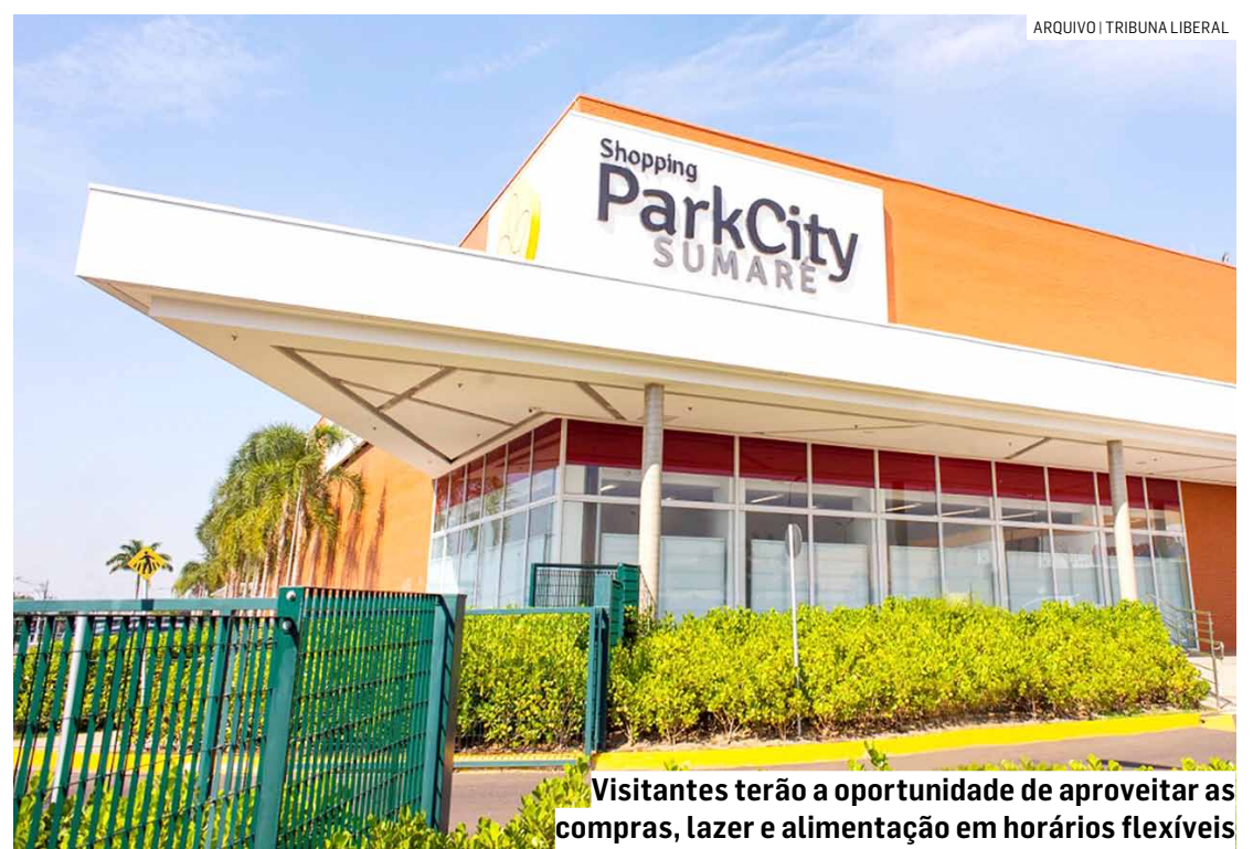
Visitantes terão a oportunidade de aproveitar as compras, lazer e alimentação em horários flexíveis