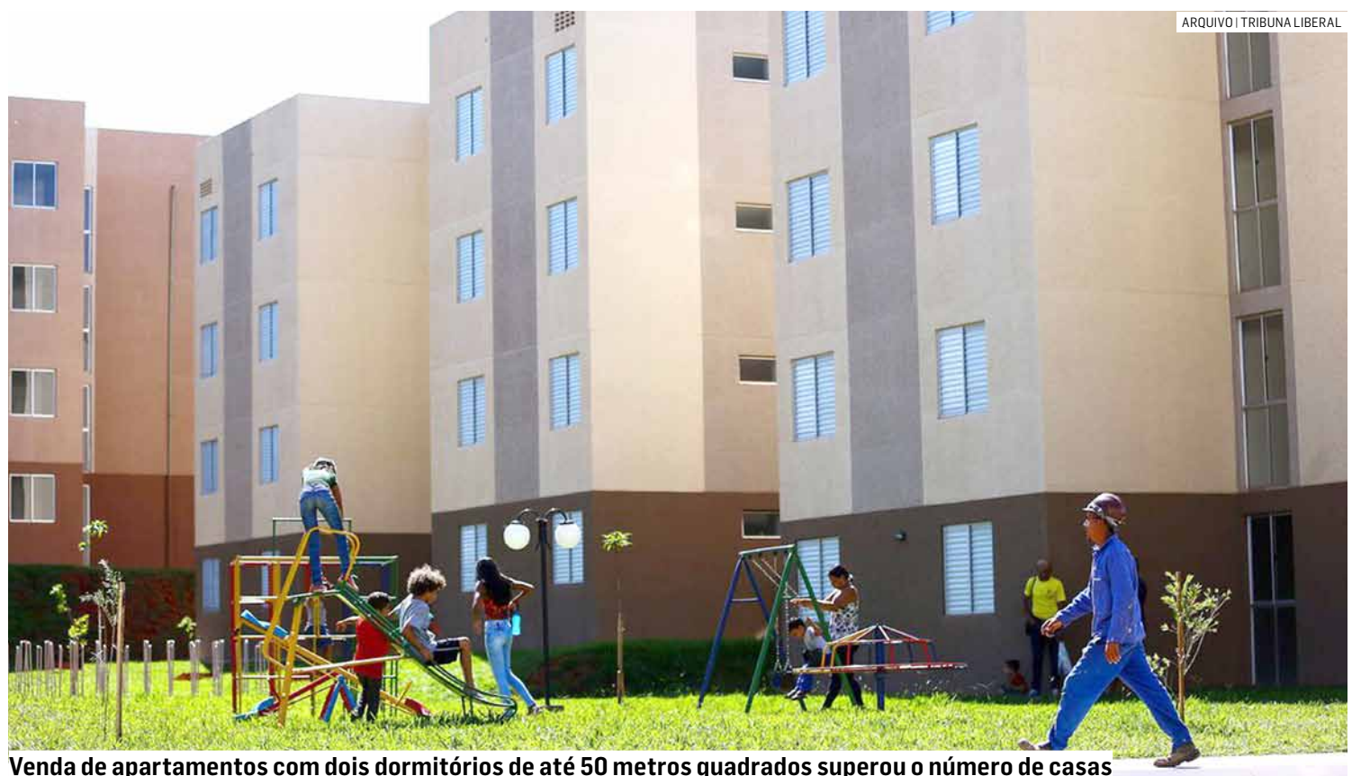
Venda de apartamentos com dois dormitórios de até 50 metros quadrados superou o número de casas

No mercado de locação, houve uma leve predominância de apartamentos, que representaram 51% das novas locações, enquanto as casas corresponderam a 49%. A faixa de preço das locações preferidas pelos inquilinos ficou acima de R$3 mil. As casas alugadas eram majoritariamente de até dois