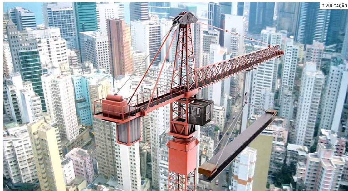
Aumento da atividade e do emprego contribuiu para o crescimento expressivo do setor

Da Redação • REGIÃO tribunaliberal@tribunaliberal.com.br