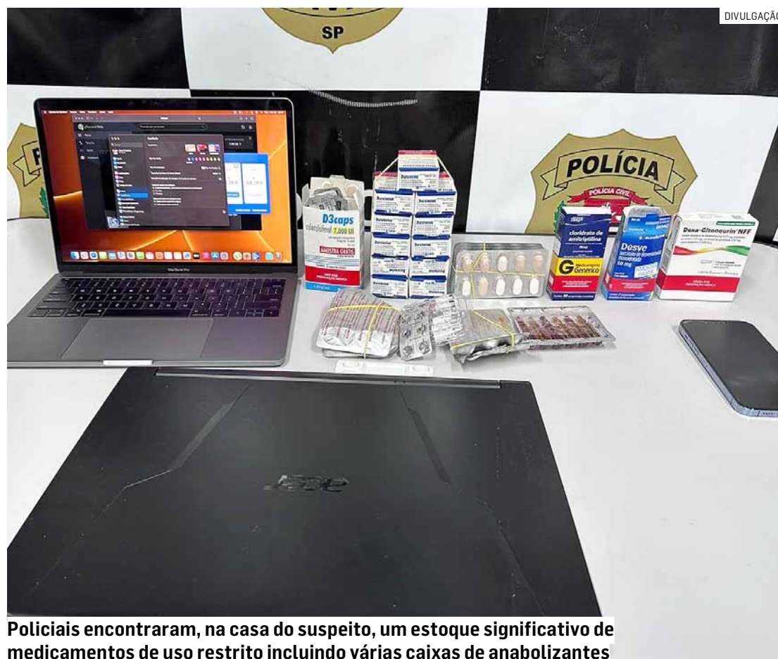
Policiais encontraram, na casa do suspeito, um estoque significativo de medicamentos de uso restrito incluindo várias caixas de anabolizantes

Na residência do suspeito, as autoridades encon-