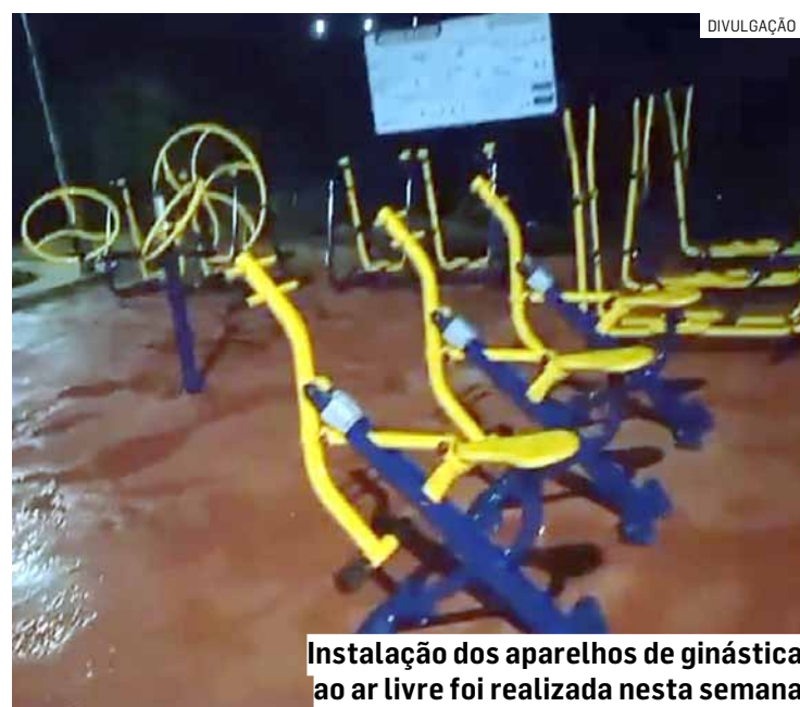
Instalação dos aparelhos de ginástica ao ar livre foi realizada nesta semana