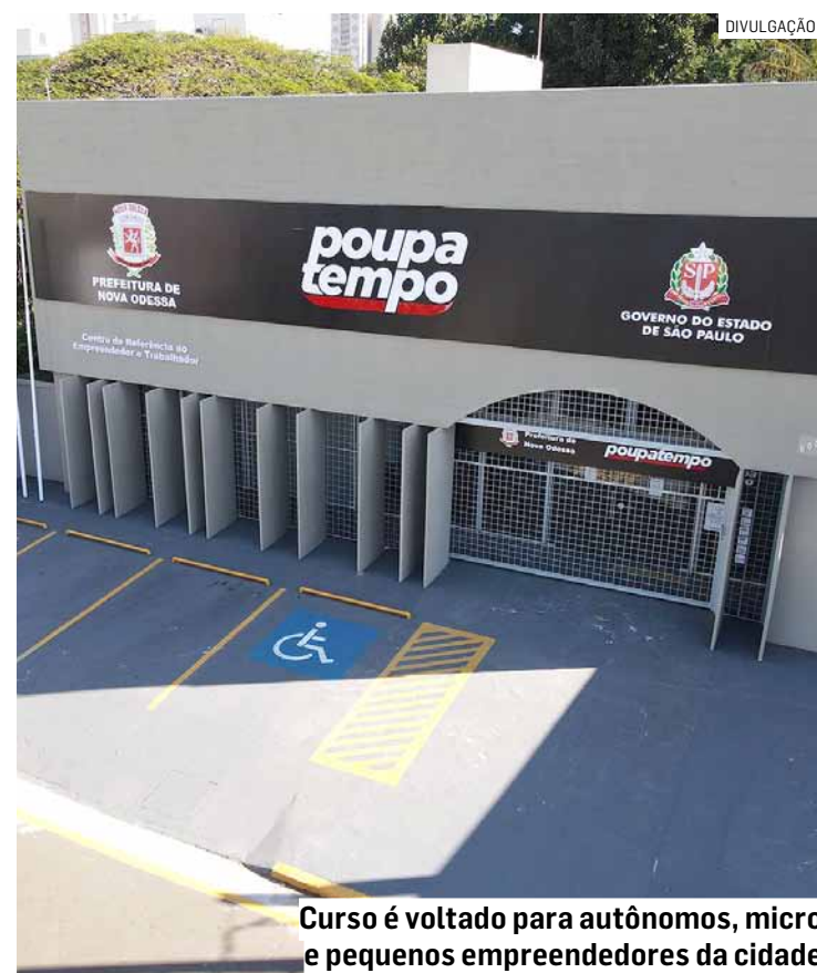
Curso é voltado para autônomos, micro e pequenos empreendedores da cidade

“Não deixe o dinheiro escapar! Domine a arte da precificação e garanta lucros consistentes. Descubra os segredos do preço de venda: compreenda custos, despesas fixas e variáveis, margem de contribuição e lucro. Saiba como questionar na hora de precificar, desconstruir e avaliar preços, além de construir preços com margens desejadas. Prepare-se para uma precificação inteligente e lucrativa”, traz o convite do