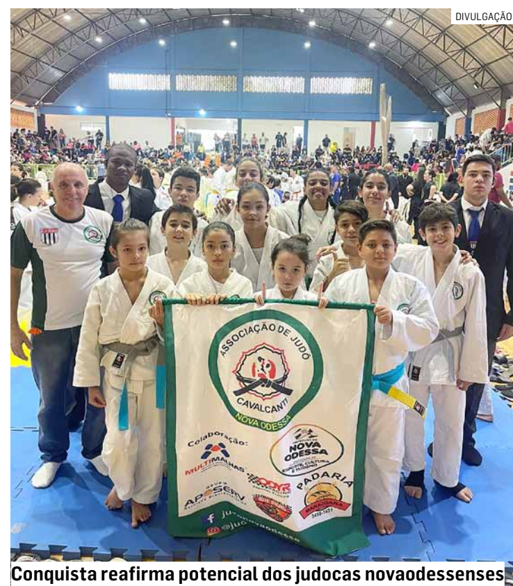
Conquista reafirma potencial dos judocas novaodessenses

Retomadas em 2022, as Escolinhas Municipais de Esportes mantidas pela Prefeitura já atendem a mais de 2,2 mil crianças e adolescentes, além de muitos adultos. A Secretaria de Esportes e Lazer segue ampliando as opções de modalidades, horários e locais.