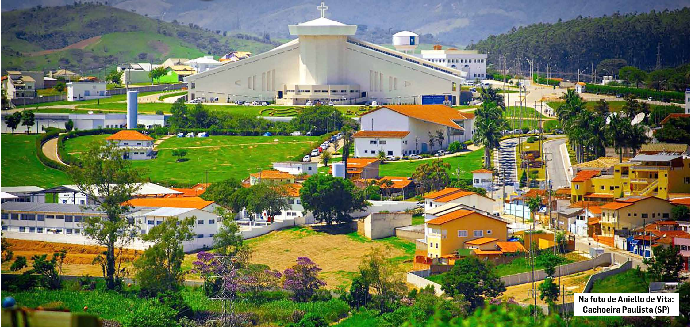
Na foto de Aniello de Vita: Cachoeira Paulista (SP)

Eis aqui uma Rota Turística, parte conhecida, parte a ser explorada. São 11 cidades: Aparecida, Cachoeira Paulista, Potim, Roseira, Tremembé, Canas, Lagoinha, Cunha, Lorena, Guaratinguetá e Piquete. A mais famosa, Aparecida, além do Santuário Nacional visita-se a Feira Livre, a cidade do Romeiro e muitas de suas festas. Em Cachoeira Paulista conheça a Canção Nova, o Santuário de Santa Cabeça e as ruínas da velha estação ferroviária. Em Tremembé visite a Basílica do Senhor Bom Jesus, além da sua estação ferroviária. Estando aos pés da serra da Mantiqueira, você também aproveita a exuberante natureza do Rio Paraíba.