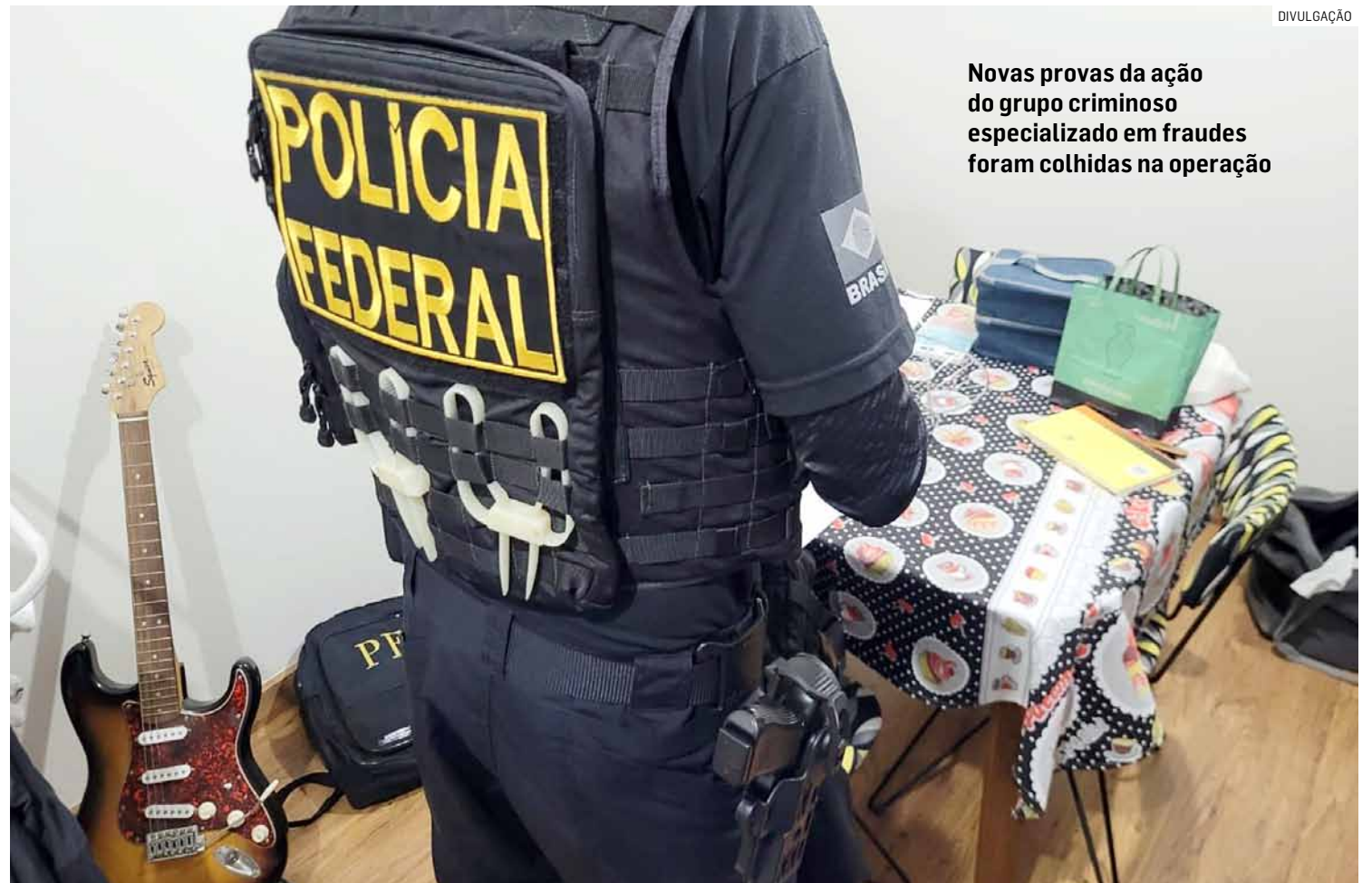
Novas provas da ação do grupo criminoso especializado em fraudes foram colhidas na operação

Na primeira fase da operação, em São Paulo, foram identificados 28 institutos de previdência municipais com investimentos em fun-