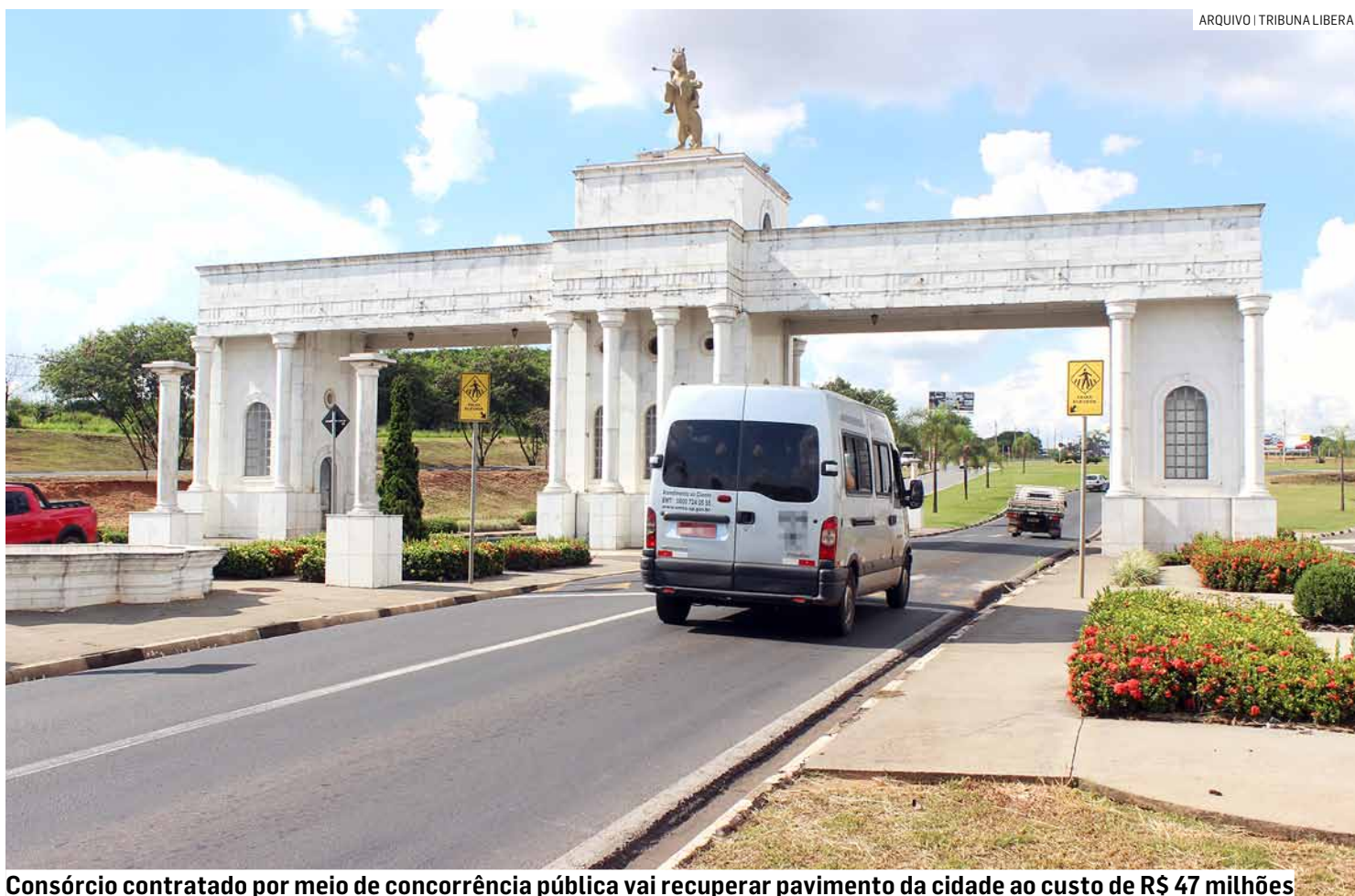
Consórcio contratado por meio de concorrência pública vai recuperar pavimento da cidade ao custo de R$ 47 milhões

O projeto de pavimentação, que tem como objetivo melhorar a infraestrutura viária de Paulínia, foi homologado e adjudicado em 28 de agosto de 2024. A Secretaria Municipal de Obras e Serviços Públicos coordenará o andamento das obras, que foram au-