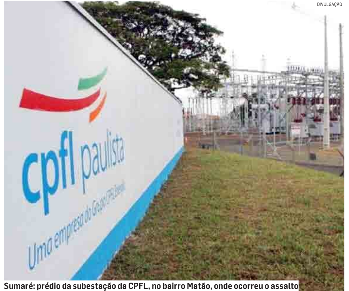
Sumaré: prédio da subestação da CPFL, no bairro Matão, onde ocorreu o assalto

A ocorrência foi registrada no Plantão Policial de Sumaré, onde o caso será investigado.