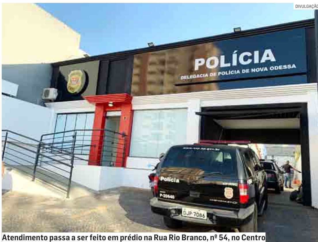
Atendimento passa a ser feito em prédio na Rua Rio Branco, nº 54, no Centro

“Alugar um prédio para servir como Delegacia durante o prazo da obra era o mínimo que o Município podia contribuir. É uma obra grande, um grande investimento do