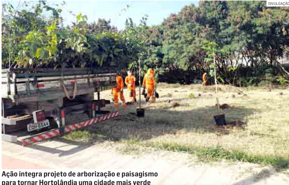
Ação integra projeto de arborização e paisagismo para tornar Hortolândia uma cidade mais verde

O complexo está localizado na parte posterior do Parque Socioambiental Lago da Fé, espaço de lazer e convivência que a cada dia é mais visitado pela população. Na semana anterior, agentes