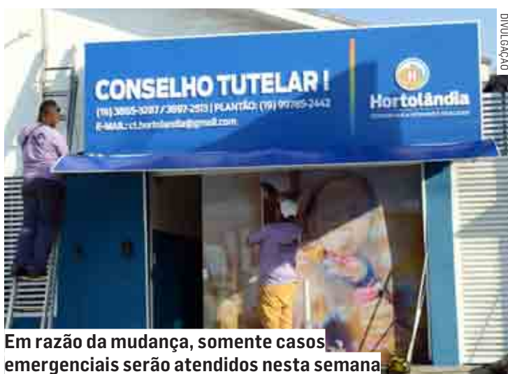
Em razão da mudança, somente casos emergenciais serão atendidos nesta semana

Hortolândia conta com dois Conselhos Tutelares. Eles são órgãos públicos municipais de defesa dos direitos da criança e do adolescente, previstos no ECA (Estatuto da Criança e do Adolescente) e na Constituição Federal Brasileira.