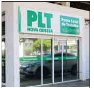
PLT de Nova Odessa tem 25 vagas PG. 06

◆ SUMARÉ (CENTRO) | NOVA VENEZA | PICERNO | MARIA ANTONIA | ÁREA CURA | MATÃO ◆ HORTOLÂNDIA ◆ NOVA ODESSA ◆ MONTE MOR ◆ ELIAS FAUSTO ◆ PAULÍNIA ◆