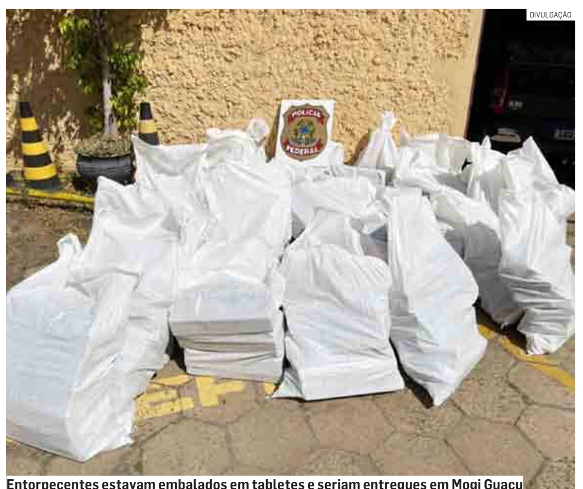
Entorpecentes estavam embalados em tabletes e seriam entregues em Mogi Guaçu

de a autoridade policial ratificou a voz de prisão em flagrante do condutor pelo delito de tráfico de drogas. Em pesagem preliminar, os tabletes somaram, aproximadamente, 980 kg de maconha. O preso permanecerá custodiado e, se condenado, poderá responder por penas que variam de 05 a 15 anos de prisão. A droga apreendida seguirá para São Paulo, onde aguardará autorização judicial para sua incineração.