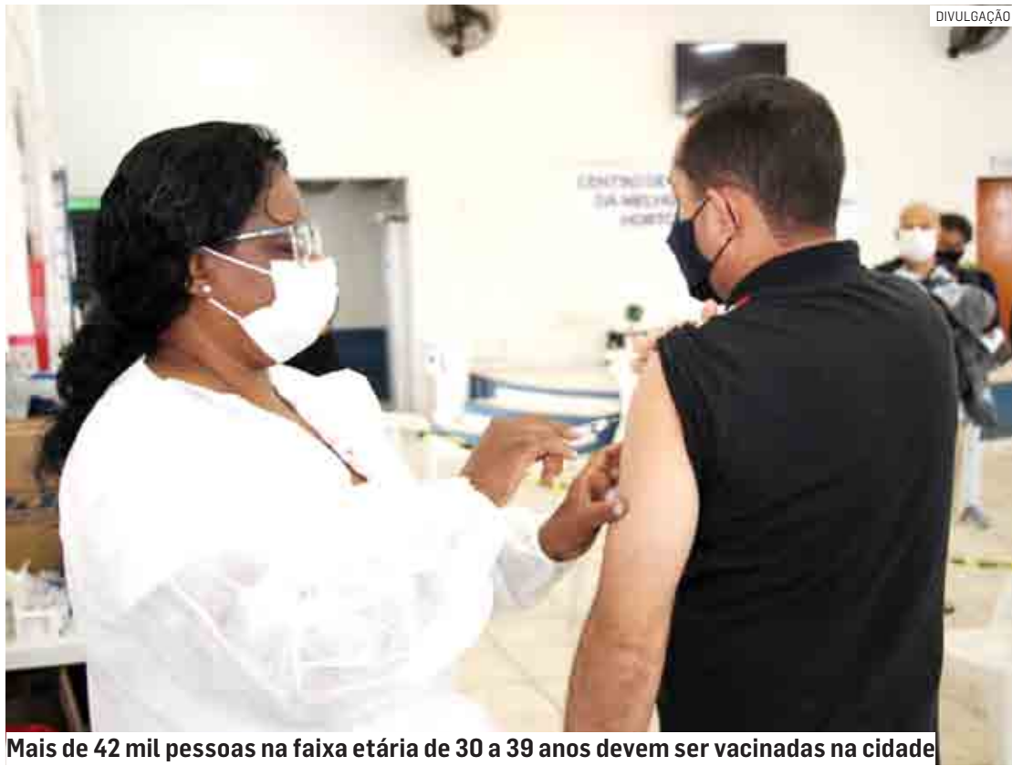
Mais de 42 mil pessoas na faixa etária de 30 a 39 anos devem ser vacinadas na cidade

Para receber a 4ª dose, é necessário apresentar comprovante de vacinação da dose anterior e ter cumprido o intervalo de quatro meses em relação à 3ª dose. A Secretaria de Saúde ainda in-