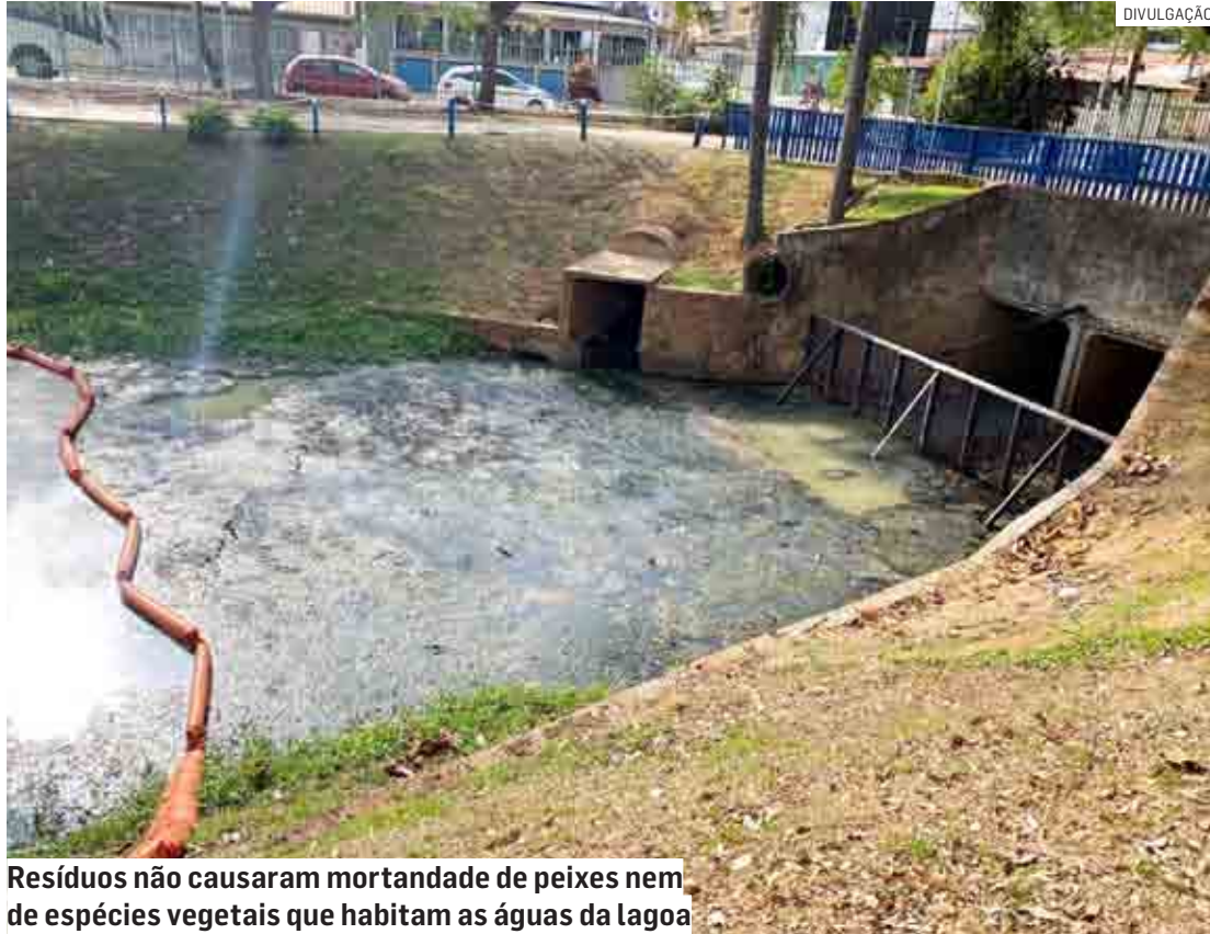
Resíduos não causaram mortandade de peixes nem de espécies vegetais que habitam as águas da lagoa

Os agentes coletaram uma amostra da água com os resíduos. A amo-