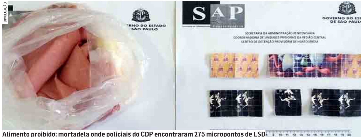
Alimento proibido: mortadela onde policiais do CDP encontraram 275 micropontos de LSD

Da Redação | HORTOLÂNDIA tribunaliberal@tribunaliberal.com.br