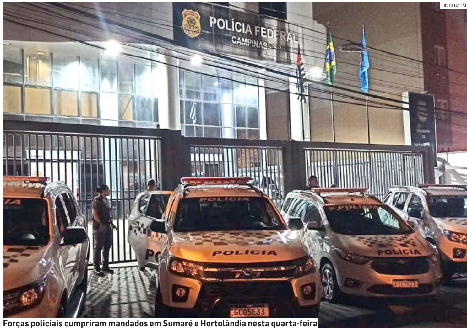
Forças policiais cumpriram mandados em Sumaré e Hortolândia nesta quarta-feira

Polícia Federal, Gaeco e PM cumpriram mandados contra quadrilha em Campinas, Hortolândia e Sumaré; cidades foram alvo de roubos