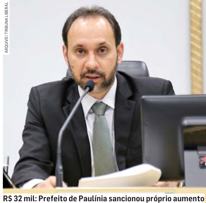
R$ 32 mil: Prefeito de Paulínia sancionou próprio aumento

Com aumento seis vezes maior que a inflação, o novo salário do prefeito de Paulínia, Du Cazellato (PL), de R$ 32 mil mensais, custará R$ 640 mil aos cofres públicos até o final do mandato do chefe do Executivo, em dezembro de 2024. O aumento do salário também é o triplo do índice concedido aos servidores públicos municipais, que é de 12%. População crítica o aumento. O novo salário de Du Cazellato entrou em vigor no dia 1º de maio. PÁGINA 05