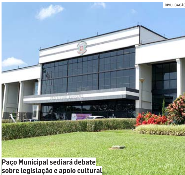
Paço Municipal sediará debate sobre legislação e apoio cultural

A “Lei Paulo Gustavo”, que homenageia o humorista que morreu vítima da Covid-19 em maio de 2021, prevê repasses de recursos do FNC (Fundo Nacional de Cultura) a estados, municípios e