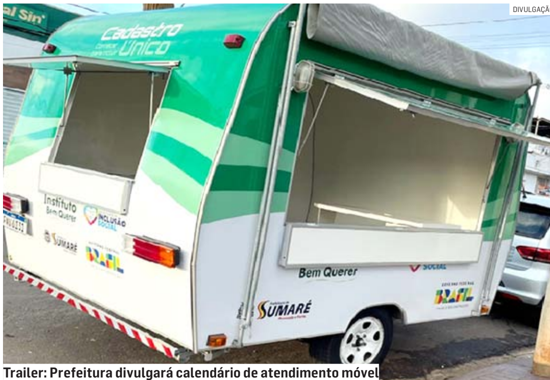
Trailer: Prefeitura divulgará calendário de atendimento móvel

No mês passado, a nova sede da Central de Cadastro Único foi inaugurada. O local concentra os atendimentos referentes ao CadÚnico - base de dados do Governo Federal em que estão registradas as informações socioeconômicas das famílias de baixa