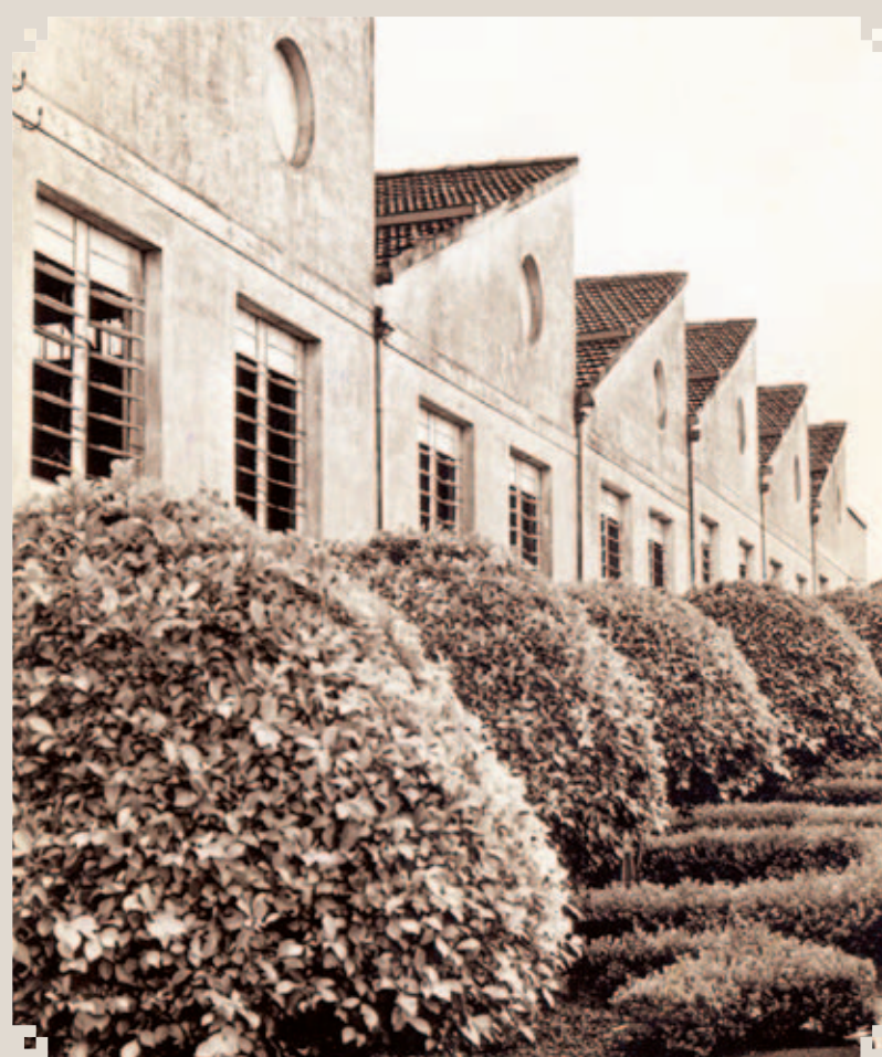
Foto dos anos 1960 da antiga Gifran (Giometti, França & Cia.Ltda.), tradicional fábrica de tecidos de Sumaré. A visão é da Rua Justin o França. Aquele local abriga hoje uma grande empresa de material de construção.