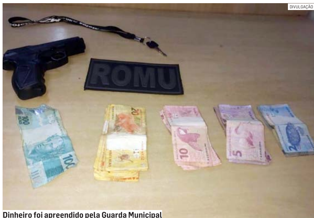
Dinheiro foi apreendido pela Guarda Municipal

César Oliveira • SUMARÉ tribunaliberal@tribunaliberal.com.br