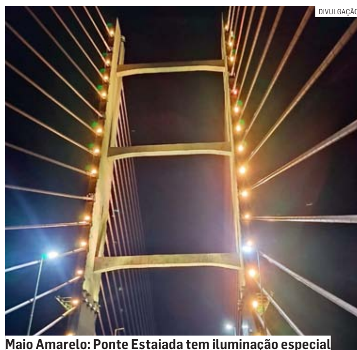
Maio Amarelo: Ponte Estaiada tem iluminação especial

Da Redação • HORTOLÂNDIA tribunaliberal@tribunaliberal.com.br