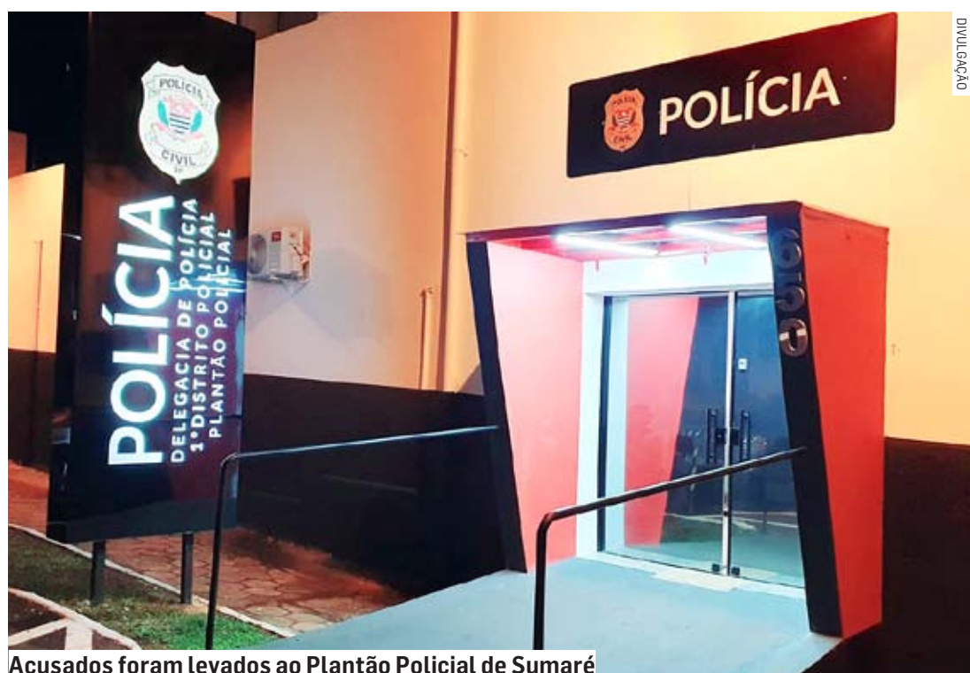
Acusados foram levados ao Plantão Policial de Sumaré

A ocorrência foi registrada e mãe e filho ficaram presos, permanecendo à disposição da justiça.