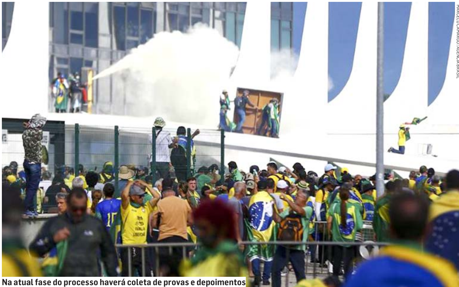
Na atual fase do processo haverá coleta de provas e depoimentos

Com a aceitação da denúncia, os acusados se tornam réus e passam a responder a uma ação penal pelos crimes descritos pela PGR. Na nova fase do processo, haverá coleta de provas e depoimentos de testemunhas de defesa e acusação. Só depois o STF irá julgar se condena ou absolve os réus. As denúncias foram analisadas em sessão virtual extraordinária encerrada às 23h59 desta terça-feira (2).