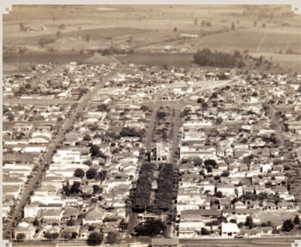
FOTO AÉREA DE SUMARÉ

Registro fotográfico dos anos 1960, da área central de Sumaré. Destaque para as principais vias: Avenida 7 de Setembro, Praça da República com o antigo jardim e a Rua Ipiranga.