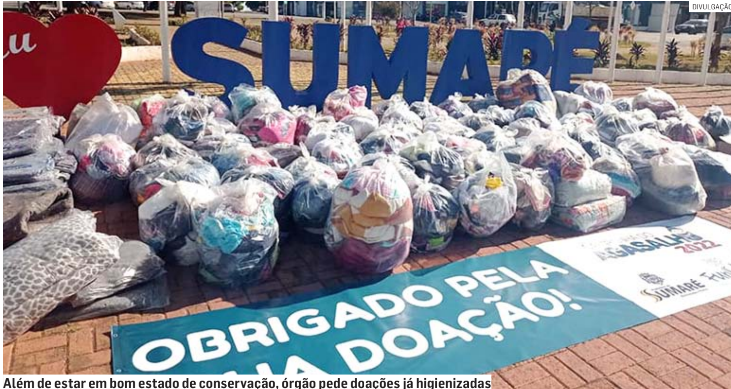
Além de estar em bom estado de conservação, órgão pede doações já higienizadas

“O Fundo Social pede para que, se possível, a população leve suas doações já higienizadas. A campanha segue ao longo do mês, em pontos espalhados por toda a cidade”, informou o órgão.