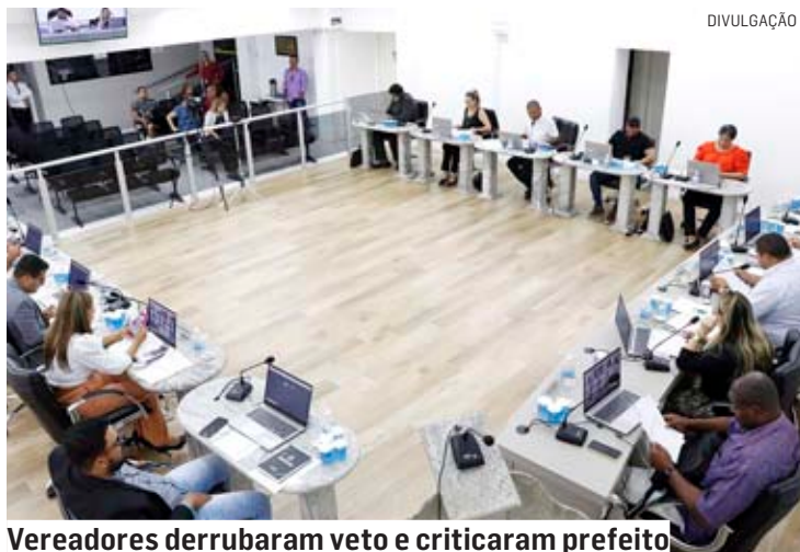
Vereadores derrubaram veto e criticaram prefeito