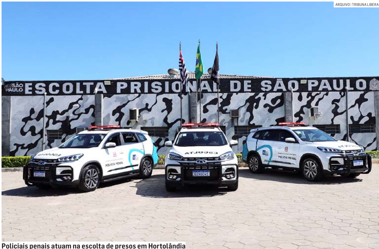
Policiais penais atuam na escolta de presos em Hortolândia

Dados de 2022 indicam que a PM realizou em todo ano passado 41.316 escoltas. Na média, foram utilizados diariamente 253 policiais militares e 112 viaturas. Mesmo considerando que os policiais penais trabalharão em esquema de plantão, a estimativa é que diariamente estejam disponíveis 674 agentes para