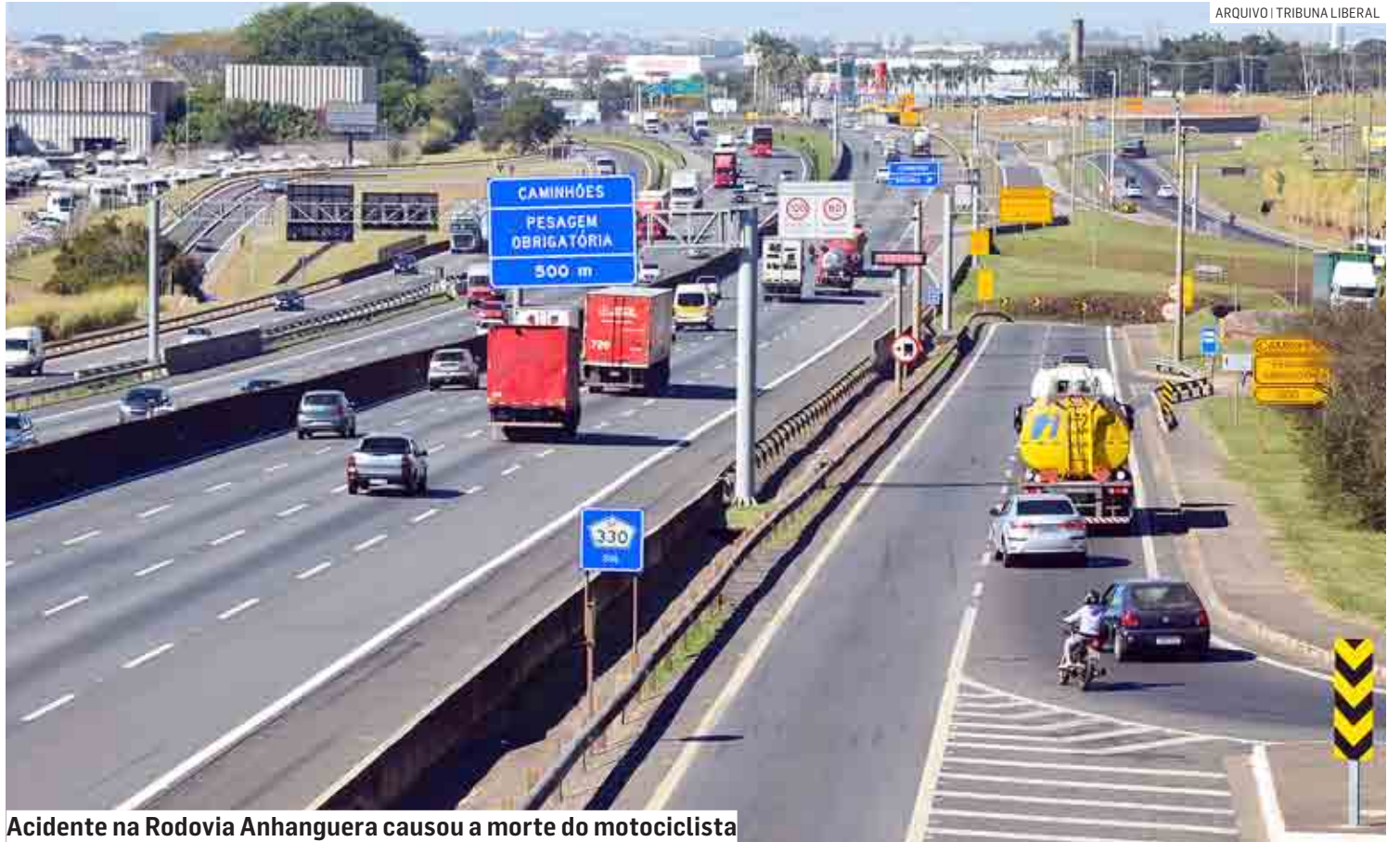
Acidente na Rodovia Anhanguera causou a morte do motociclista

O acidente com vítima fatal foi registrado no Plantão Policial de Sumaré.