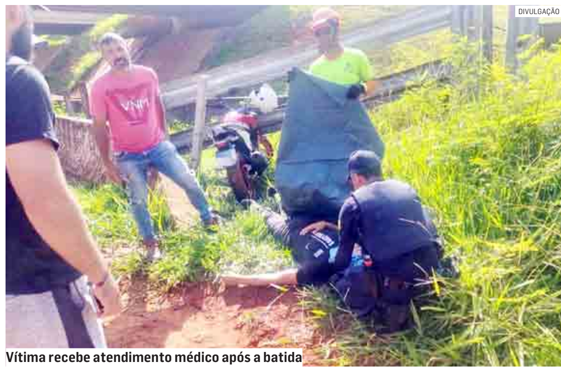
Vítima recebe atendimento médico após a batida