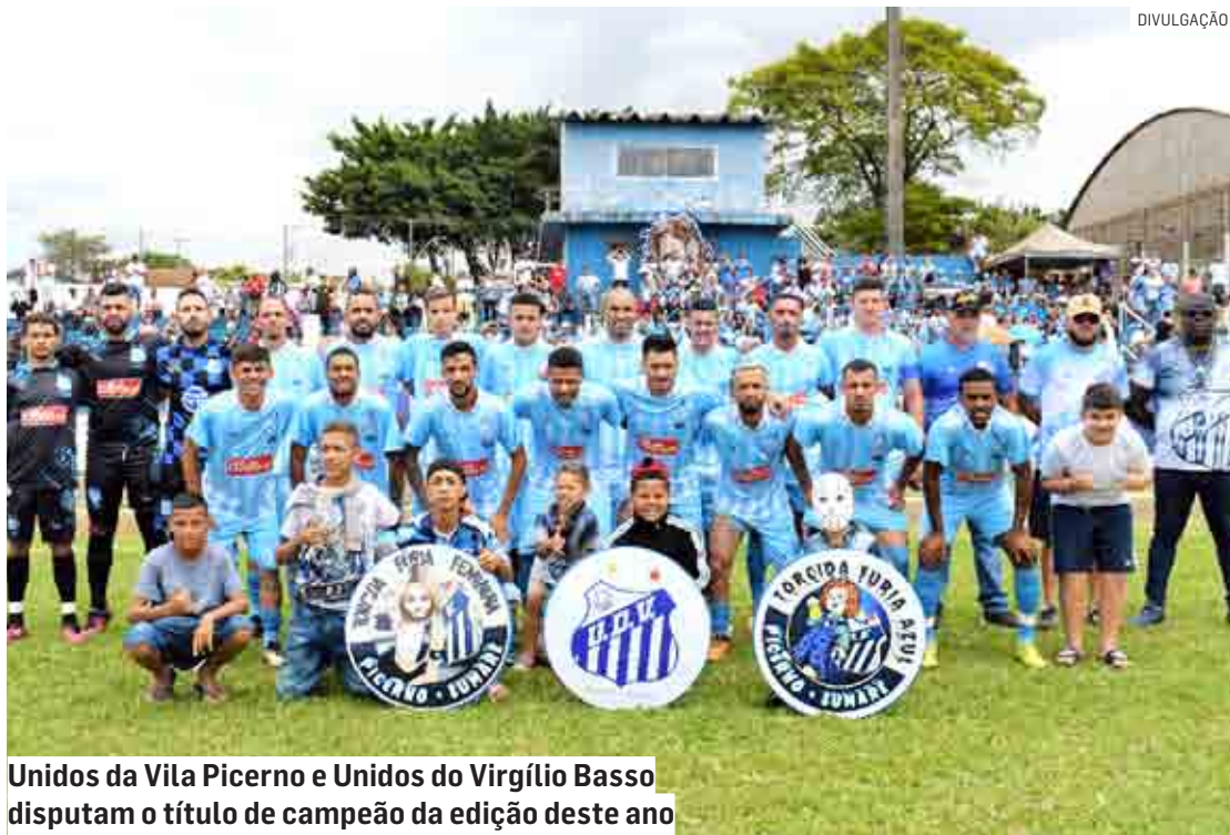
Unidos da Vila Picerno e Unidos do Virgílio Basso disputam o título de campeão da edição deste ano

Fundado em 2 de junho de 2002, em seus 20 anos de história o UDV conta com um título no Campeonato Amador, conquistado em 2016. A equipe também possui uma taça pelo primeiro lugar da Copa Metropolitana de 2019, torneio que reuniu times amadores da região.