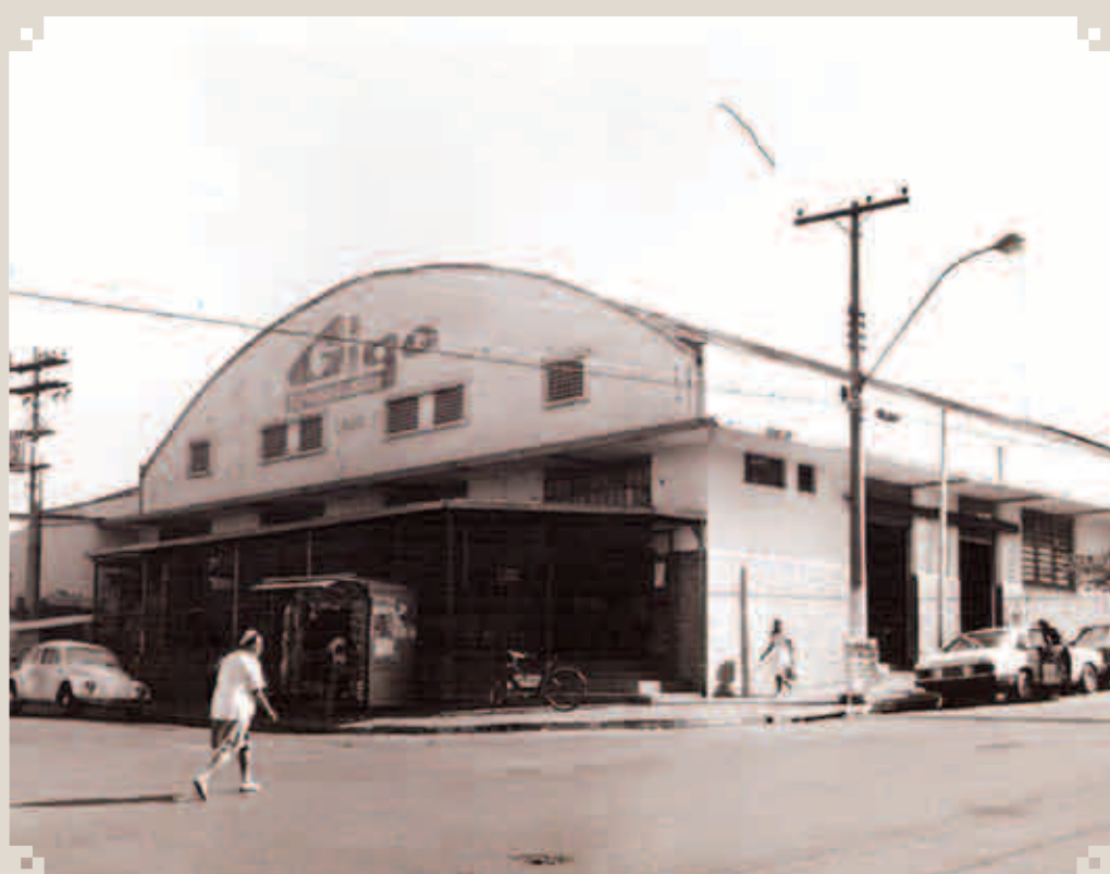
Foto da década de 1960, da fachada do Supermercado Gigo, a primeira unidade do gênero na região, na esquina da rua José Maria Miranda com a 7 de Setembro. Era a chamada Loja 1. A rede chegou a ter mais de 20 unidades, em São Paulo e sul de Minas.