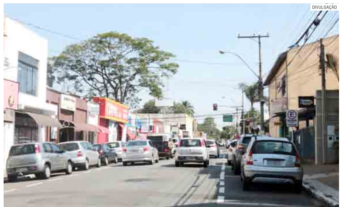
Consumidores que comprarem nos comércios participantes devem pedir cupons aos lojistas

Para auxiliar o comércio local a atrair consumidores neste final de ano, a Prefeitura de Nova Odessa vai promover a Campanha "Um Natal Iluminado" de 2022, com decoração e iluminação típicas expandida para além da Praça Central José Gazzetta, na Avenida Carlos Botelho, incluindo outras praças das diversas re-