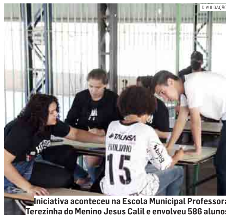
Iniciativa aconteceu na Escola Municipal Professora Terezinha do Menino Jesus Calil e envolveu 586 alunos

Para a Secretária de Educação, Sandra Bruzon, o envolvimento dos alunos da rede municipal com algo global, com temas conhecidos por eles, mas pouco discutidos e desenvolvidos de forma prática e local, irá contribuir de forma significativa para o desenvolvimento deles como alunos, como pessoas e como cidadãos de Monte Mor, mas especialmente com uma mentalidade de cidadania global, cidadão do mundo.