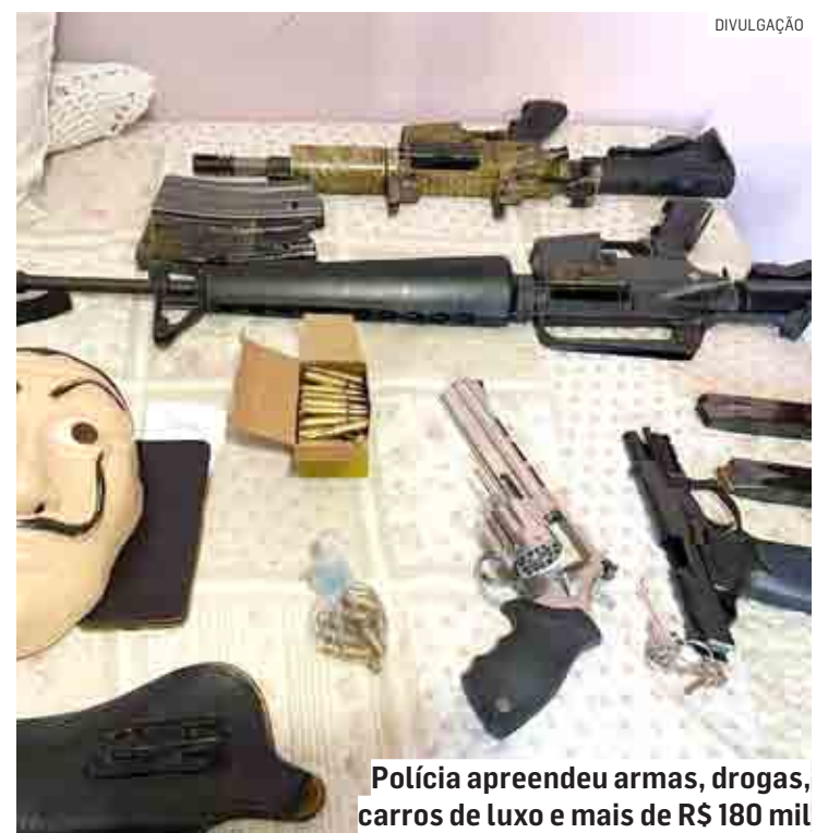
Polícia apreendeu armas, drogas, carros de luxo e mais de R$ 180 mil