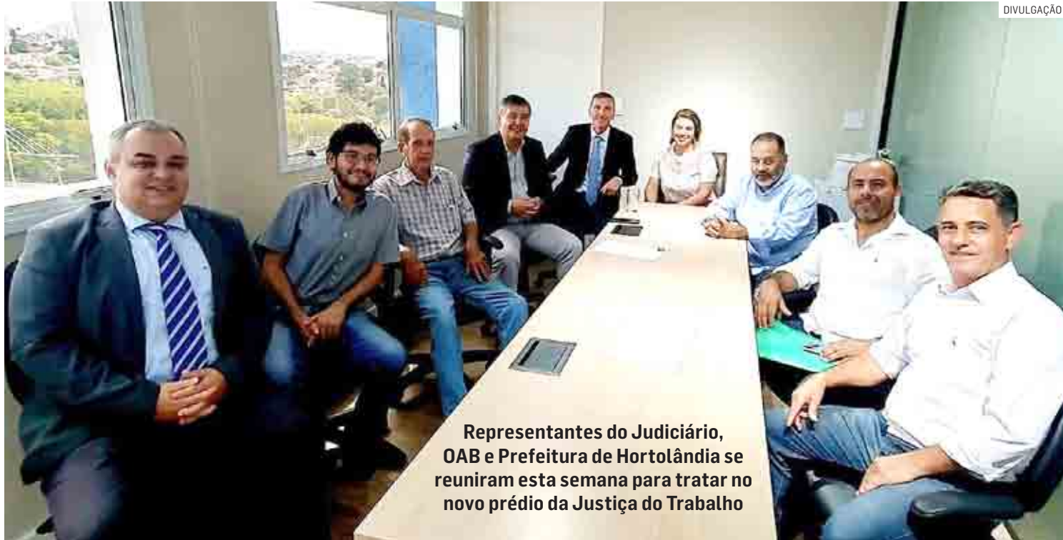
Representantes do Judiciário, OAB e Prefeitura de Hortolândia se reuniram esta semana para tratar do novo prédio da Justiça do Trabalho