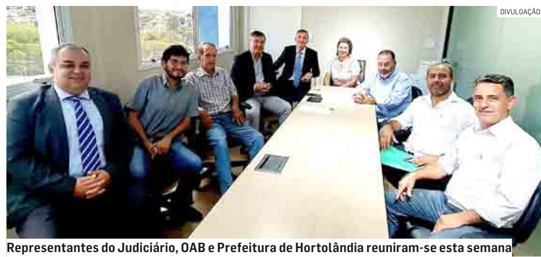
Representantes do Judiciário, OAB e Prefeitura de Hortolândia reuniram-se esta semana