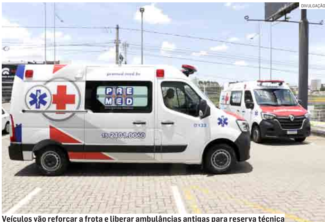
Veículos vão reforçar a frota e liberar ambulâncias antigas para reserva técnica

“Com a troca da OS, a Secretaria de Saúde já fez o seu orçamento para uma renovação agora. Locamos três veículos que vão fazer a diferença na vida das pessoas, no atendimento. É muito importante para a nossa cidade, porque o Samu tem um atendimento