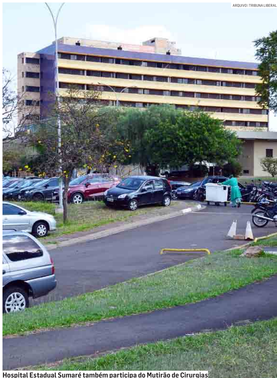
Hospital Estadual Sumaré também participa do Mutirão de Cirurgias

“Uma ação recorde do governo de São Paulo vai permitir agilizar os atendimentos da população que aguardavam desde a pandemia. Uma mobilização em todo o Estado com cirurgias e, também, com consultas pré-operatórias, um passo obrigatório para a realização dos procedimentos cirúrgicos”, destacou o secretário de Estado da Saúde, Jean Gorinchteyn.