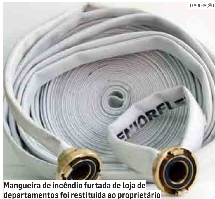
Mangueira de incêndio furtada de loja de departamentos foi restituída ao proprietário