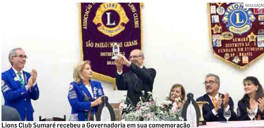
Lions Club Sumaré recebeu a Governadoria em sua comemoração