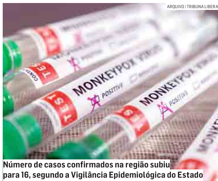
Número de casos confirmados na região subiu para 16, segundo a Vigilância Epidemiológica do Estado

O governo do Estado orienta para que sejam reforçados os cuidados para evitar o avanço do surto: evitar contato íntimo ou sexual com pessoas que tenham lesões na pele; evitar beijar, abraçar ou fazer sexo com alguém com a doença; higieniza-