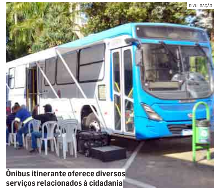
Ônibus itinerante oferece diversos serviços relacionados à cidadania