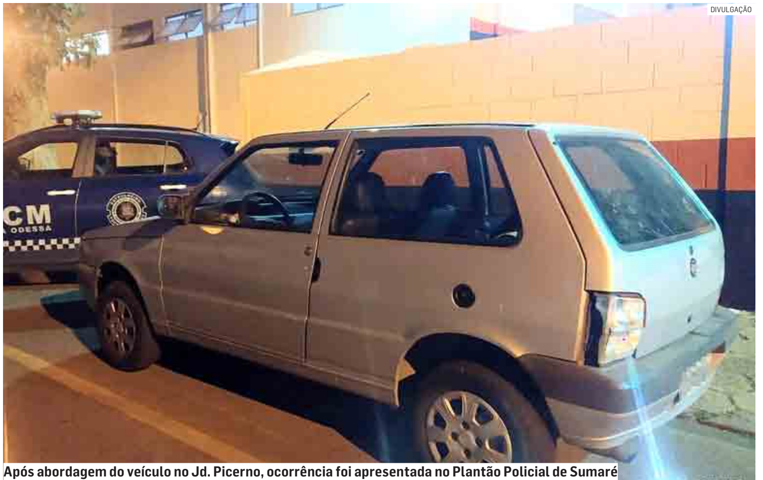
Após abordagem do veículo no Jd. Picerno, ocorrência foi apresentada no Plantão Policial de Sumaré

A ocorrência foi apresentada no Plantão Policial de Sumaré, onde a autoridade policial ratificou a voz de prisão em flagrante, e os dois homens permaneceram presos à disposição da Justiça. O veículo foi restituído ao proprietário.