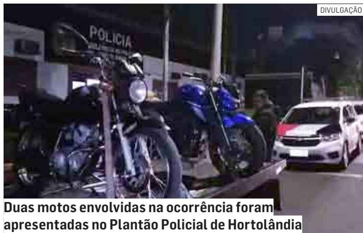
Dois motos envolvidas na ocorrência foram apresentadas no Plantão Policial de Hortolândia

Em seguida, localizaram o garupa conduzindo