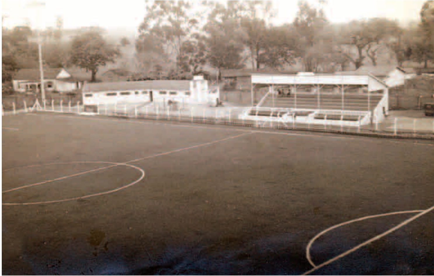
Estádio Luiz Frutuoso com a arquibancada