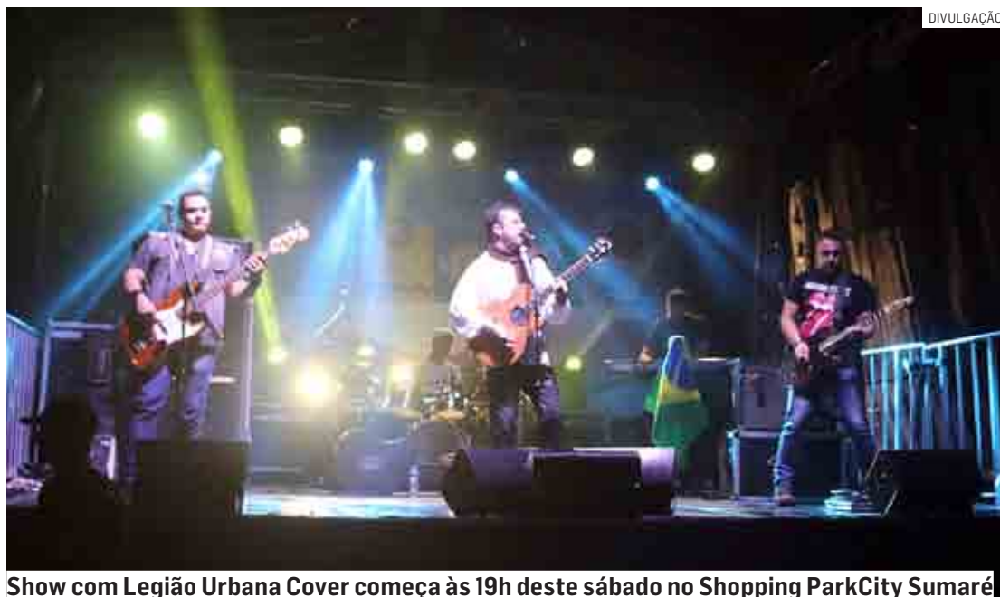
Show com Legião Urbana Cover começa às 19h deste sábado no Shopping ParkCity Sumaré

Com letras inspiradas em bandas estrangeiras e nos trabalhos de filósofos, alcançou grande re-