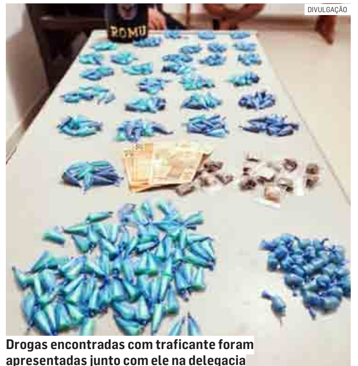
Drogas encontradas com traficante foram apresentadas junto com ele na delegacia

Os GCMs foram atrás do suspeito e conseguiram abordar o traficante. Com ele, foi localizada uma sacola que continha 70 pinos de cocaína e 26 pedras de crack. Em uma busca pela resi-