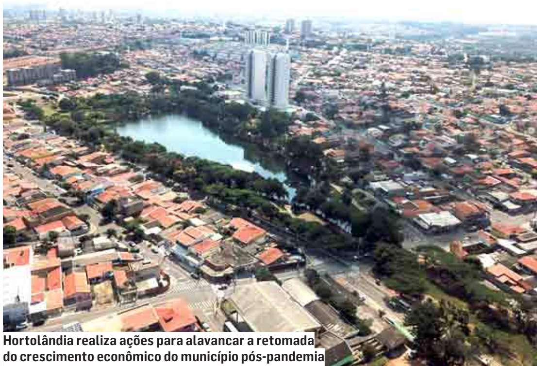
Hortolândia realiza ações para alavancar a retomada do crescimento econômico do município pós-pandemia

Para o secretário adjunto de Desenvolvimento Econômico, Trabalho,