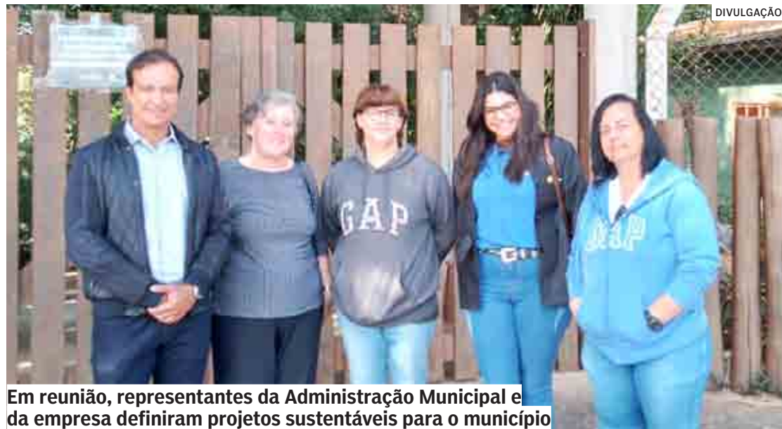
Em reunião, representantes da Administração Municipal e da empresa definiram projetos sustentáveis para o município

“Diversos assuntos foram discutidos, sempre com foco em projetos sustentáveis para o município. Essa parceria com a BrasilReverso teve início no final do ano e agora estamos fortalecendo ainda mais para ampliar essas ações de reciclagem de eletroeletrô-