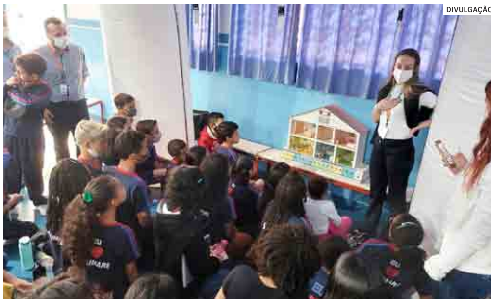
Alunos da Escola Municipal Ramona Canhete Pinto participaram da campanha

A CPFL Paulista, com apoio do COCEN - Conselho de Consumidores de Energia Elétrica, realizou uma campanha de conscientização e um concurso cultural para mais de 100 alunos do 5º ano da Escola Municipal Ramona Canhete Pinto, no Jardim Minesota, em Sumaré, na última terça-feira (28). PÁGINA 03