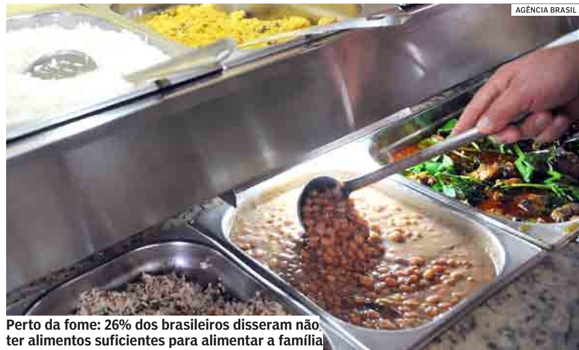
Perto da fome: 26% dos brasileiros disseram não ter alimentos suficientes para alimentar a família

Reportagem do Jornal Folha de S.Paulo cita que um estudo divulgado no início do mês mostra que 33,1 milhões de pessoas no Brasil estão em situação de fome. De acordo com o 2º Inquérito Nacional sobre Insegurança Alimentar no Contexto da Pandemia da Covid-19 no Brasil, o país tem 14 milhões de pessoas a mais em situação de insegurança alimentar do que há um ano. Os principais motivos para o avanço da fome são a falta de políti-