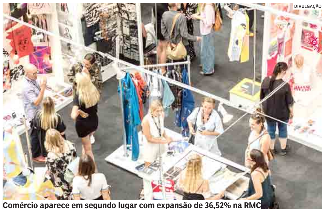
Comércio aparece em segundo lugar com expansão de 36,52% na RMC

As 20 cidades criaram 6.429 postos de trabalho em maio de 2022, enquanto em abril o saldo havia sido de 5.344 vagas criadas, menciona análise da Acic