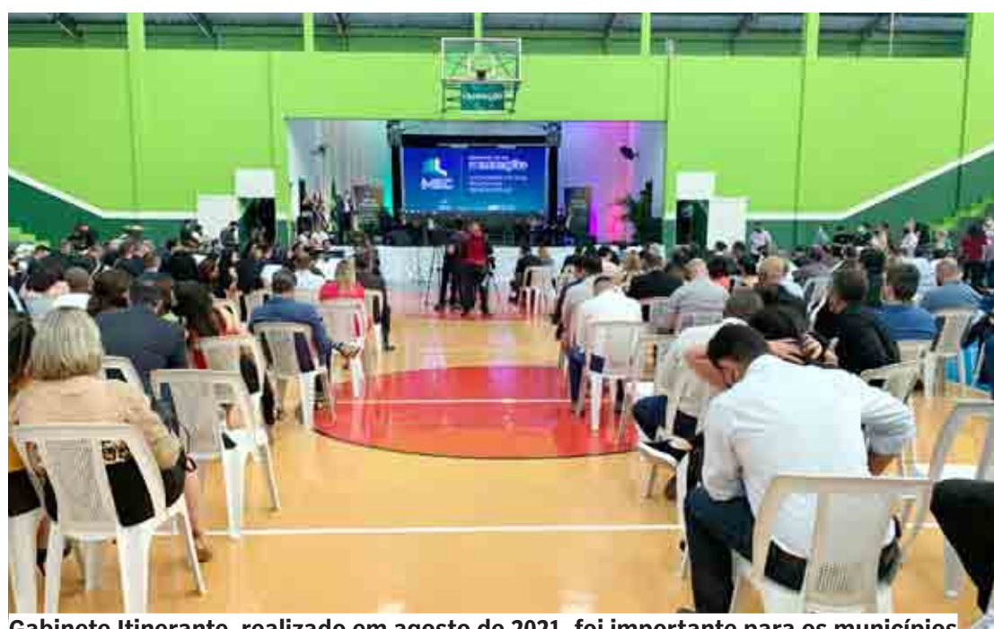
Gabinete Itinerante, realizado em agosto de 2021, foi importante para os municípios

Alvo de suspeita após reportagem do Fantástico, prefeito afirma que não há envolvimento de Nova Odessa no escândalo do MEC, questiona seus opositores e tranquiliza a população