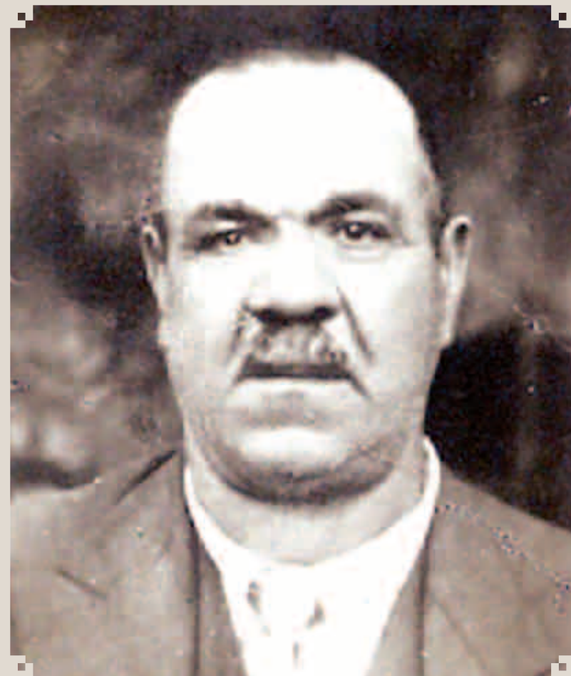
José Mancini era natural de Bari, Itália. Veio para Rebouças em 1903, onde constituiu numerosa família. Morreu no dia 4 de julho de 1946. Uma das principais avenidas da cidade leva seu nome.