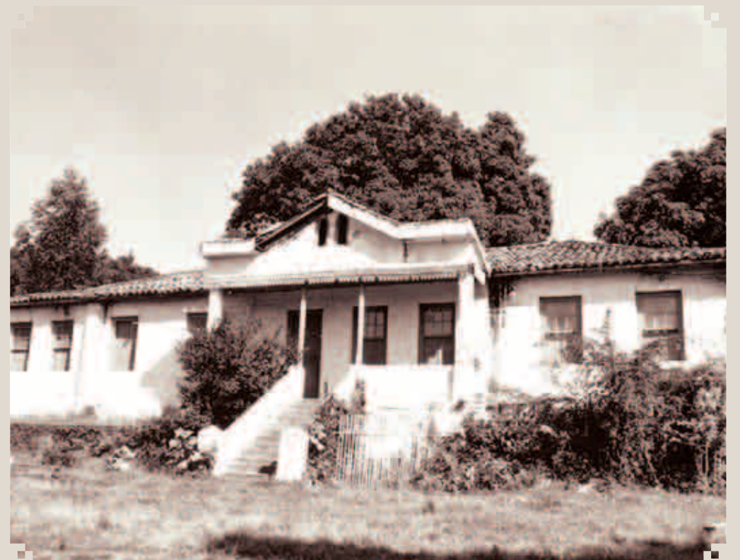
O Casarão da Fazenda Sertãozinho é o mais antigo de Sumaré. Foi construído em meados do século XIX. Foi preservado graças à iniciativa do empresário Paulo Levi, da ENGEPE, responsável pela construção do condomínio Parque da Floresta. Restaurado, poderia ser um dos pontos turísticos da cidade.