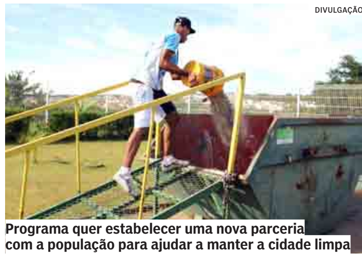
Programa quer estabelecer uma nova parceria com a população para ajudar a manter a cidade limpa

Manter a cidade limpa e fazer o descarte correto de resíduos são tarefas compartilhadas pelo poder público e pela população. Para reforçar a importância dos moradores fazerem sua parte, a Prefeitura de Hortolândia retoma o programa "Agenda Verde". PÁGINA 04