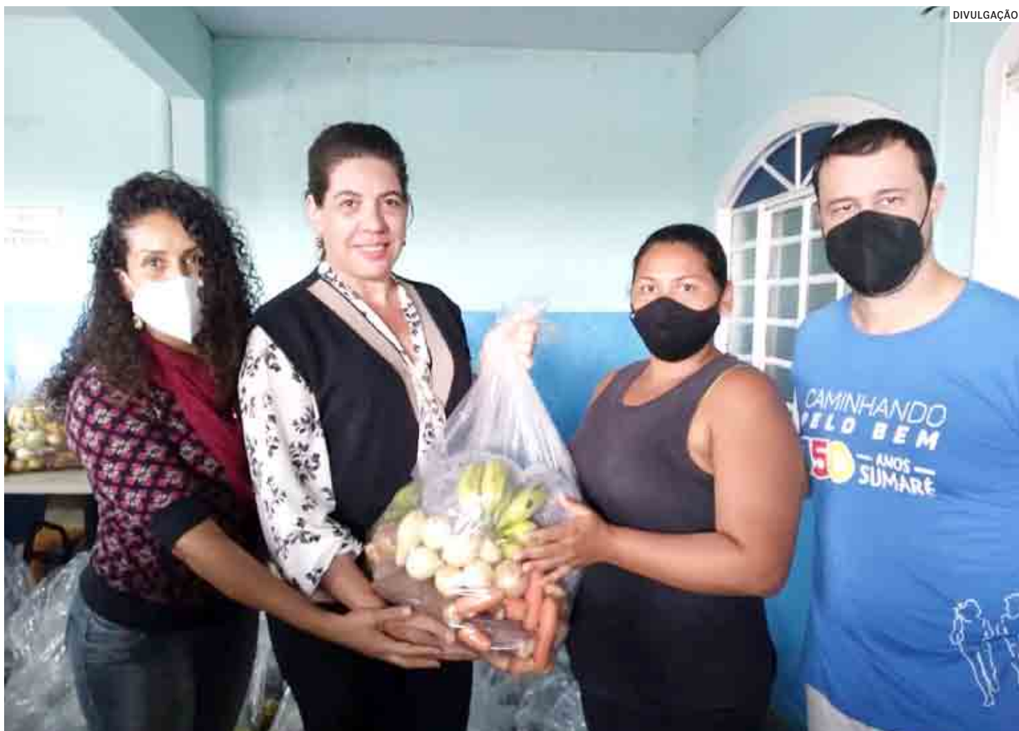
Sumaré: família recebe cesta de hortifrutis por meio do programa Cesta Verde, realizado pela Prefeitura

“Nesses últimos dois meses, houve um aumento significativo na procura por cestas básicas diretamente no Fundo Social... podemos apontar fatores como a alta de preços (dos alimentos) e desemprego para justifi-