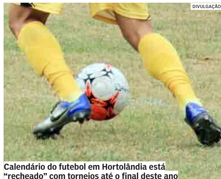
Calendário do futebol em Hortolândia está "recheado" com torneios até o final deste ano

De acordo com a Secretaria de Esportes, as inscrições devem ser iniciadas na segunda-feira (18/07) e os campeonatos com previsão de início no sábado (06/08). Na categoria Super Máster, para jogadores com 45 anos de idade ou mais, as inscrições serão encerradas no domingo (03/07), e a competição tem início previsto para o dia 23 de