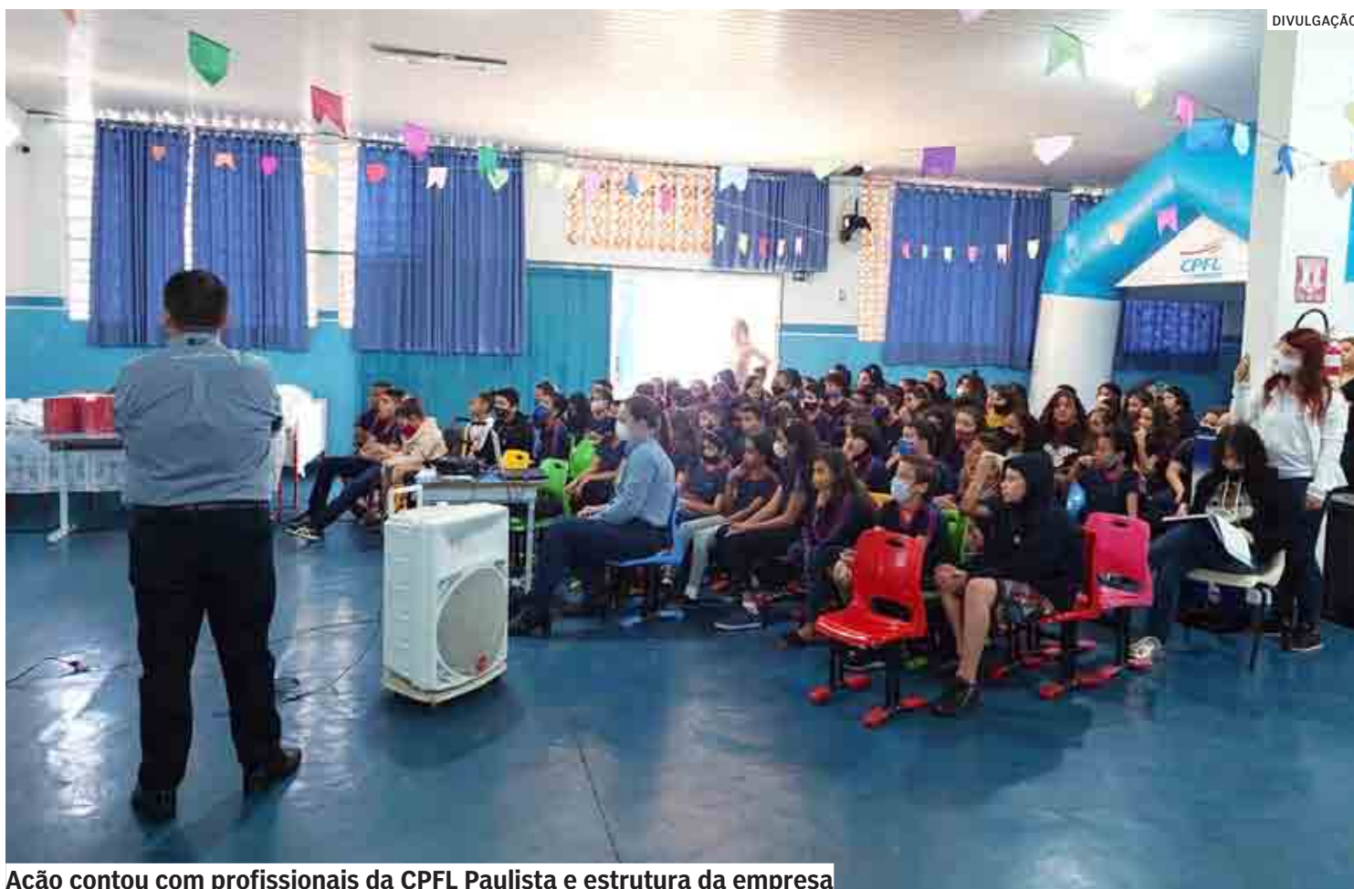
Ação contou com profissionais da CPFL Paulista e estrutura da empresa

A ação contou com profissionais da CPFL Paulista e estrutura da empresa, como tenda itinerante, maquete da casa energizada, caminhão com cesto aéreo e exemplares de EPIs (equipamentos de proteção individual).