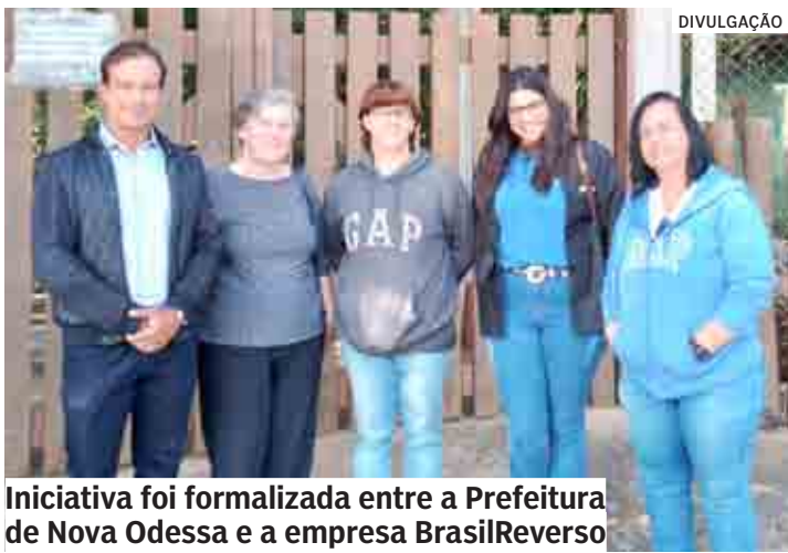
Iniciativa foi formalizada entre a Prefeitura de Nova Odessa e a empresa BrasilReverso

Com o foco em sustentabilidade adotado pela atual gestão, a Prefeitura de Nova Odessa, por meio da Secretaria de Meio Ambiente, quer ampliar as ações de reciclagem no município, através de parceria com a BrasilReverso. A ideia é realizar uma campanha de reciclagem de eletroeletrônicos. PÁGINA 12