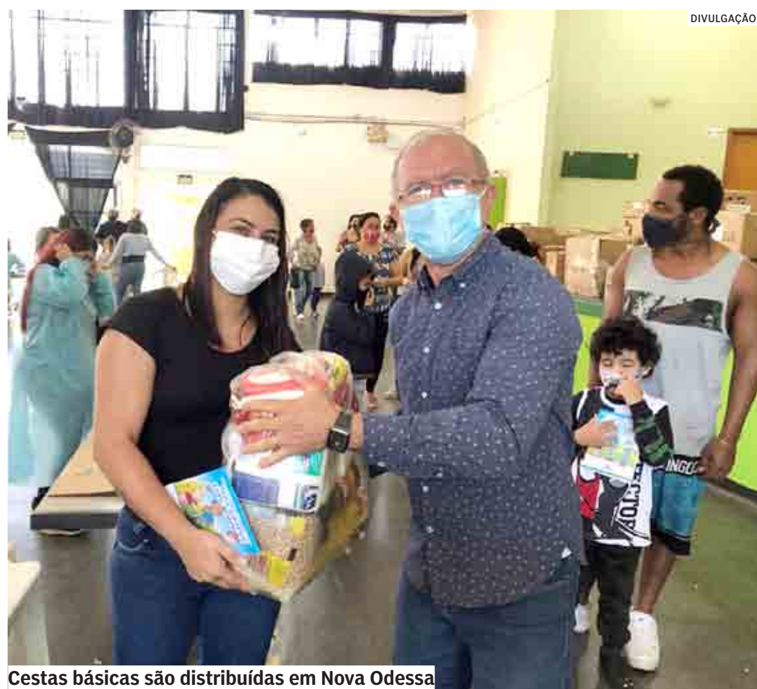
Cestas básicas são distribuídas em Nova Odessa