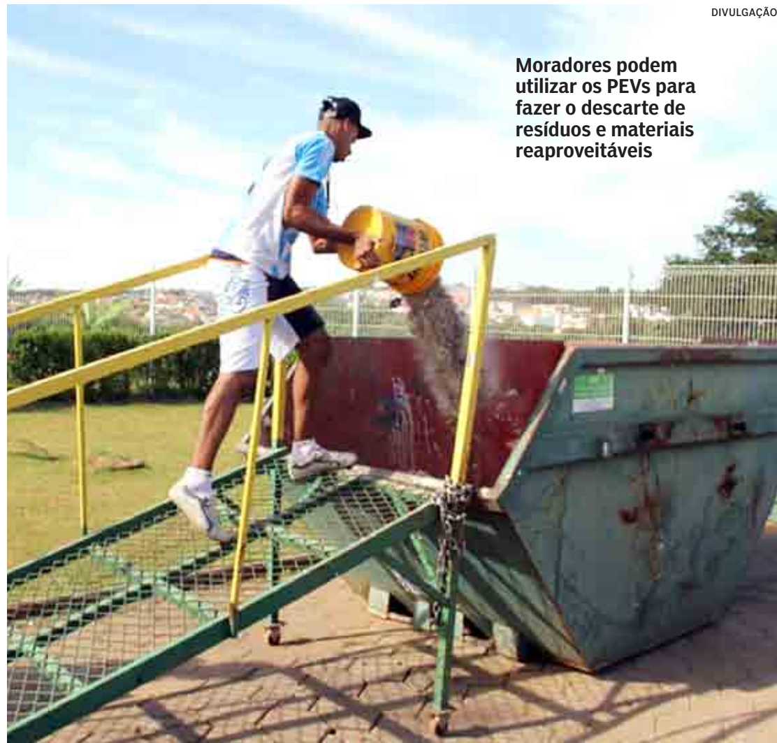
Moradores podem utilizar os PEVs para fazer o descarte de resíduos e materiais reaproveitáveis

Os PEVs são unidades equipadas com caçambas nas quais os moradores podem fazer o descarte correto e separado por tipo de material, que são os seguintes: material reciclável doméstico (como, por exemplo, garrafas PET e plástico), material reciclável ferroso (latas de bebidas, alimentos e de tinta, entre outros), material reciclável de construção civil e material reciclável de madeira e volu-