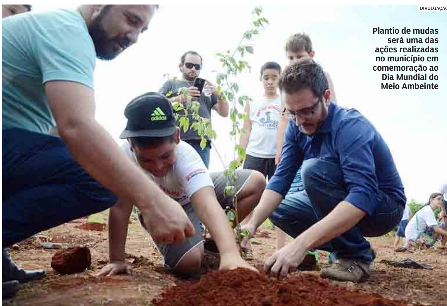
Plantio de mudas será uma das ações realizadas no município em comemoração ao Dia Mundial do Meio Ambiente

A Prefeitura trabalha e desenvolve ações para construir uma cidade sustentável e com respeito às questões ambientais. Os cuidados vão além do plantio e da recuperação de áreas verdes. A intenção é conscientizar