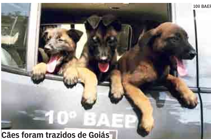
Cães foram trazidos de Goiás

Um dos núcleos do Canil do 10º Baep fica na sede do 48º BPM/I (Batalhão da Polícia Militar), em Sumaré. Assim como tam-