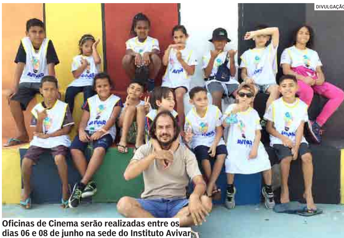
Oficinas de Cinema serão realizadas entre os dias 06 e 08 de junho na sede do Instituto Avivar

"Nosso objetivo com a iniciativa em Sumaré é oportunizar acesso gratuito às crianças e adolescentes em vulnerabilidade social, informações sobre os temas citados através de ativida-