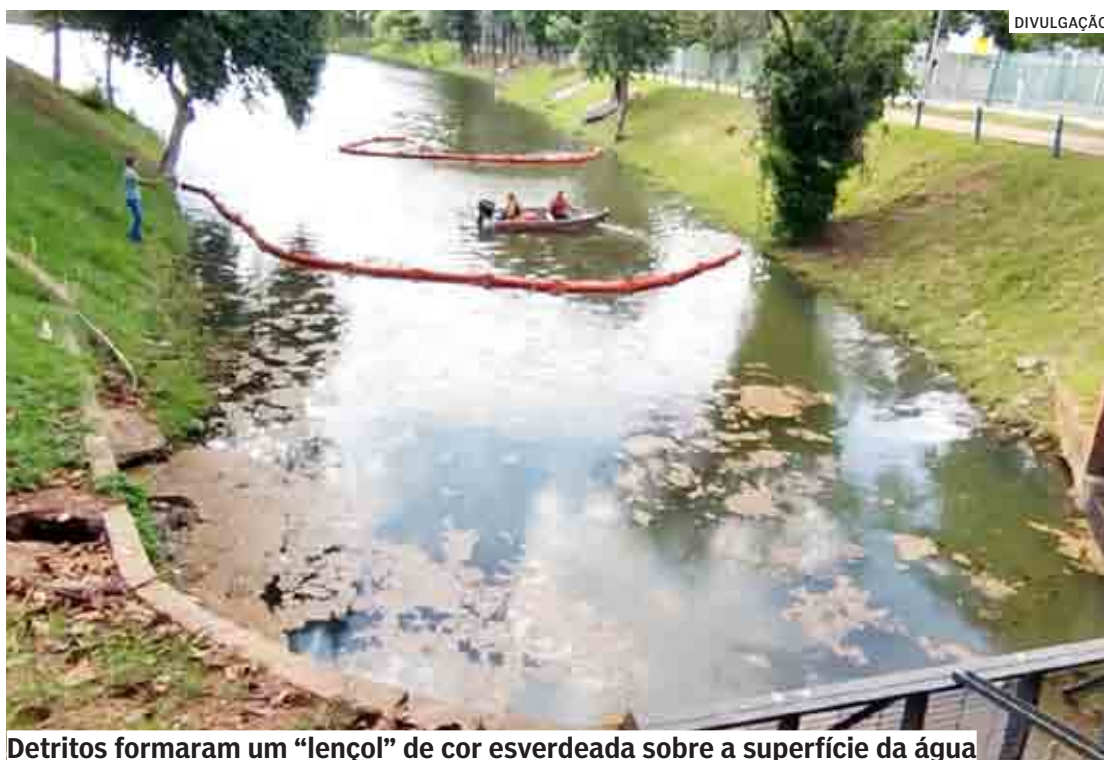
Detritos formaram um “lençol” de cor esverdeada sobre a superfície da água