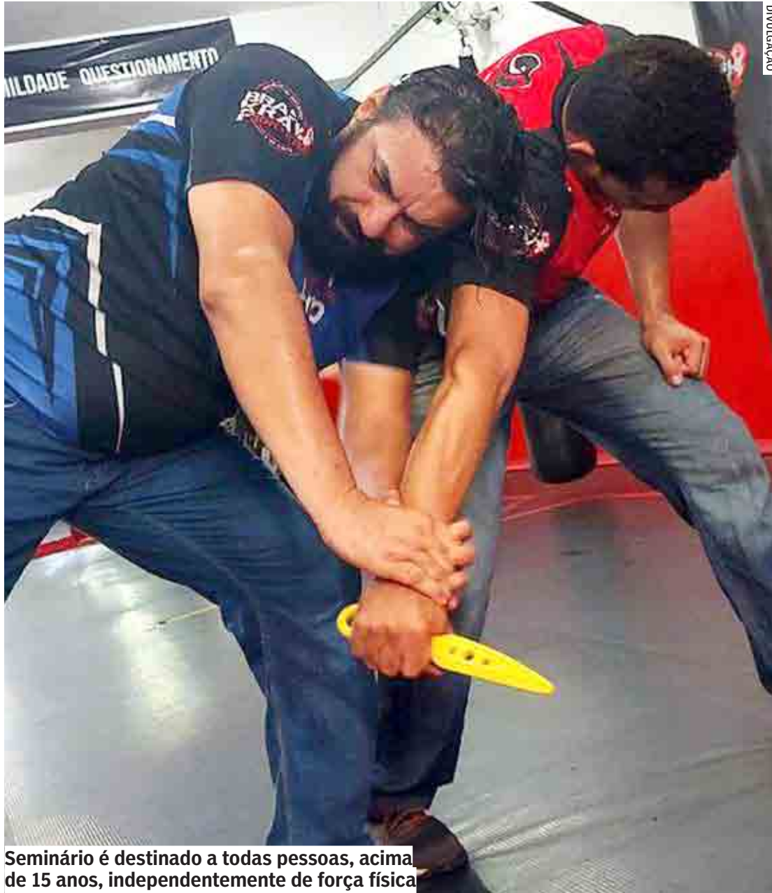
Seminário é destinado a todas pessoas, acima de 15 anos, independentemente de força física

Mas o que é a KMRED? Segundo os organizadores, as letras KM remete ao KravMaga, sistema de combate israelense e R.E.D significa o espírito que move esse grupo de pesquisa não tradicional de defesa pessoal, que se baseia na pesquisa, experimentação e desenvolvimento. O sistema propõe o ensino de técnicas e táticas para se proteger na vida cotidiana, sem aderir a nenhum estilo de luta ou tradição em particular.