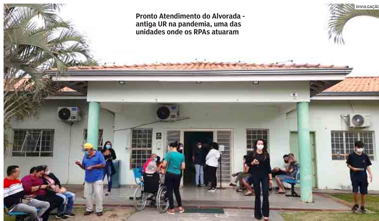
Pronto Atendimento do Alvorada - antiga UR na pandemia, uma das unidades onde os RPAs atuaram

MPT de Campinas exige pagamento da multa aplicada contra a gestão do ex-prefeito Benjamin Bill Vieira de Souza por admitir trabalhadores sem concurso público ou processo seletivo