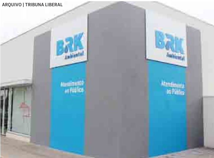
Realizada pela BRK, ação oferece condições facilitadas para o pagamento das faturas pela plataforma Acordo Certo

Da Redação | SUMARÉ tribunaliberal@tribunaliberal.com.br