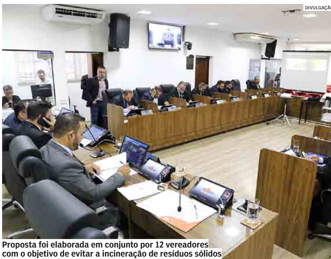
Proposta foi elaborada em conjunto por 12 vereadores com o objetivo de evitar a incineração de resíduos sólidos