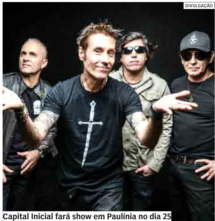
Capital Inicial fará show em Paulínia no dia 25

Da Redação | PAULÍNIA tribunaliberal@tribunaliberal.com.br