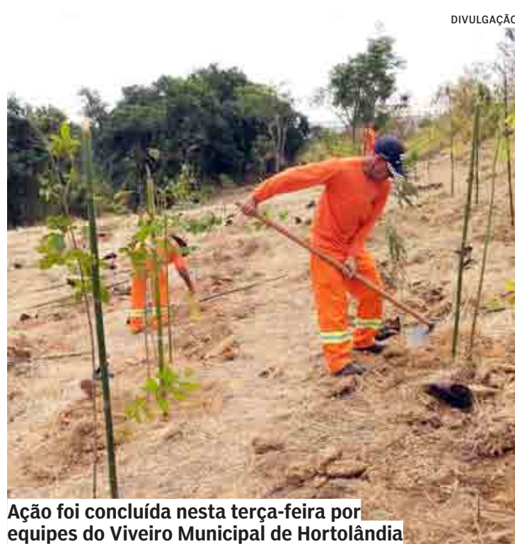
Ação foi concluída nesta terça-feira por equipes do Viveiro Municipal de Hortolândia