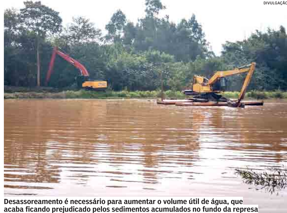
Desassoreamento é necessário para aumentar o volume útil de água, que acaba ficando prejudicado pelos sedimentos acumulados no fundo da represa

A operação está sendo realizada com autorização da Cetesb (Companhia Ambiental do Estado de São Paulo) e conta com duas escavadeiras – uma de braço longo, de 12 metros de extensão, que trabalha na margem, e outra embarcada em balsa, que fica sobre a superfície da represa. A expectativa inicial é a