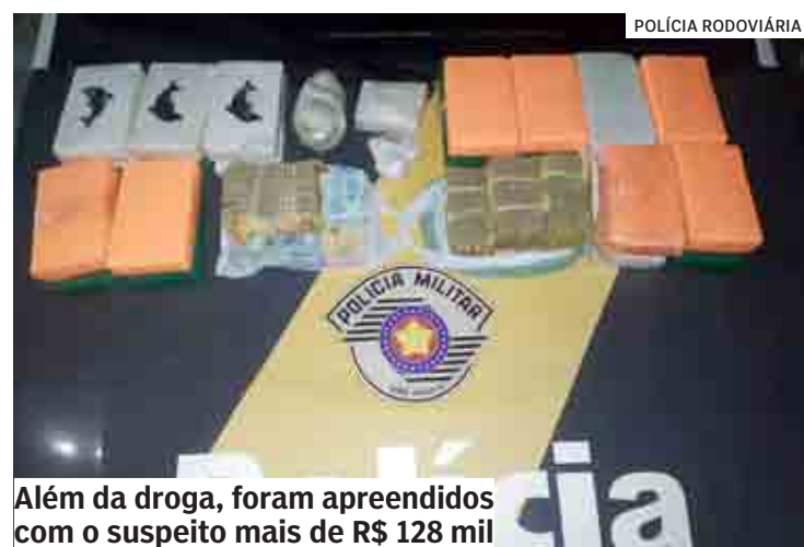
Além da droga, foram apreendidos com o suspeito mais de R$ 128 mil

Ele acabou confessando que comprou o entorpecente em Marília e pagou R$ 20 mil por cada tijolo de cocaína. Disse ainda que a droga seria vendida em Sumaré, mas não declarou o nome do comprador. Com relação