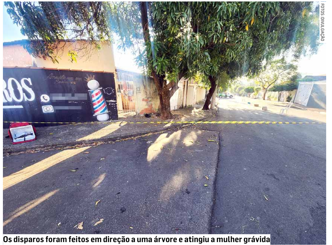
Os disparos foram feitos em direção a uma árvore e atingiu a mulher grávida

César Oliveira • NOVA ODESSA tribunaliberal@tribunaliberal.com.br