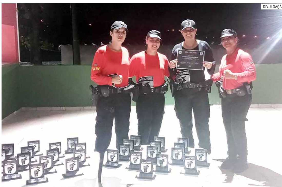
Formação aconteceu em Valinhos, nesta terça-feira (30/04)

Segundo os organizadores, o treinamento tático permitiu às agentes de segurança aprimorar habilidades táticas, dentre elas a capacidade de tomar decisões, desenvolver autoconfiança e segurança em ações diárias, em ambiente inclusivo. Entre os conteúdos abordados, ao longo das 16 horas de treinamento, estavam técnicas de primeiros socorros, defesa pessoal