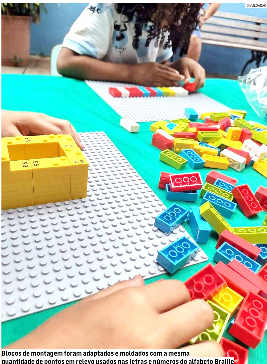
Blocos de montagem foram adaptados e moldados com a mesma quantidade de pontos em relevo usados nas letras e números do alfabeto Braille