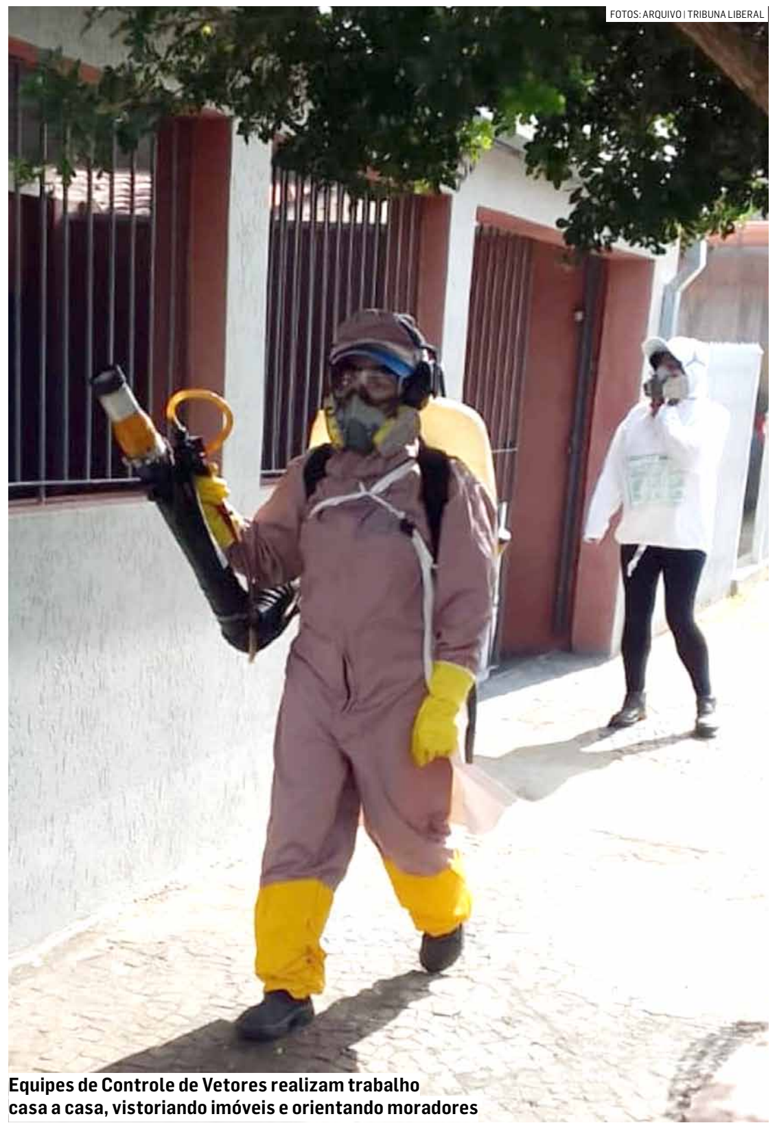
Equipes de Controle de Vetores realizam trabalho casa a casa, vistoriando imóveis e orientando moradores

O Controle da Dengue da Prefeitura de Sumaré também realiza o monitoramento de denúncias recebidas por meio do canal de atendimento 156 e a visita casa a casa para orientação, bloqueio e controle de criadouros.