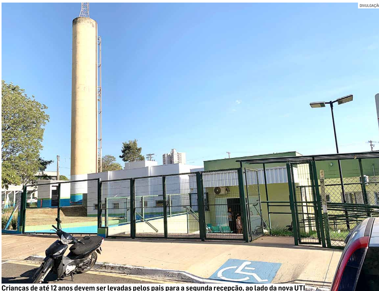
Crianças de até 12 anos devem ser levadas pelos pais para a segunda recepção, ao lado da nova UTI

Com essa medida, os pacientes adultos continuam “fazendo ficha” e passando pela triagem e classificação de risco na recém-modernizada recepção geral do complexo, na Rua Aristides Bassora, nº 301, no Bosque dos Cedros. O mesmo vale