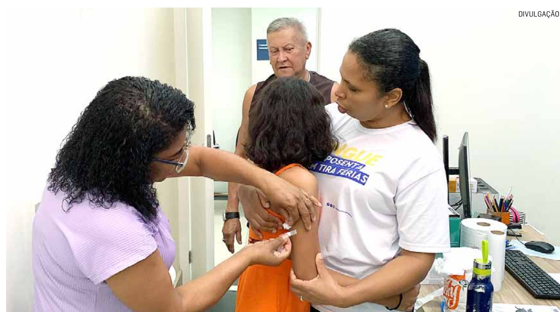
Para se imunizar, os moradores podem se dirigir a qualquer uma das sete UBSs

Da Redação • NOVA ODESSA tribunaliberal@tribunaliberal.com.br