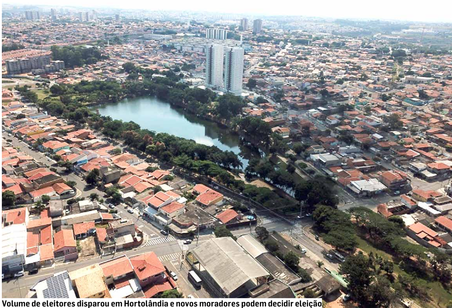
Volume de eleitores disparou em Hortolândia e novos moradores podem decidir eleição

Segundo os dados fornecidos pelo TSE, 83,26% dos eleitores de Hortolândia estão agora cadastrados com biometria, totalizando 132.023 pessoas. Essa implementação visa garantir uma maior segurança e transparência no siste-