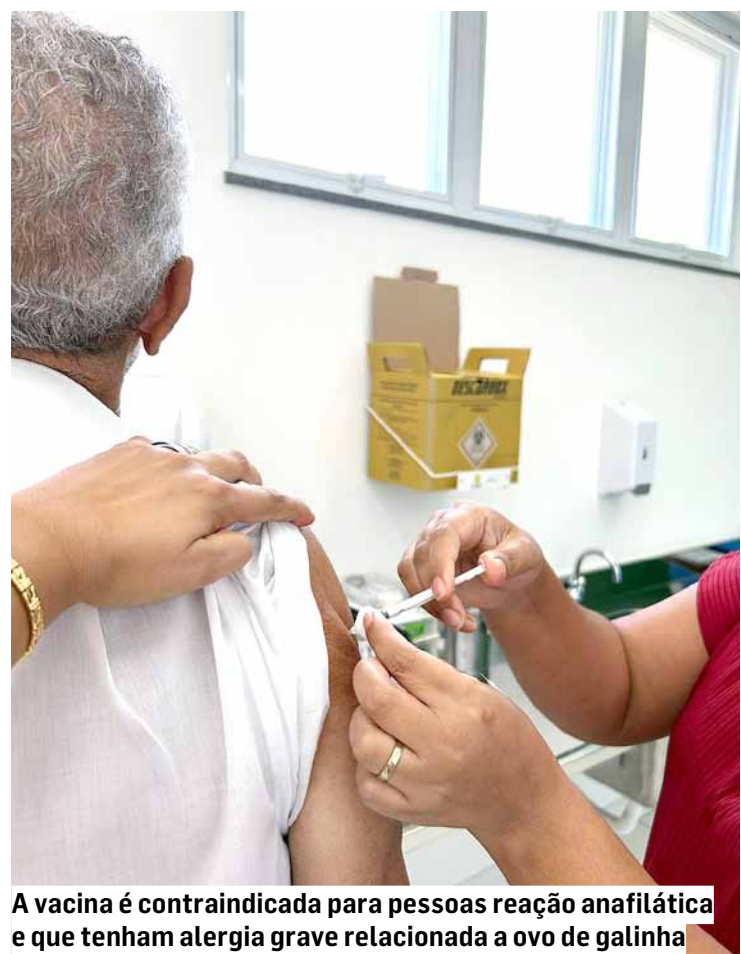
A vacina é contraindicada para pessoas com reação anafilática e que tenham alergia grave relacionada a ovo de galinha