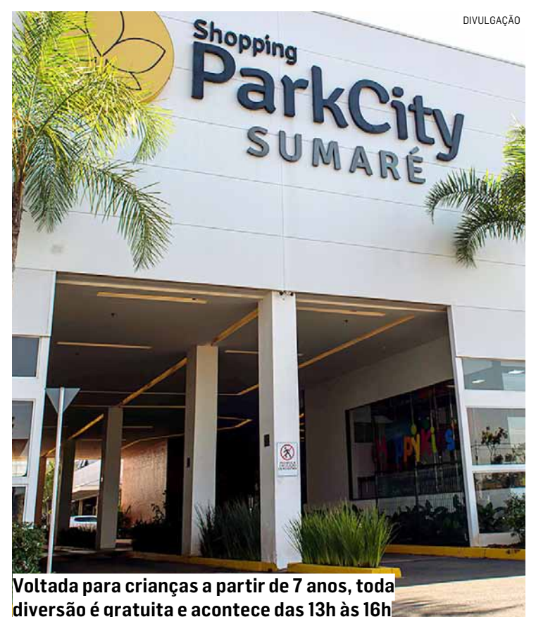
Voltada para crianças a partir de 7 anos, toda diversão é gratuita e acontece das 13h às 16h

Data: 4 de maio (sábado) Horário: das 13h às 16h. Local: Shopping ParkCity Sumaré, no lounge próximo à Milky Moo. Evento gratuito.