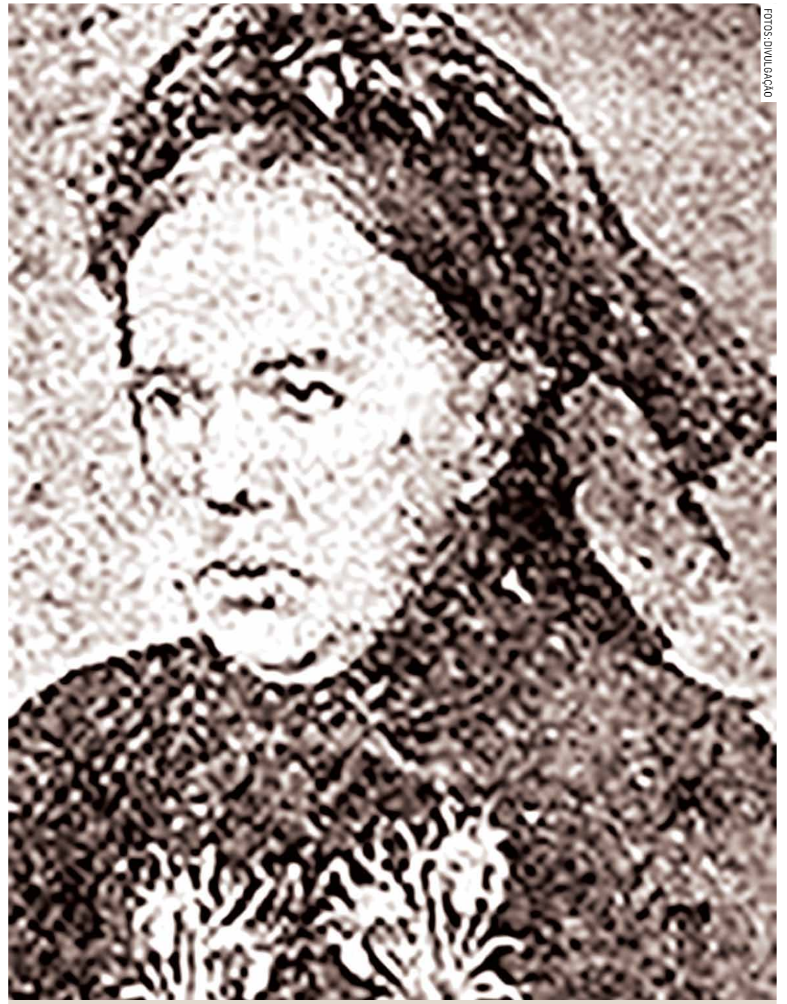
Baronesa de Monte Mor

A Baronesa faleceu em Campinas aos 65 anos, em 02 de setembro de 1880 e o Barão faleceu, também em Campinas, aos 69 anos, em 1884.