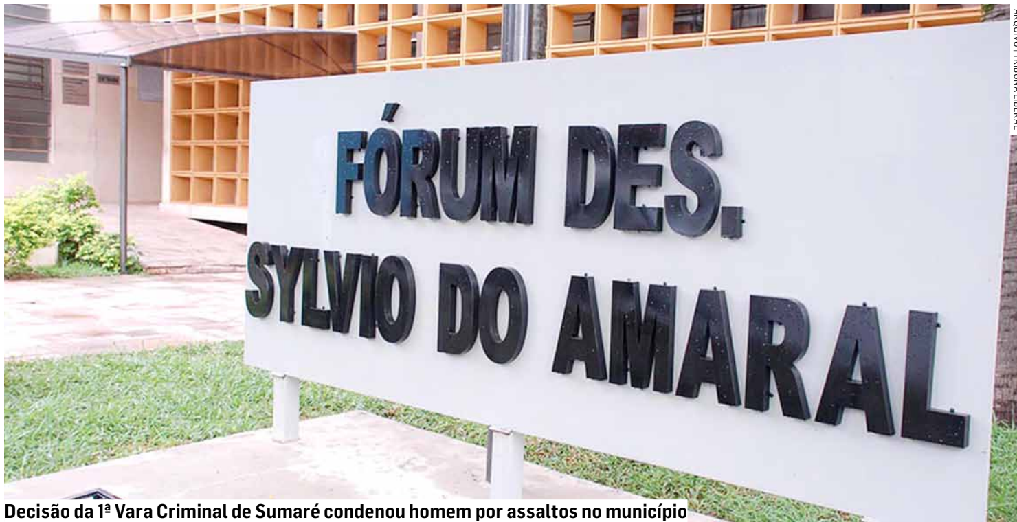
Decisão da 1ª Vara Criminal de Sumaré condenou homem por assaltos no município

Durante o processo, o réu confessou a prática do crime, alegando que estava endividado com uma facção criminosa e come-