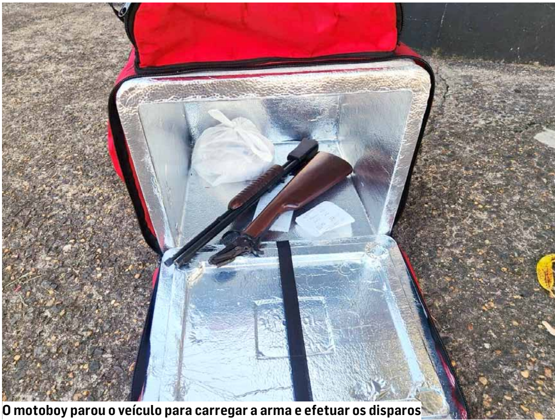
O motoboy parou o veículo para carregar a arma e efetuar os disparos

Acusado disse que seu propósito era apenas dar um susto na ex-companheira e não tinha intenção de ferir ninguém