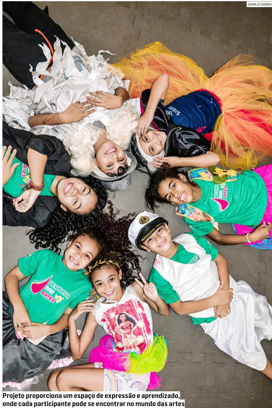
Projeto proporciona um espaço de expressão e aprendizado, onde cada participante pode se encontrar no mundo das artes

Oficinas Semanais - período manhã e tarde (conforme disponibilidade de vaga) Telefone: (19) 3873-9015 E-mail: shd@shd.org.br Endereço: Rua dos Pinheiros, 105 - Jd. Basilicata - Sumaré