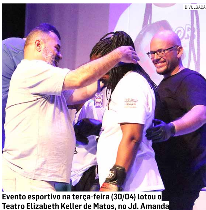
Evento esportivo na terça-feira (30/04) lotou o Teatro Elizabeth Keller de Matos, no Jd. Amanda

Uma experiência única que marcou a vida dos idosos que participam das aulas de boxe do Centro de Convivência da Melhor Ida-