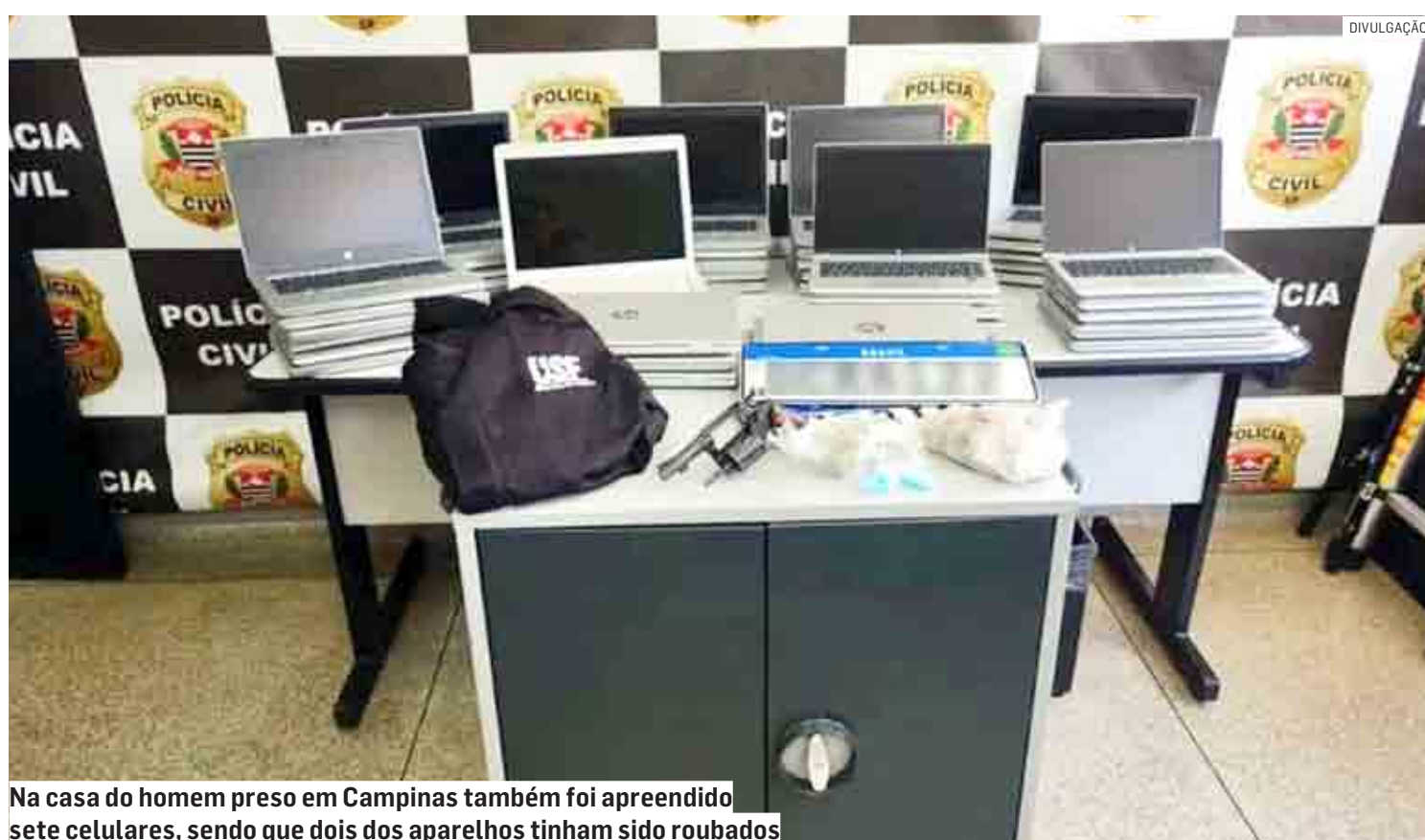
Na casa do homem preso em Campinas também foi apreendido sete celulares, sendo que dois dos aparelhos tinham sido roubados

Cézar Oliveira | REGIÃO tribunaliberal@tribunaliberal.com.br