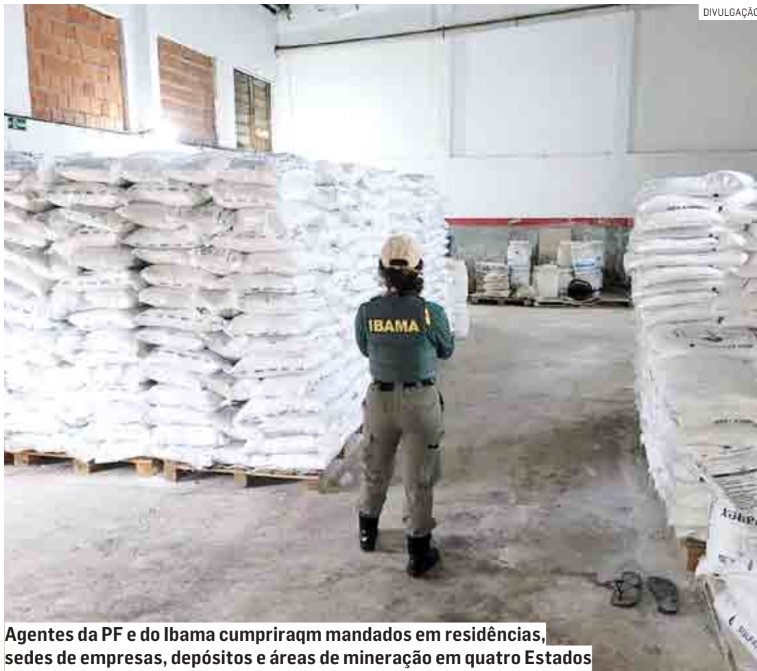
Agentes da PF e do Ibama cumpriram mandados em residências, sedes de empresas, depósitos e áreas de mineração em quatro Estados

A expectativa é que, ao final, mais de cinco toneladas de créditos de mercúrio sem origem sejam eliminados do CTF. “O CTF prevê que toda a comercialização e uso de mercúrio metálico no Brasil ocorra em estrito cumprimento da legislação. Esse escopo institucional é chave para a implementação da Conven-