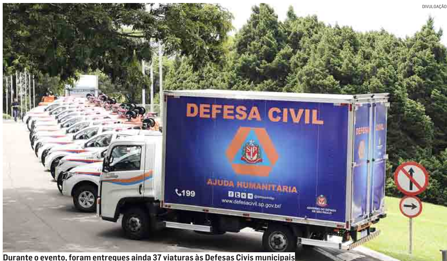
Durante o evento, foram entregues ainda 37 viaturas às Defesas Cíveis municipais

A Defesa Civil do Estado trabalha com medidas para minimizar os desastres e proteger a população, especialmente as que residem em áreas mais vulneráveis. O Estado conta com 813 instrumentos de identificação de risco, que atendem 322 municípios com maior vulnerabilidade para des-