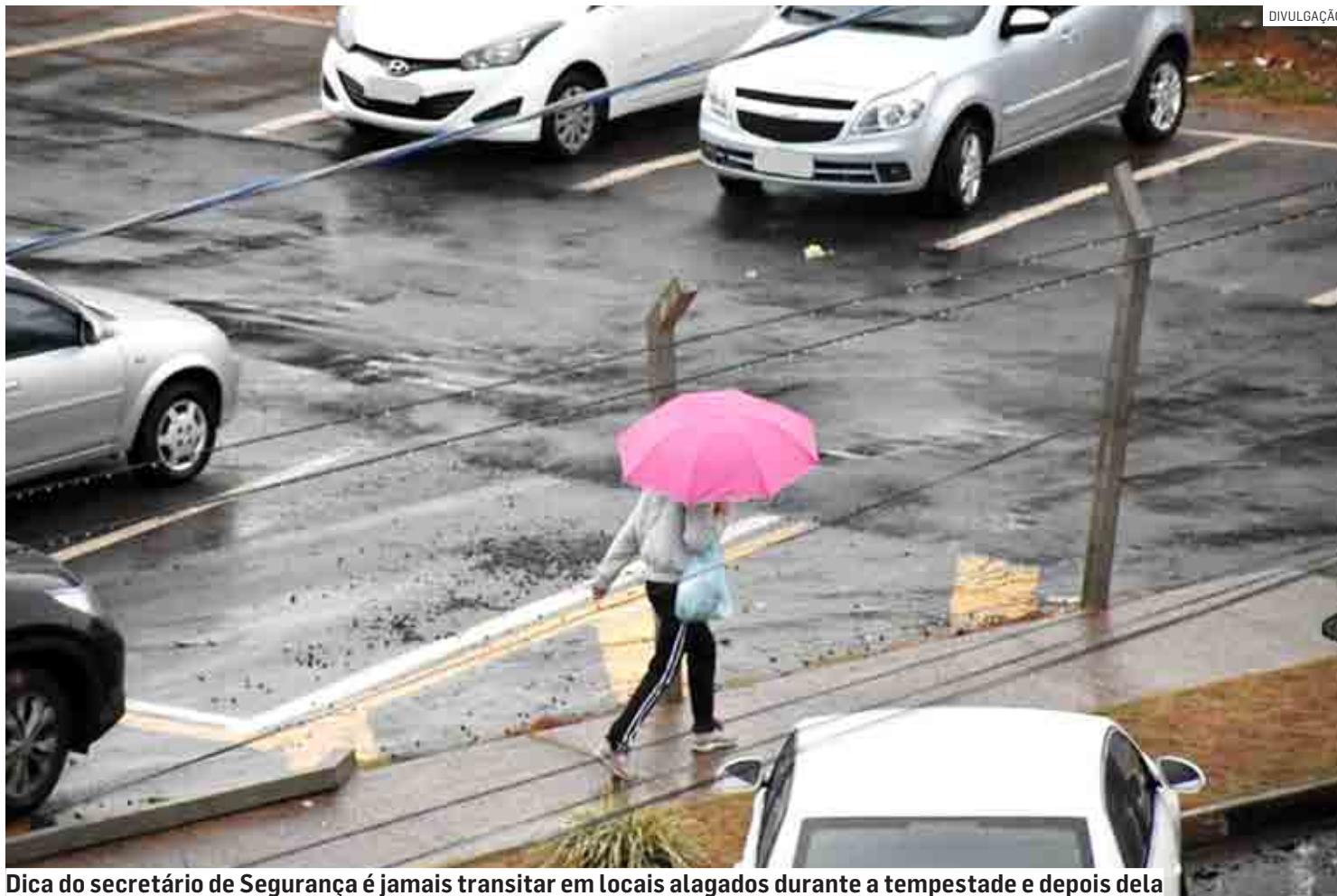
Dica do secretário de Segurança é jamais transitar em locais alagados durante a tempestade e depois dela

O Plano vigora da data da publicação do decreto Nº 5.153, de 29/11/22, até 31 de março de 2023, podendo ser prorrogado, de acordo com a Coordenadoria Estadual de Defesa Civil. Por meio dele, a administração Municipal mobiliza os integrantes do Simpdec (Sistema Municipal de Proteção e Defesa Civil) e demais órgãos de atendimento emergencial, otimizando os recursos existentes. Fazem parte do sistema todas as se-