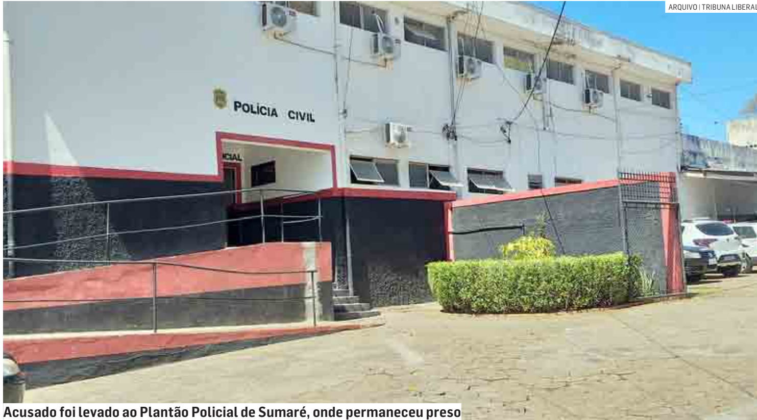
Acusado foi levado ao Plantão Policial de Sumaré, onde permaneceu preso

Os policiais militares se deslocaram para o local e durante o trajeto houve nova informação do Copom, avisando que os indivíduos haviam deixado o local no veículo da vítima, uma caminhonete S10, bran-