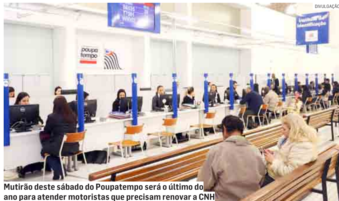
Mutirão deste sábado do Poupatempo será o último do ano para atender motoristas que precisam renovar a CNH

Com a proximidade do fim do ano, de festas, férias escolares e viagens, a procura pela renovação de CNH nos mutirões do Poupatempo vem crescendo desde julho.