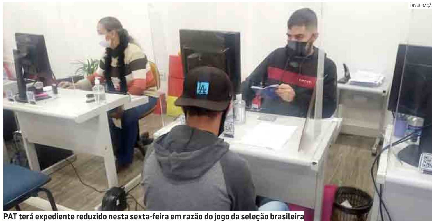
PAT terá expediente reduzido nesta sexta-feira em razão do jogo da seleção brasileira