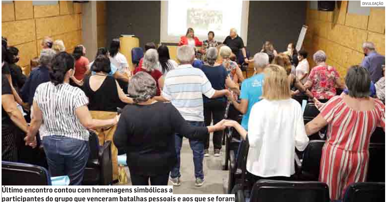
Último encontro contou com homenagens simbólicas a participantes do grupo que venceram batalhas pessoais e aos que se foram

“A Papoterapia é uma raiz, um vínculo de fortalecimento entre os participantes, mas também dos familiares, que às vezes acompanham e conversam com eles sobre o que é trabalhado nas sessões. Eu ganhei um presente enorme ao apoiar o projeto, que foram vocês, que me deram todo