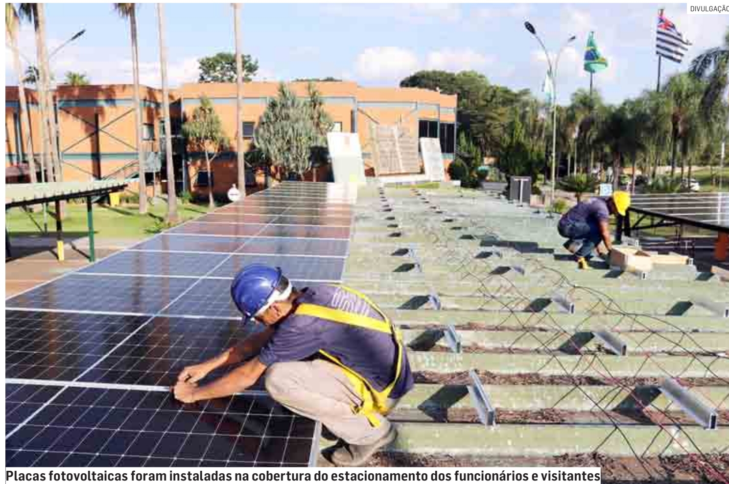
Placas fotovoltaicas foram instaladas na cobertura do estacionamento dos funcionários e visitantes

Objetivo é reduzir aproximadamente 85% da conta de energia elétrica, que hoje tem o custo mensal de R$ 24 mil; investimento é de R$ 1,48 milhão, valor que deve retornar em aproximadamente seis anos