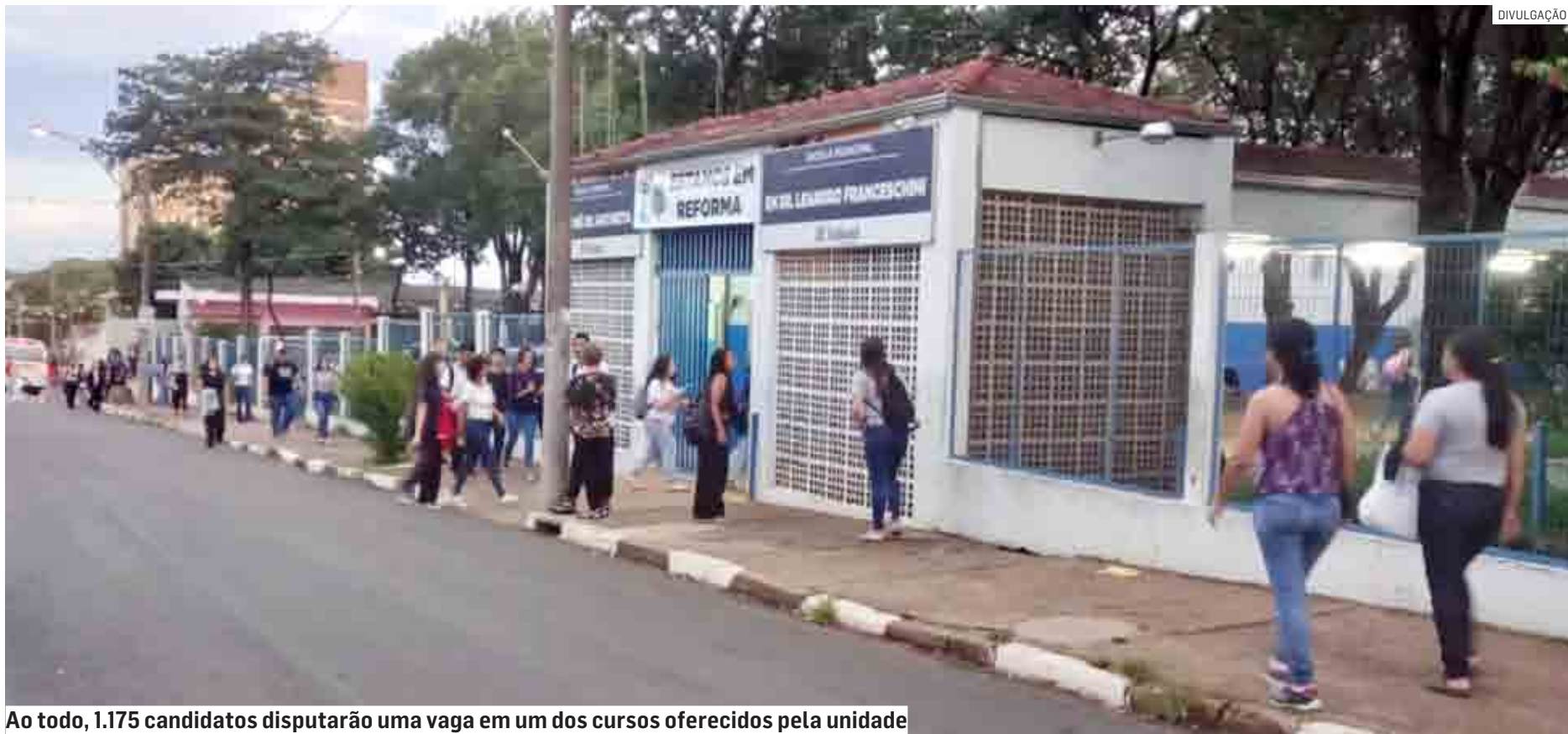
Ao todo, 1.175 candidatos disputarão uma vaga em um dos cursos oferecidos pela unidade

Processo seletivo acontece às 12h do próximo domingo (4), na sede da instituição, no Jardim Carlos Basso, em Sumaré; prova será composta por 60 questões diversas