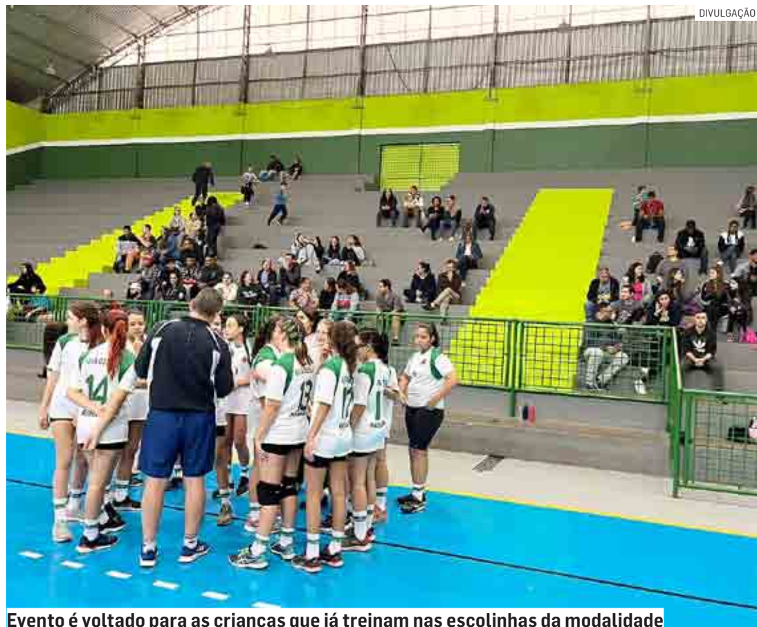
Evento é voltado para as crianças que já treinam nas escolinhas da modalidade

Da Redação | NOVA ODESSA tribunaliberal@tribunaliberal.com.br