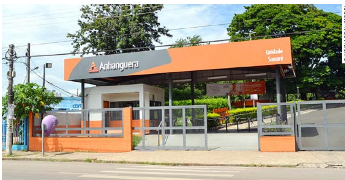
Evento que debate a Saúde acontece a partir das 7h30, na Faculdade Anhanguera

“Desde o início do nosso mandato, estamos investindo recursos e esforços para humanizar o atendimento em Saúde em Sumaré. Já são vários avanços, mas sempre podemos melhorar ainda mais e, para isso, a participação popular é essencial. Todos estão convidados a participar da conferência e contribuir com suas opiniões e sugestões”, dis-