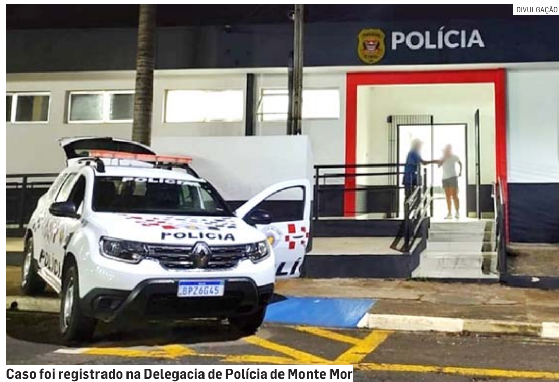
Caso foi registrado na Delegacia de Polícia de Monte Mor

Cézar Oliveira | SUMARÉ tribunaliberal@tribunaliberal.com.br