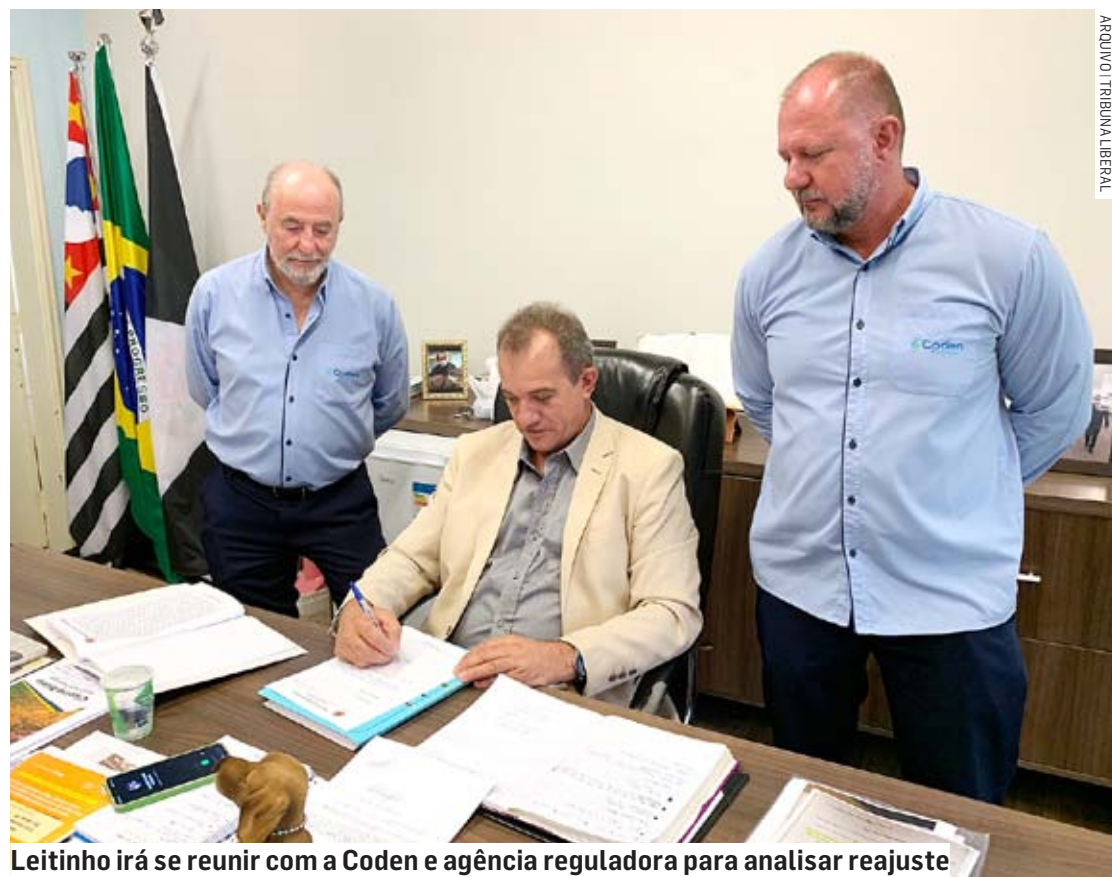
Leitinho irá se reunir com a Coden e agência reguladora para analisar reajuste

Os consumidores que se enquadram nos critérios do programa já foram selecionados no CADÚnico e receberão o desconto na conta automaticamente, sem a necessidade de se deslocarem até à área de atendimento da Coden.