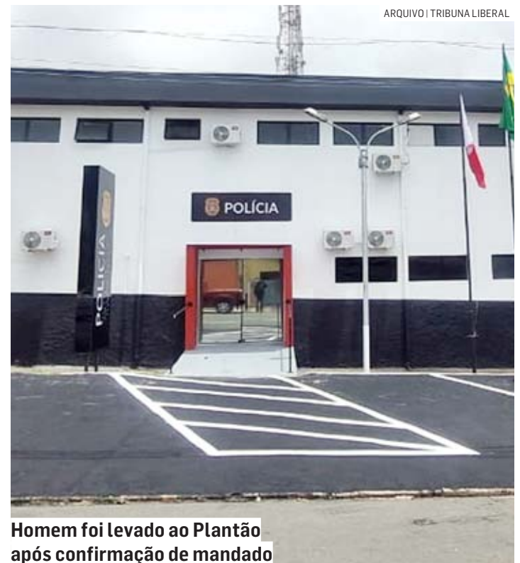
Homem foi levado ao Plantão após confirmação de mandado

Policiais militares foram acionados via Copom para atendimento da ocorrência de um indivíduo procurado pela justiça. Os policiais se deslocaram até o endereço denunciado, onde fizeram contato com a proprietária da residência, a qual informou que