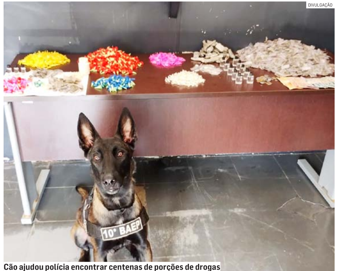
Cão ajudou polícia encontrar centenas de porções de drogas

Durante busca pessoal, os militares acharam com o indivíduo R$ 70 em notas trocadas e um celular. Ao vistoriar a sacola por ele dispensada, foram localizados 50 porções de maconha, 80 porções de crack, 121 microtubos de cocaína, quatro porções de haxixe e três frascos de lança perfume, além de mais