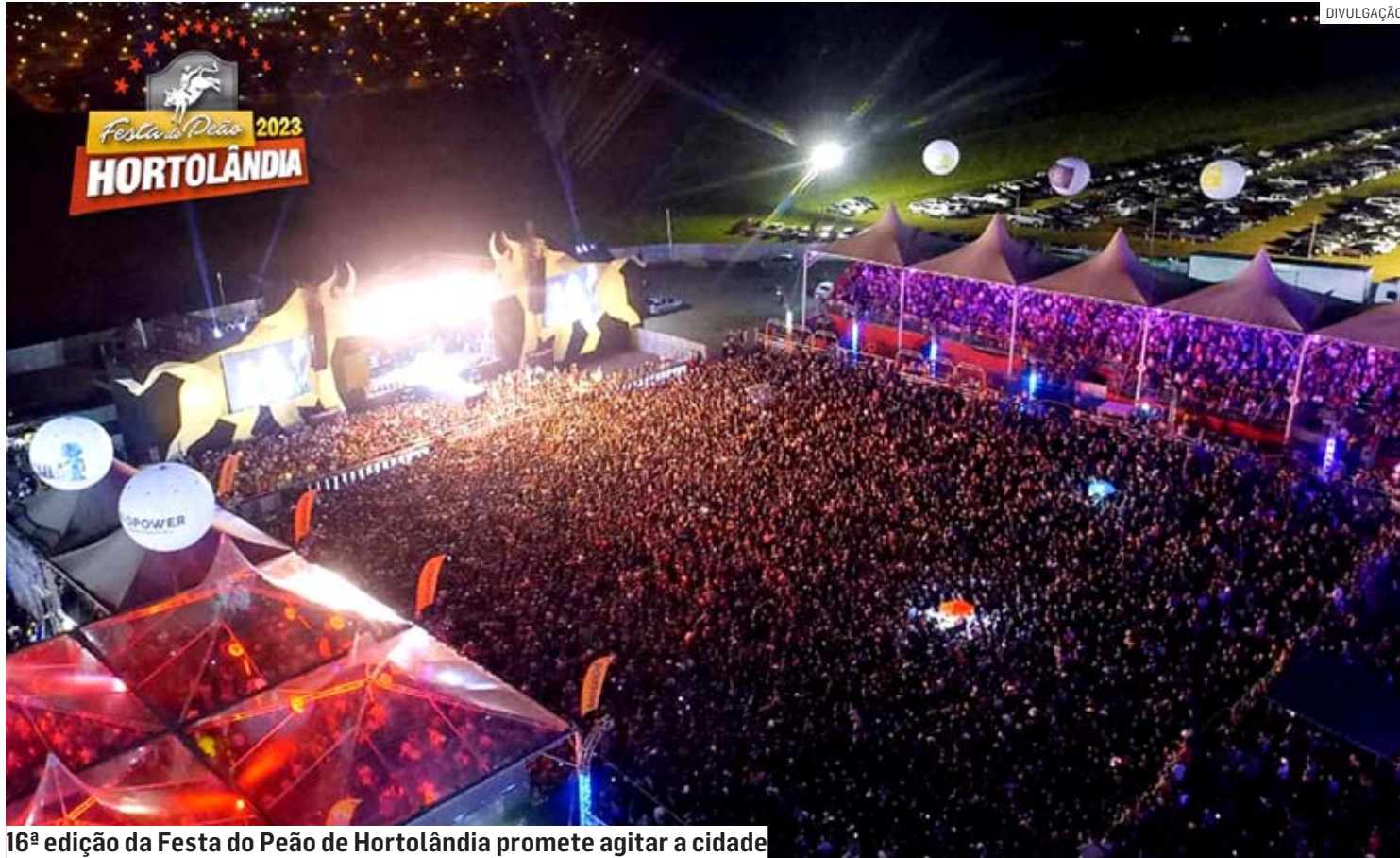
16ª edição da Festa do Peão de Hortolândia promete agitar a cidade

“Vale ressaltar que este é um lote promocional de lançamento, com quantidade limitada e que poderá ser adquirido somente de forma online. As vendas em pontos físicos acontecerão a partir de abril”, informou a organização.