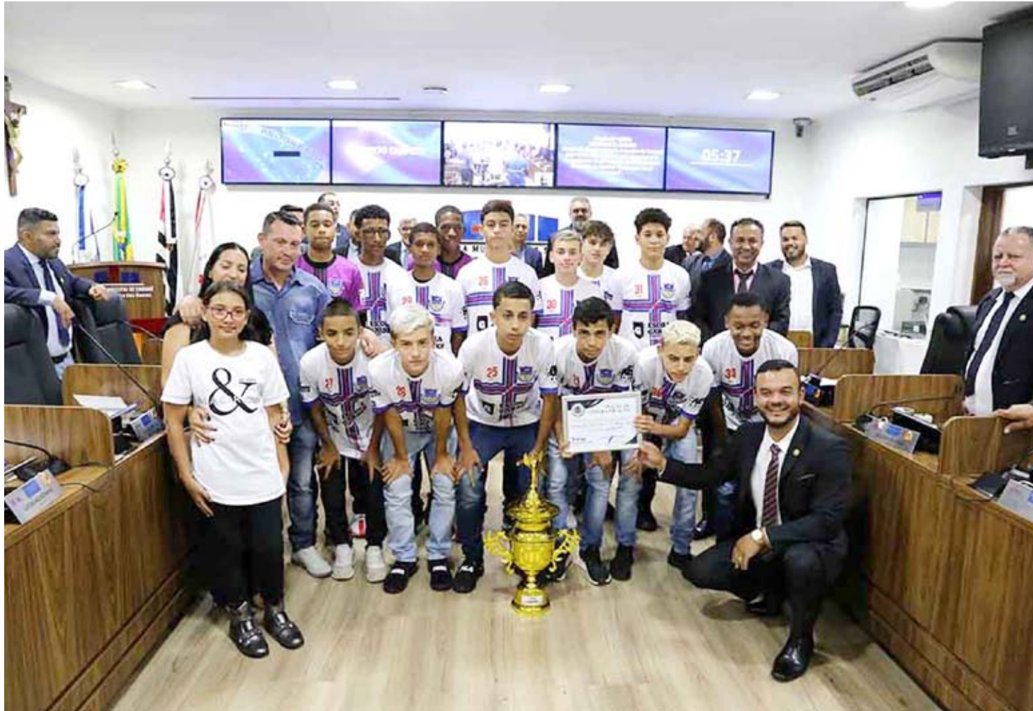
Jogadores do Sub-13 na homenagem na Câmara