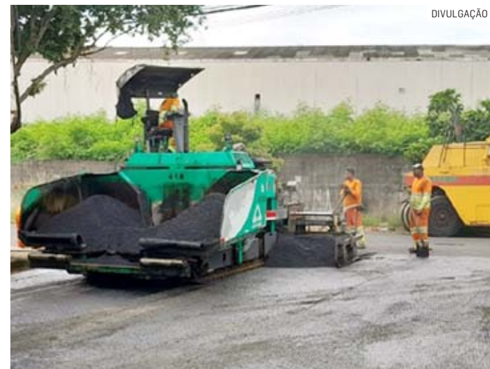
Trabalhos iniciaram pelas ruas das Seringueiras e Cactos

Foram investidos R$ 2.815.923,97. Deste total, R$ 2.391.283,00 são recursos obtidos pela administração junto ao Governo Federal e R$ 424.640,97, em recursos próprios. De acordo com a Secretaria de Obras, a área total de recape é de 38.188,47 m 2 , aproximadamente 4,55 km de vias asfaltadas.