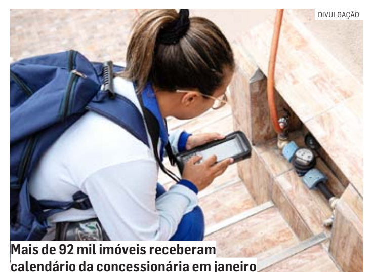
Mais de 92 mil imóveis receberam calendário da concessionária em janeiro