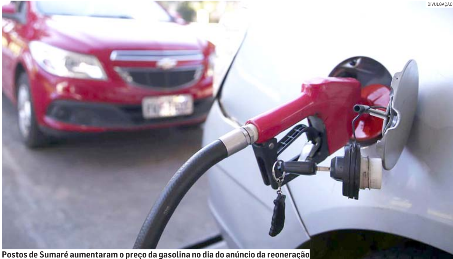
Postos de Sumaré aumentaram o preço da gasolina no dia do anúncio da reoneração

Até o dia 25 de fevereiro, segundo dados da ANP (Agência Nacional do Petróleo e Gás Natural), a gasolina era comercializada a um valor médio de R$ 4,83 em Sumaré, a um preço mínimo de R$ 4,24, e a um custo máximo de R$ 5,19 o litro. Isso quer dizer que os postos que cobravam R$ 5,19, repassando a nova