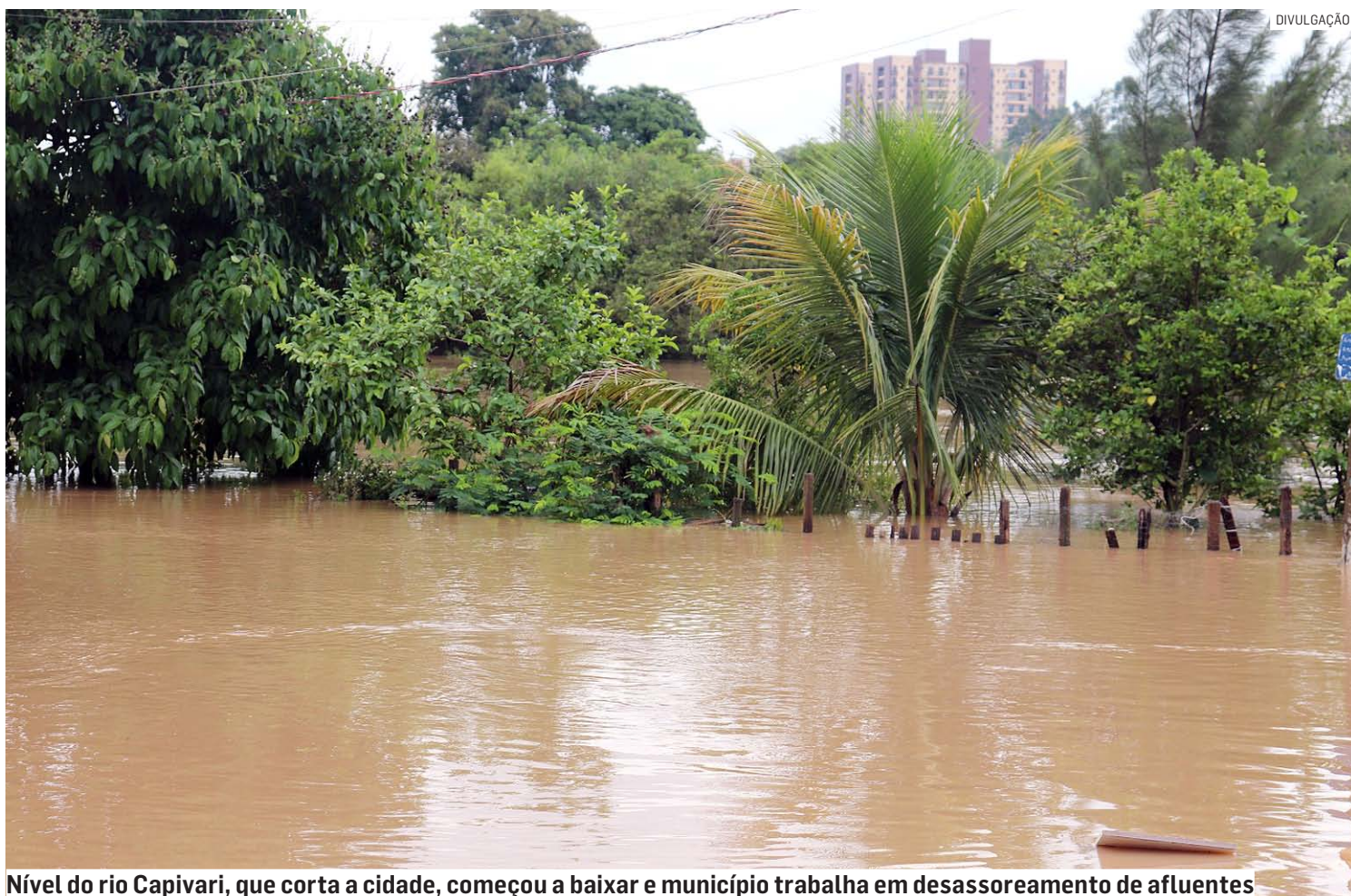
Nível do rio Capivari, que corta a cidade, começou a baixar e município trabalha em desassoreamento de afluentes

Além da presença in loco das equipes da Defesa Civil, a população tem disponível os contatos: 19.3889-1622 (Defesa Civil); 153 ou 19.3879-2823 (Guarda Civil Municipal); e 19.3879-9882 ou 19.3879-9885 (Mobilidade Urbana e Trânsito).