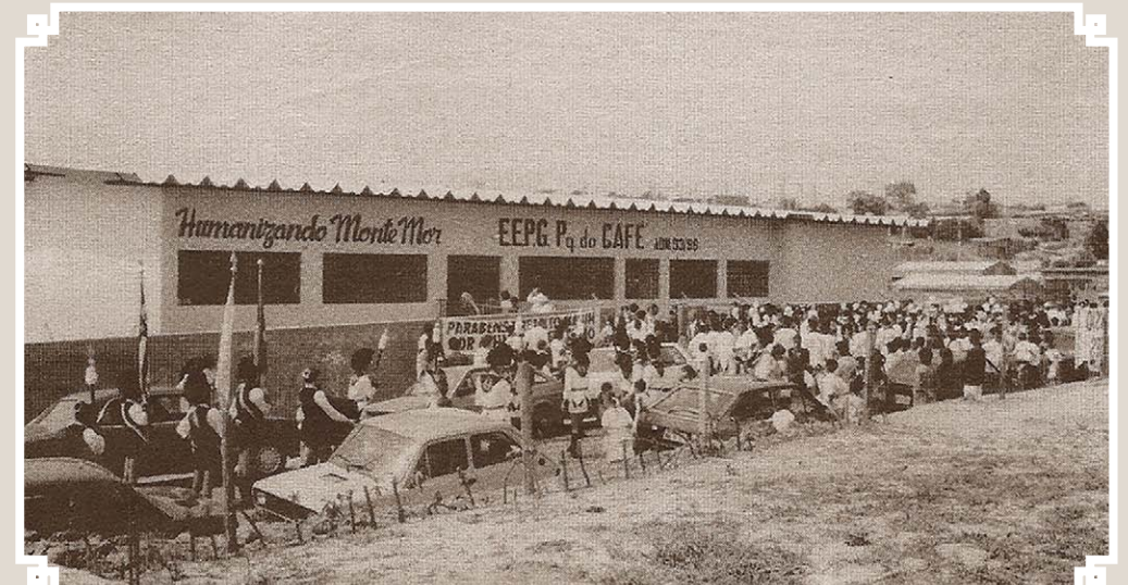
Foto de março de 1995 mostrando o prédio da então Escola Estadual de Primeiro Grau do Parque do Café. Esse prédio com 18 salas, galpão e quadra poliesportiva foi construído com recursos exclusivos da Prefeitura de Monte Mor, pelo então prefeito Nabih Assis e a escola foi inaugurada em 04 de setembro de 1994. Hoje esse estabelecimento de ensino denomina-se EE Cônego Cyriaco Scaranello Pires.