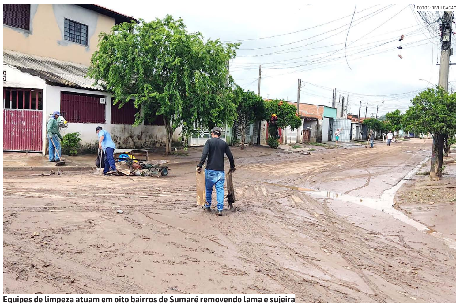
Equipes de limpeza atuam em oito bairros de Sumaré removendo lama e sujeira