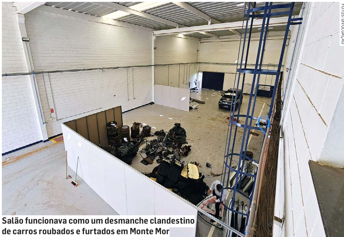
Salão funcionava como um desmanche clandestino de carros roubados e furtados em Monte Mor

Policiais chegaram ao local por empresa de rastreamento; galpão, localizado em frente à unidade da Tetra Pak, estava abandonado e com centenas de peças de veículos