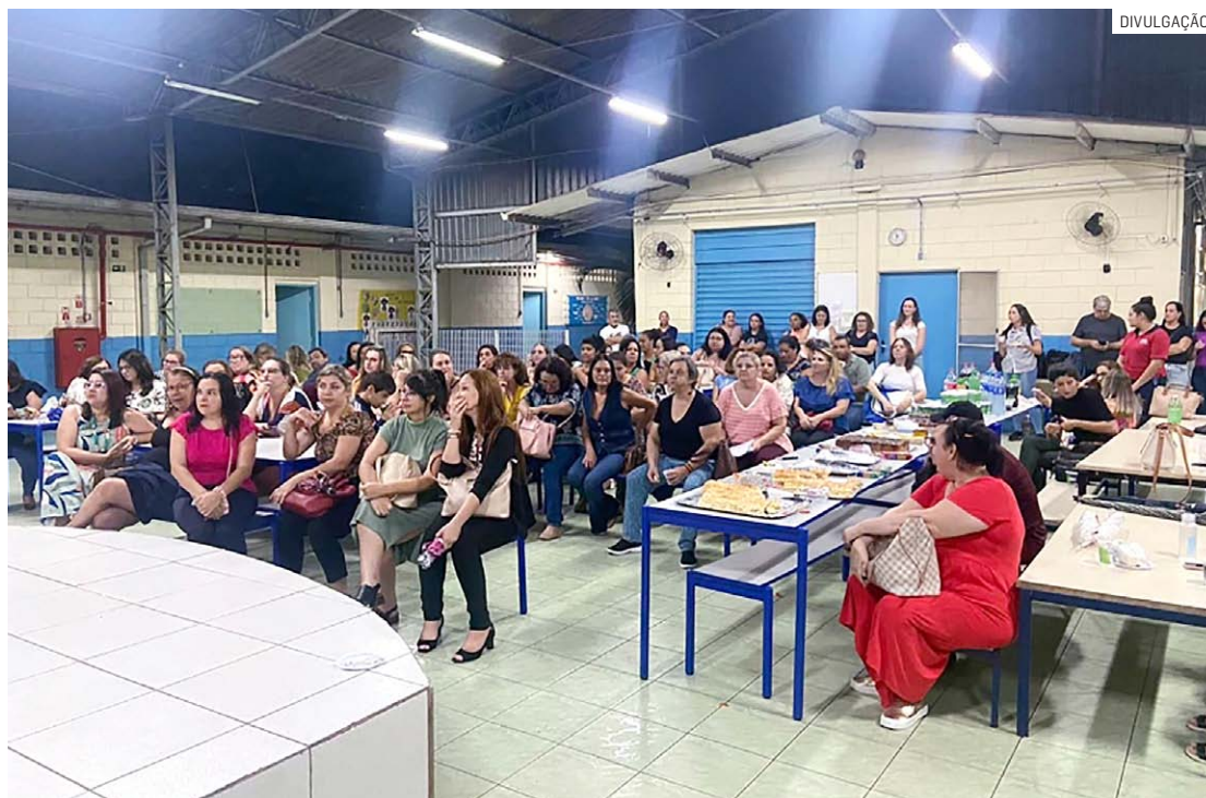
Aberto a toda comunidade escolar, evento contou com a participação de cerca de 130 pessoas

Aberto a toda comunidade escolar, o evento contou com a participação de integrantes do Conselho Municipal de Educação e servidores públicos da Secretaria de Educação, Ciência e