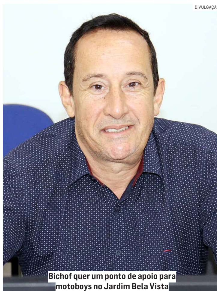
Bichof quer um ponto de apoio para motoboys no Jardim Bela Vista

O vereador ainda indicou o direcionamento de R$ 249 mil para a construção de quadras poliesportivas na praça do bairro Mathilde Berzin, no complexo esportivo do bairro Santa Rosa, e na comunidade de Santa Luzia, no Parque Residencial Triunfo. "A construção das quadras contribui para a prática de atividade física, in-