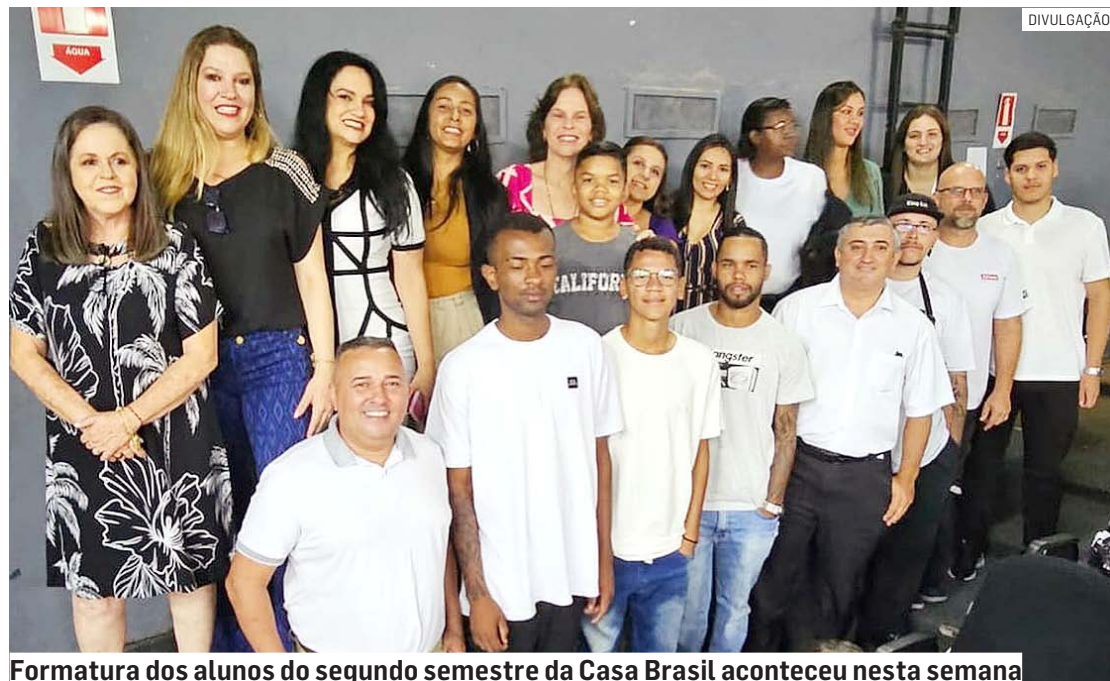
Formatura dos alunos do segundo semestre da Casa Brasil aconteceu nesta semana

Da Redação • SUMARÉ tribunaliberal@tribunaliberal.com.br