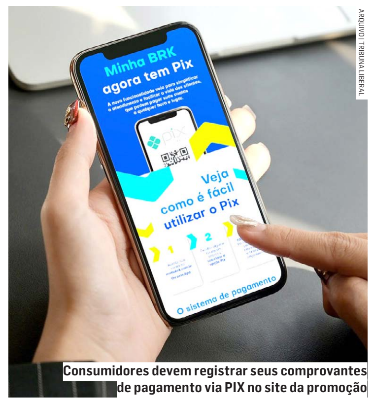
Consumidores devem registrar seus comprovantes de pagamento via PIX no site da promoção

Para mais informações, acesse o regulamento no site da promoção: sortenacontabr.com.br.