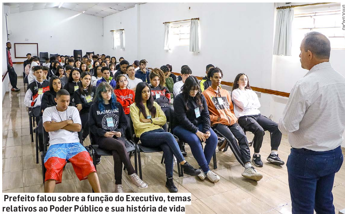
Prefeito falou sobre a função do Executivo, temas relativos ao Poder Público e sua história de vida

“É sempre um prazer poder conversar com nossos jovens, que estão se preparando para entrar com o pé direito no mercado de trabalho graças ao trabalho do SOS. Como prefeito, a gente faz tudo que pode para garantir um futuro melhor para nossas crianças e adolescentes, e se podemos ajudar também con-