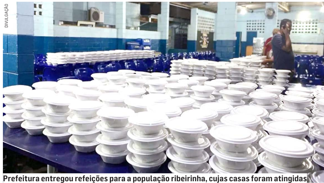
Prefeitura entregou refeições para a população ribeirinha, cujas casas foram atingidas