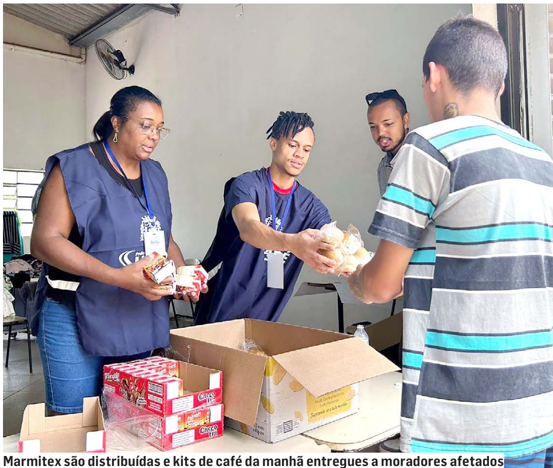
Marmitex são distribuídas e kits de café da manhã entregues a moradores afetados

“Nesta quinta-feira, distribuímos mais 1.400 kits de café da manhã às famílias em situação de vulnerabilidade social que tiveram seus lares atingidos pelas chuvas e cheias dos ribeirões da nossa cidade”, afirmou Dal-