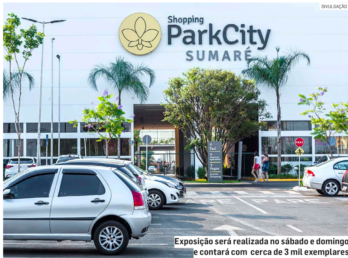
Exposição será realizada no sábado e domingo e contará com cerca de 3 mil exemplares

O Encontro de Colecionadores, que também contará com atividades para as crianças, será realizado na Alameda ParkCity no sábado, das 10h às 22h, e domingo, das 14h às 20h.