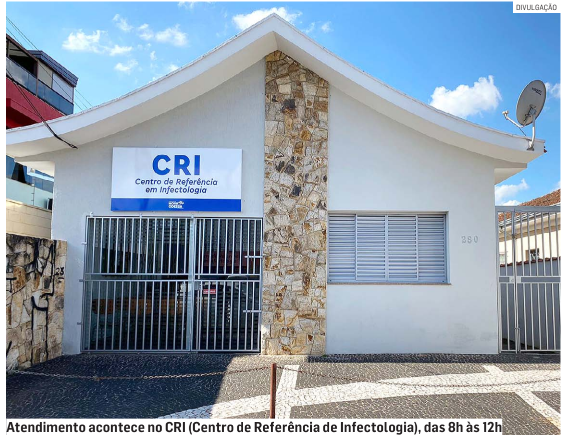
Atendimento acontece no CRI (Centro de Referência de Infecologia), das 8h às 12h

Além do novo CRI, todas as UBSs oferecem durante o mês a testagem rápida de HIV, sífilis, e he-