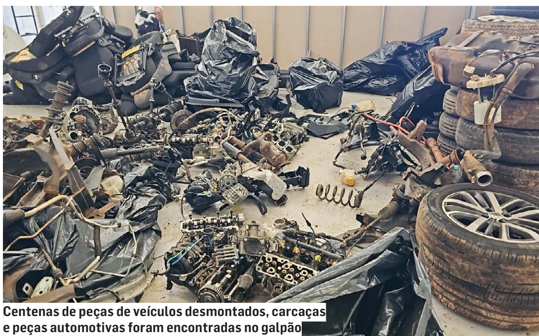
Centenas de peças de veículos desmontados, carcaças e peças automotivas foram encontradas no galpão