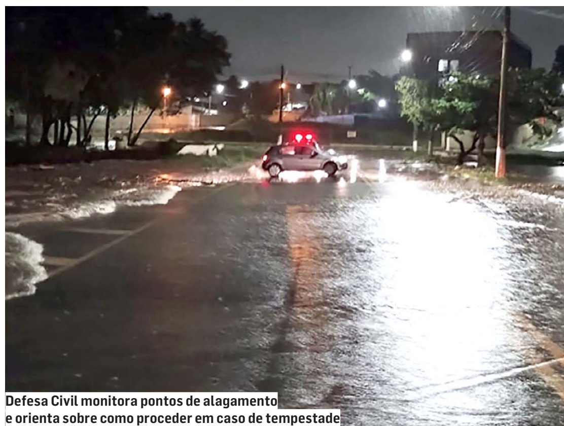
Defesa Civil monitora pontos de alagamento e orienta sobre como proceder em caso de tempestade