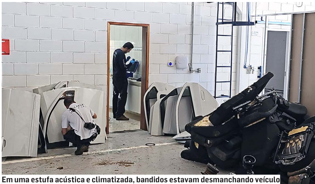
Em uma estufa acústica e climatizada, bandidos estavam desmanchando veículo