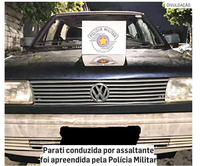
Parati conduzida por assaltante foi apreendida pela Polícia Militar

O suspeito juntamente com o carro foi conduzido até o Plantão Policial de Hortolândia, onde a vítima o reconheceu como autor do assalto, permanecendo o infrator à disposição da justiça.