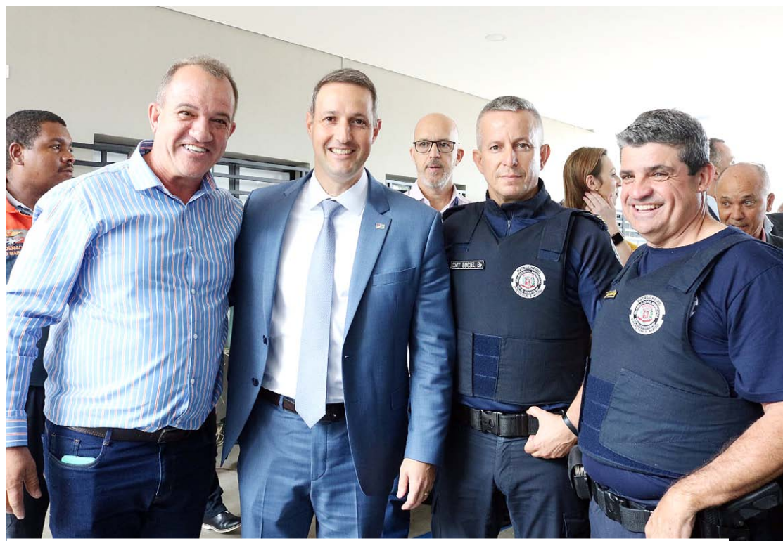
Derrite parabenizou Leitinho pela instalação do Corpo de Bombeiros em Nova Odessa