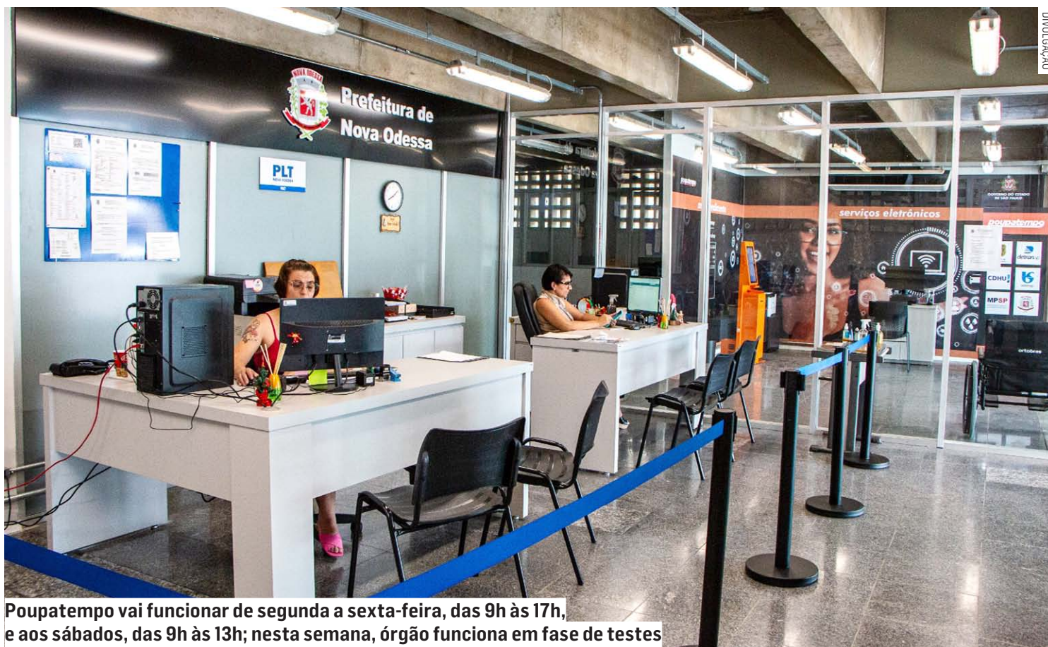
Poupatempo vai funcionar de segunda a sexta-feira, das 9h às 17h, e aos sábados, das 9h às 13h; nesta semana, órgão funciona em fase de testes

Servidores destacaram a infraestrutura moderna e confortável da unidade, que também vai abrigar o Centro de Referência ao Trabalhador e Empregador