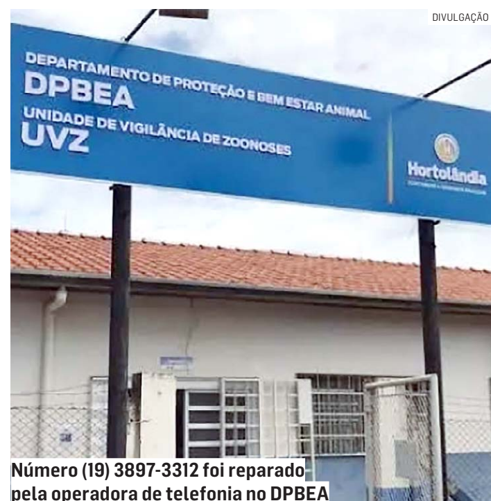
Número (19) 3897-3312 foi reparado, pela operadora de telefonia no DPBEA

O conserto de um dos telefones fixos do órgão facilitará também a comunicação com a UVZ (Unidade de Vigilância de Zoonoses), órgão da Secretaria de Saúde, que funciona no mesmo endereço do DPBEA, na rua Athanázio Gigo, 60, no bairro Chácara Recreio 2000. Além destes telefones, a população pode entrar em contato com o DPBEA ou a UVZ, de segunda a sexta-feira, das 8h às 17h, pelos e-mails dpbea.smmads@hortolandia.sp.gov.br e uvz@hortolandia.sp.gov.br .