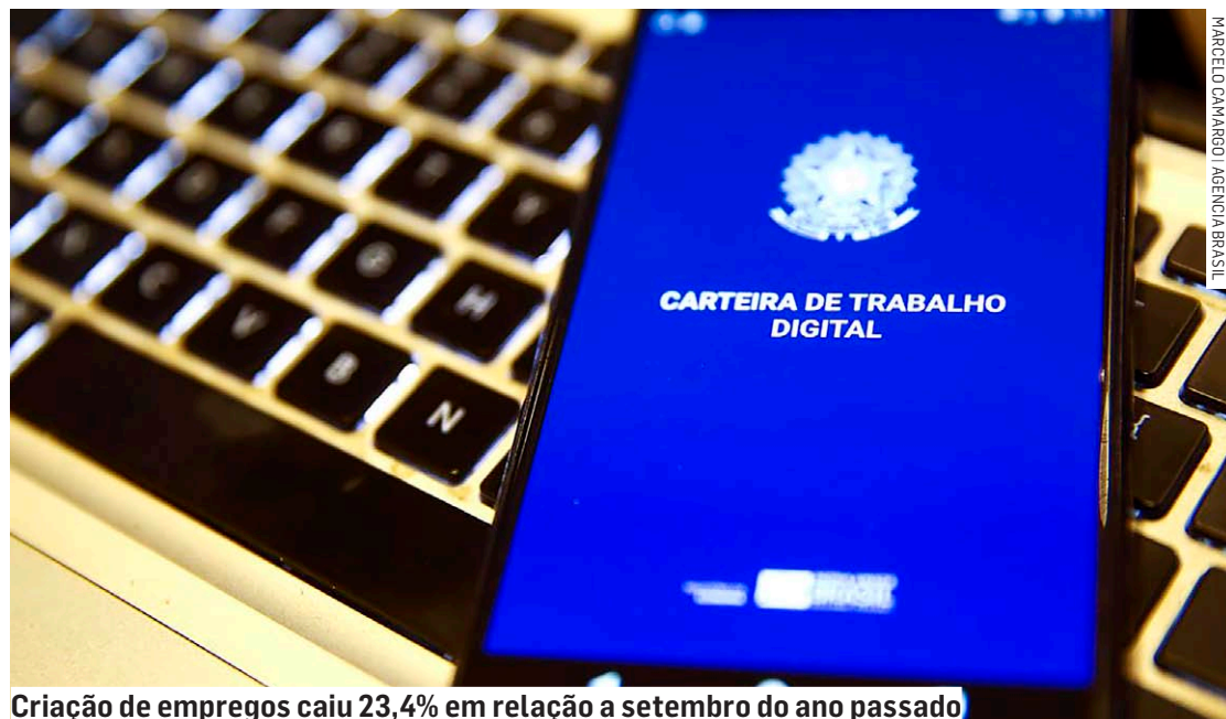
Criação de empregos caiu 23,4% em relação a setembro do ano passado

Segundo o ministro, as medidas de estímulo à economia tomadas pelo governo e a queda de juros pelo Banco Central levarão algum tempo para produzirem efeitos sobre a economia real. "A reorganização