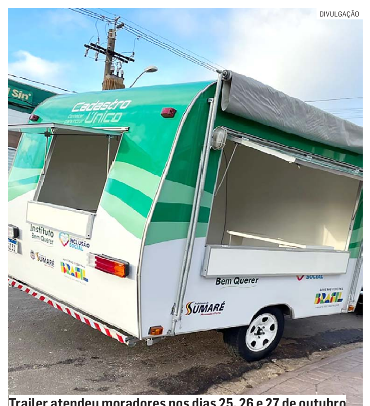
Trailer atendeu moradores nos dias 25, 26 e 27 de outubro

A partir dos dados cadastrados é possível a concessão de benefícios como: tarifa social de energia elétrica, BPC, Auxílio Brasil, entre outros.