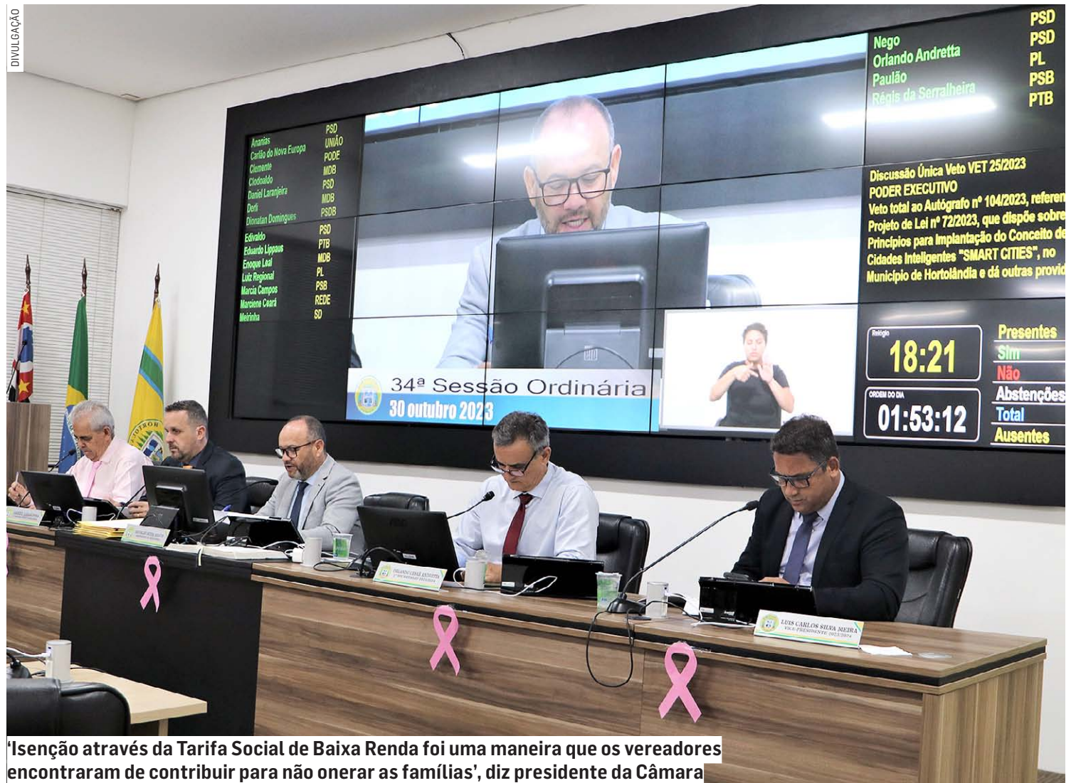
Isenção através da Tarifa Social de Baixa Renda foi uma maneira que os vereadores encontraram de contribuir para não onerar as famílias', diz presidente da Câmara

O desconto na alíquota da CIP é resultado da economia que o município