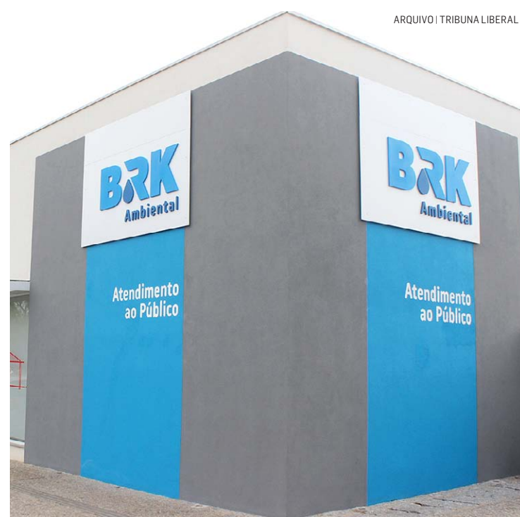
Objetivo da concessionária foi conscientizar funcionários sobre os riscos relacionados às atividades exercidas