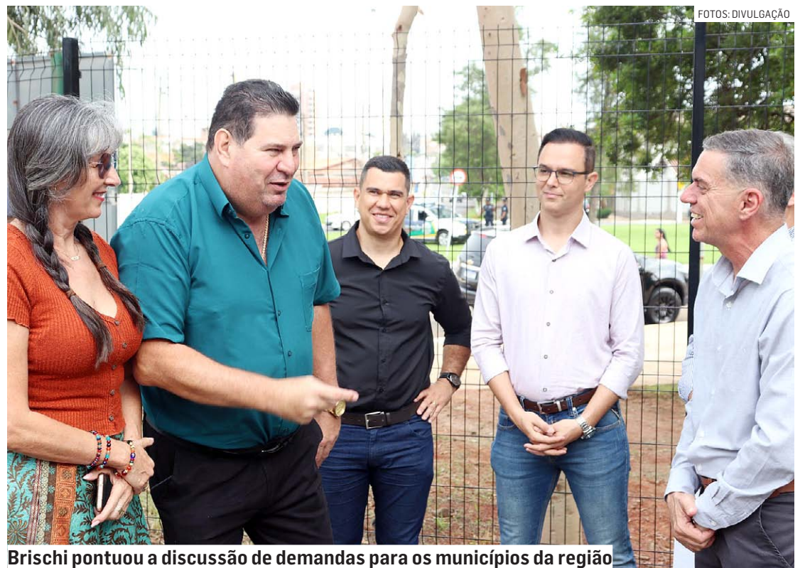
Brischi pontuou a discussão de demandas para os municípios da região

Da Redação • REGIÃO tribunaliberal@tribunaliberal.com.br