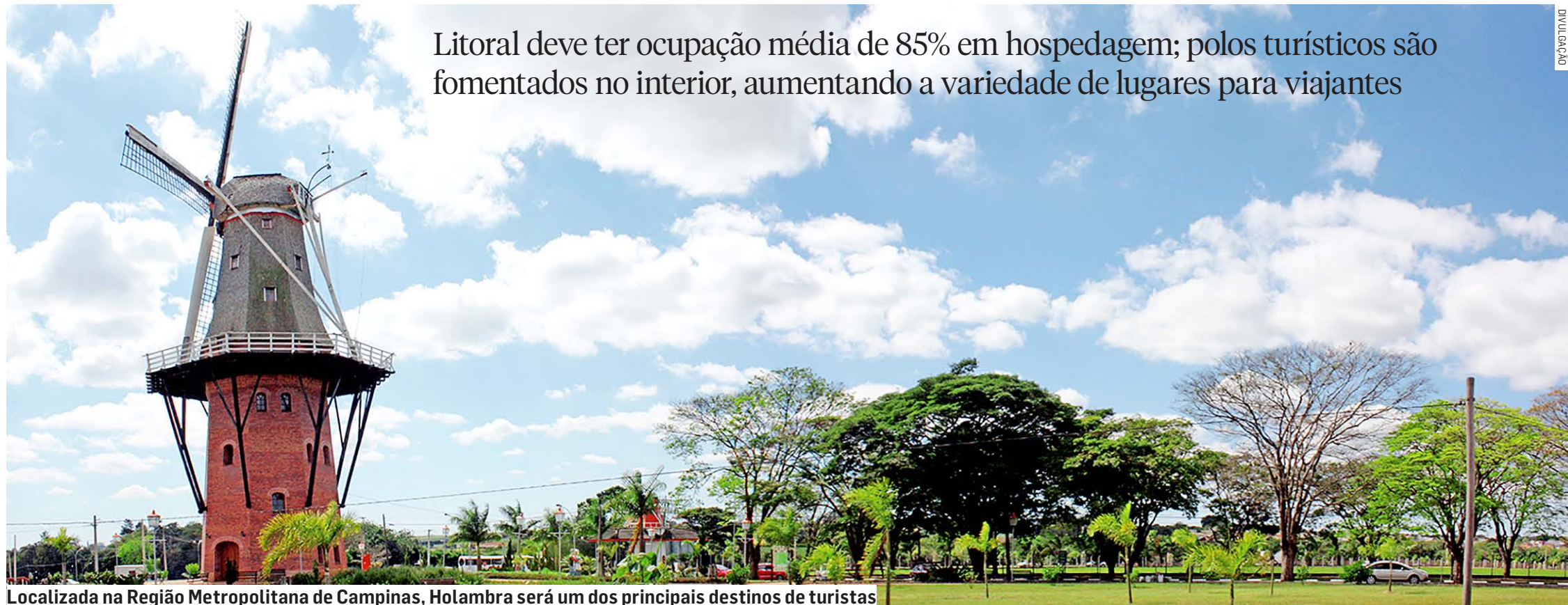
Localizada na Região Metropolitana de Campinas, Holambra será um dos principais destinos de turistas

Litoral deve ter ocupação média de 85% em hospedagem; polos turísticos são fomentados no interior, aumentando a variedade de lugares para viajantes