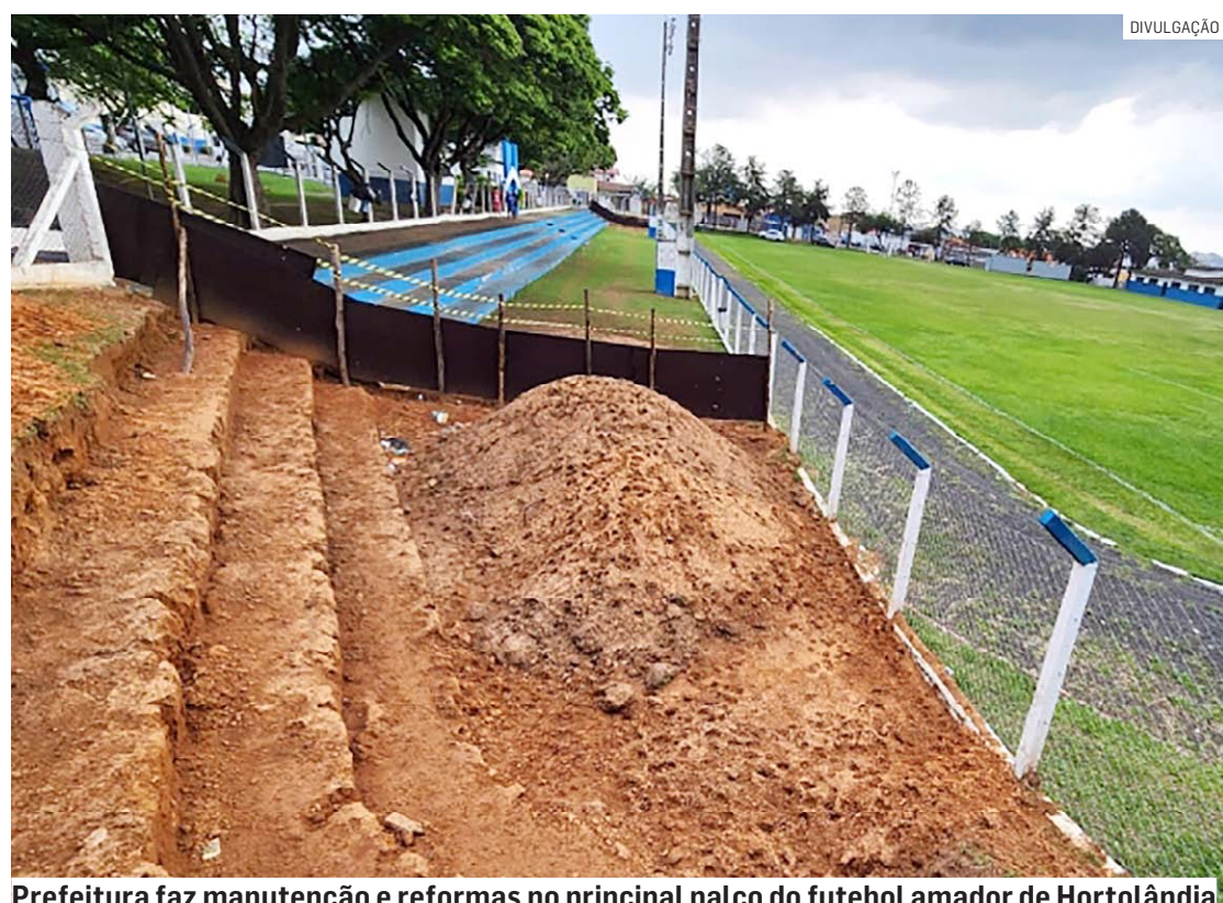
Prefeitura faz manutenção e reformas no principal palco do futebol amador de Hortolândia

A arquibancada do espaço esportivo ganhará, aproximadamente, 200 lugares para os espectadores. Segundo a Secretaria de Esporte e Lazer, uma média de 3 mil pessoas, a depender da partida, acessa as dependências da área em dias de jogos de futebol amador. A manutenção e as reformas nos vestiários oferecerão mais conforto para os jogadores. Também está no projeto a troca da iluminação para lâmpadas com tecnologia LED, que melhora a visibilidade com mais economia para o município em jogos noturnos e a realocação das torres para não prejudicar a visão dos torcedores.