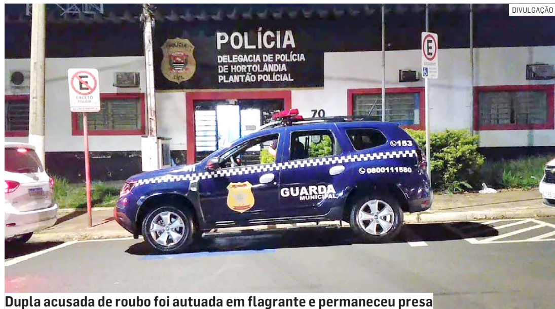
Dupla acusada de roubo foi autuada em flagrante e permaneceu presa

Os dois indivíduos foram encaminhados ao Plantão Policial de Hortolândia e autuados em flagrante por roubo.