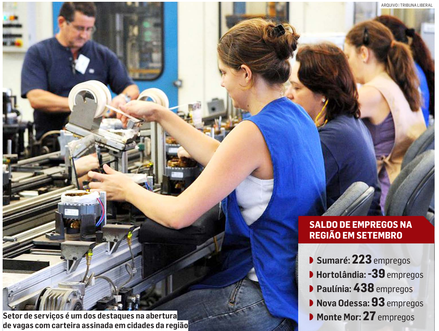
Sector de serviços é um dos destaques na abertura de vagas com carteira assinada em cidades da região

Nova Odessa vem em seguida, com 93 vagas de saldo após a contratação de 1.004 pessoas e a demissão de 911.