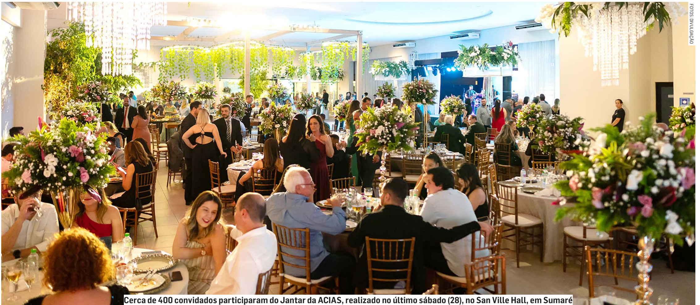
Cerca de 400 convidados participaram do Jantar da ACIAS, realizado no último sábado (28), no San Ville Hall, em Sumaré

Evento que já faz parte do calendário empresarial do município, celebrou o aniversário da entidade, que no dia 17 de setembro completou 54 anos; passado o jantar, associação trabalha na organização de um grande evento de Natal