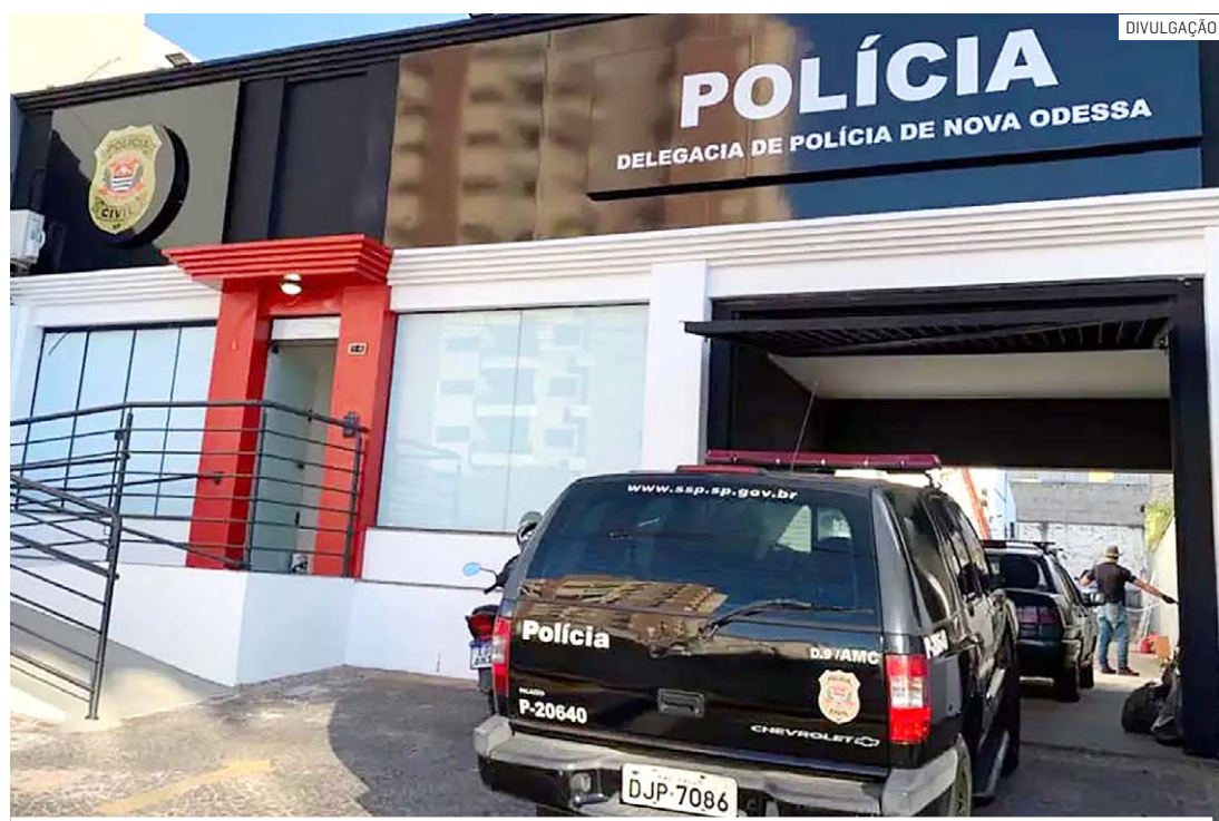
Com mandado de prisão apontando condenação por roubo, acusado foi levado à delegacia

Cézar Oliveira • NOVA ODESSA tribunaliberal@tribunaliberal.com.br