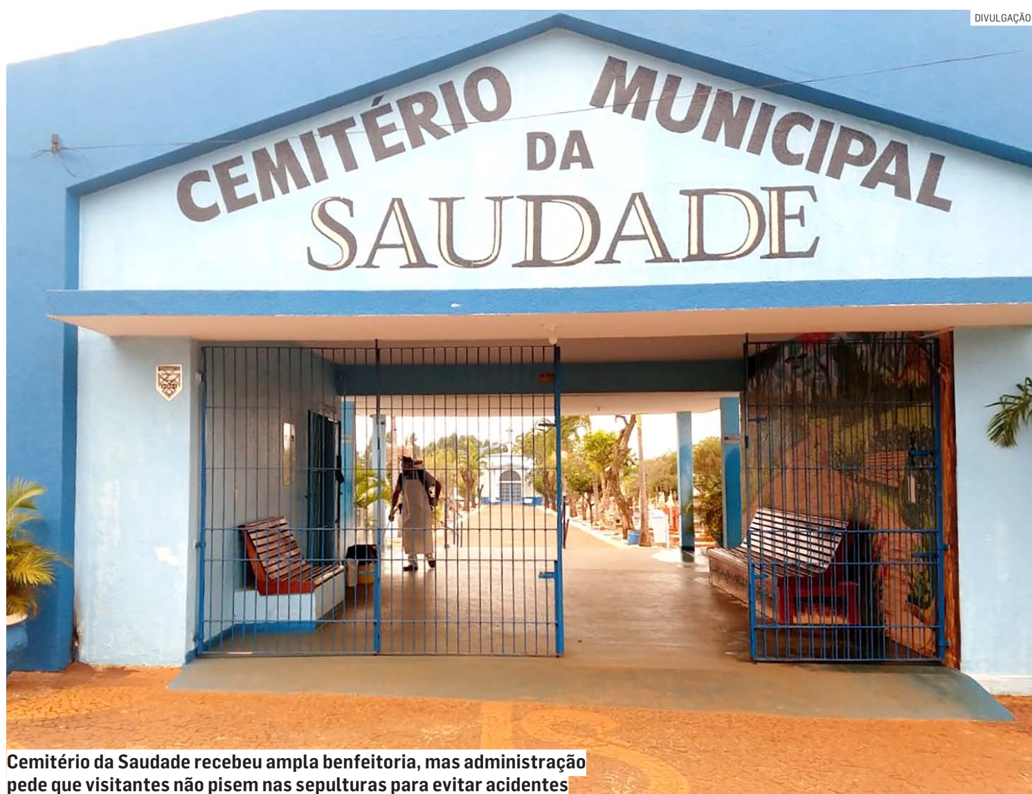
Cemitério da Saudade recebeu ampla benfeitoria, mas administração pede que visitantes não pisem nas sepulturas para evitar acidentes

Em agosto, a Prefeitura de Sumaré publicou ato normativo da Secretaria Municipal de Serviços Públicos, que estabelece regras para o uso do espaço público do Cemitério e Velório Municipal. O objetivo é garantir uma gestão mais