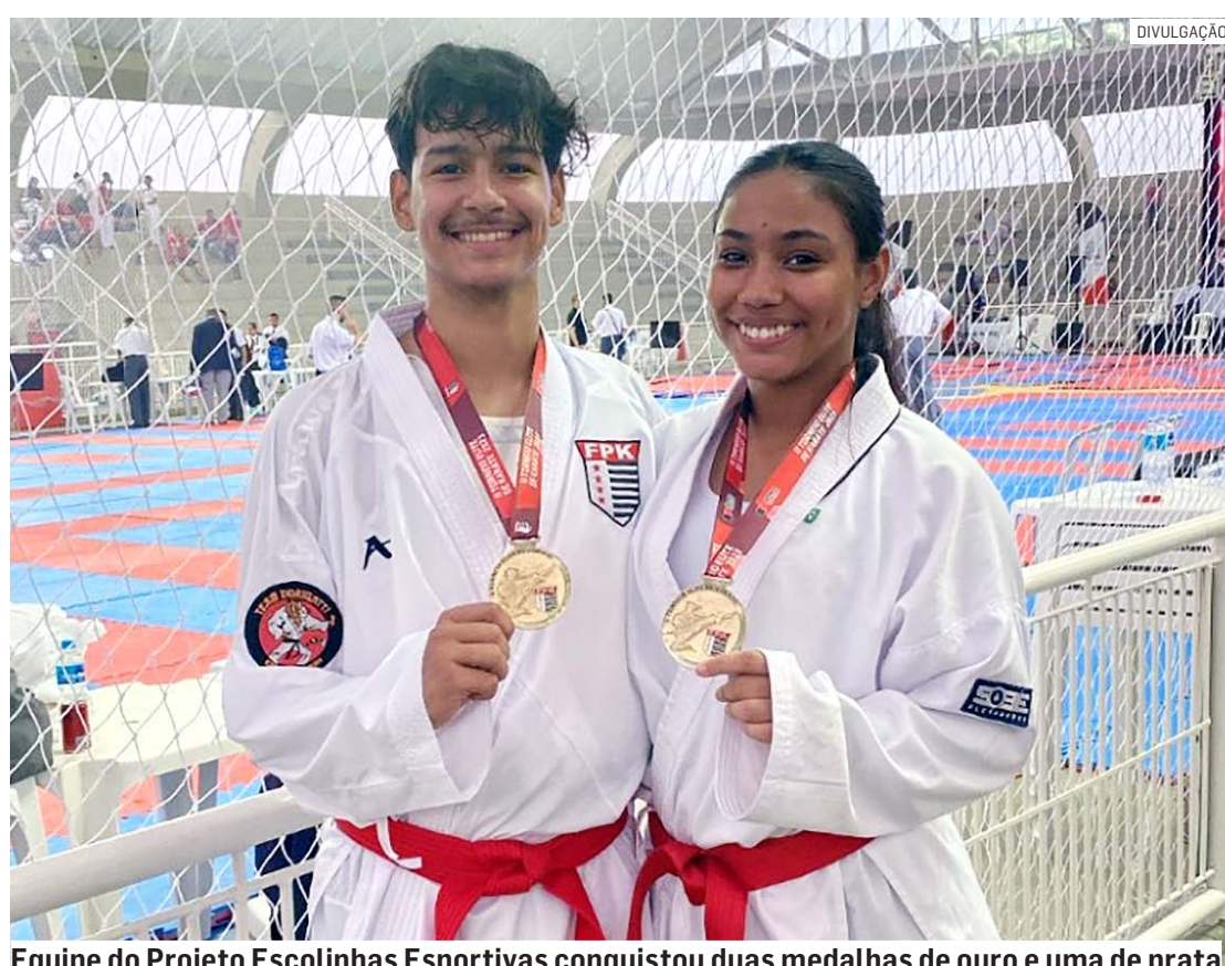
Equipe do Projeto Escolinhas Esportivas conquistou duas medalhas de ouro e uma de prata

Da Redação • HORTOLÂNDIA tribunaliberal@tribunaliberal.com.br