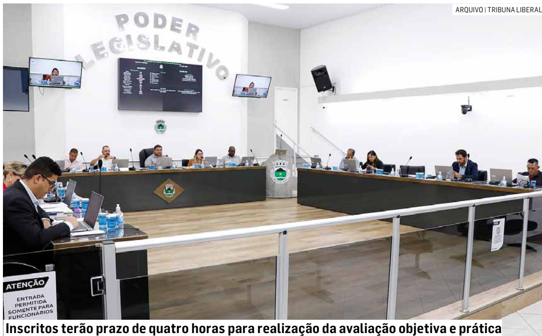
Inscritos terão prazo de quatro horas para realização da avaliação objetiva e prática