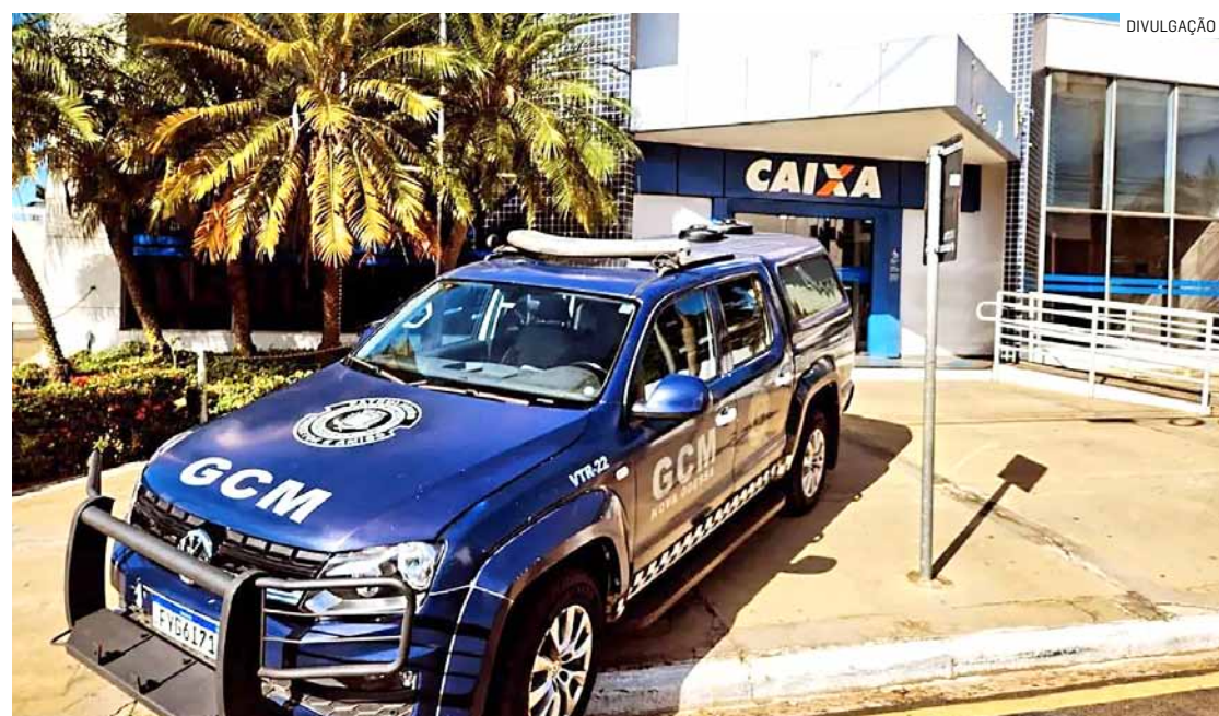
Dispositivos instalados nos terminais impediam a remoção do cartão da máquina