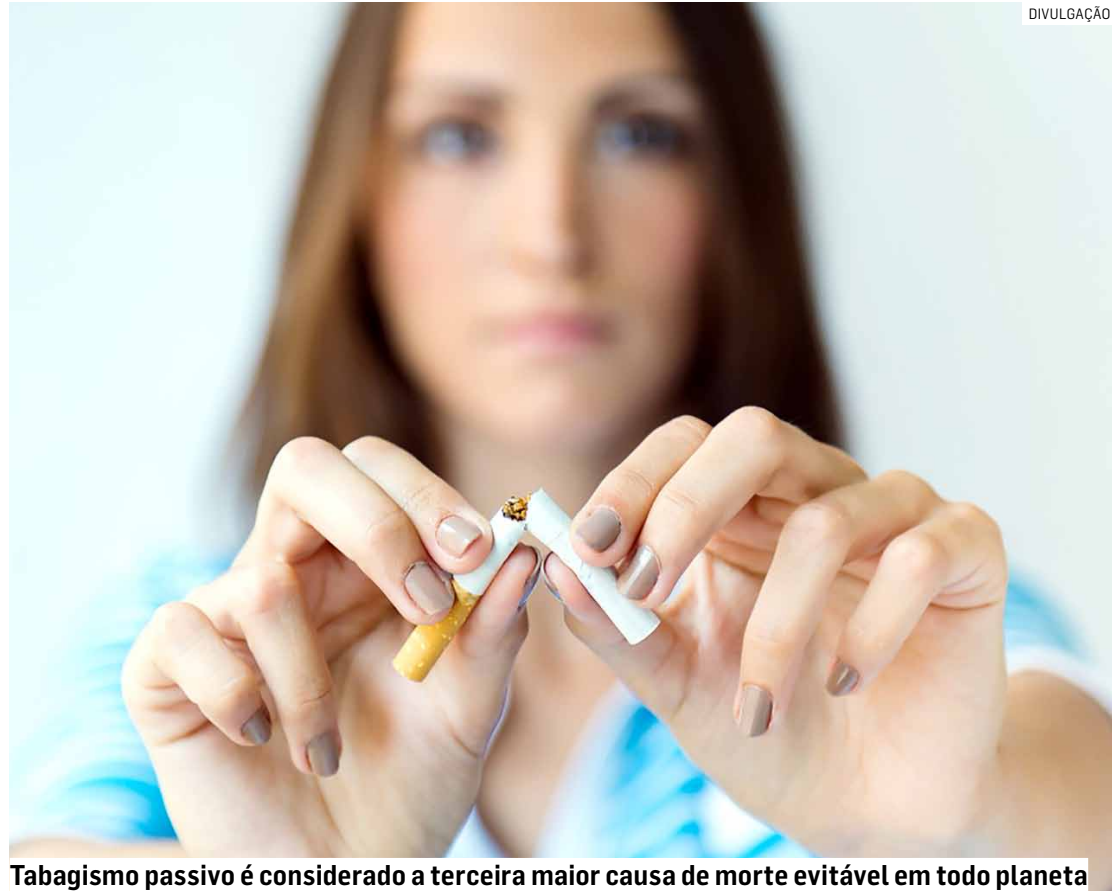
Tabagismo passivo é considerado a terceira maior causa de morte evitável em todo planeta