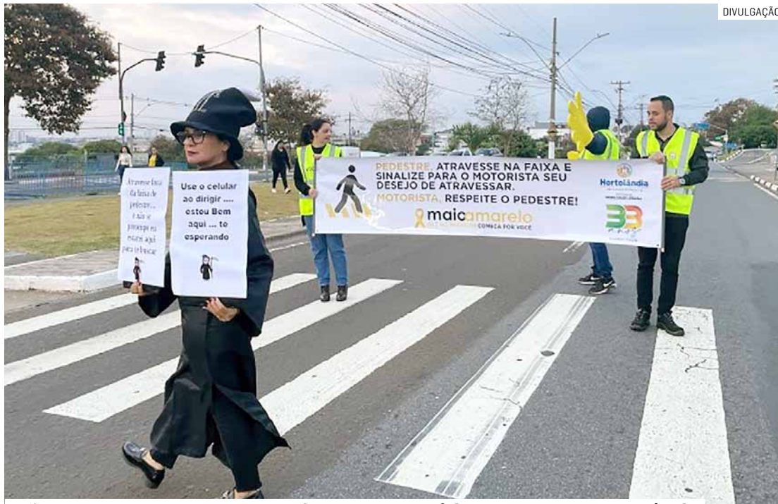
Ação contou com agentes caracterizados com temáticas da segurança no trânsito

O conjunto do trabalho realizado pela prefeitura,