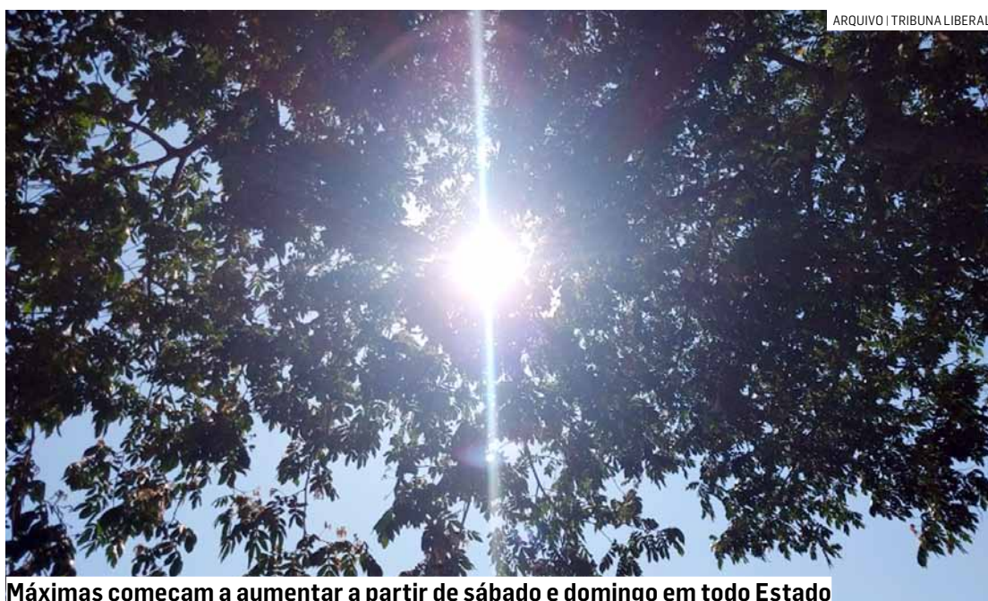
Máximas começam a aumentar a partir de sábado e domingo em todo Estado

A sexta-feira (31) já amanheceu sob predomínio de sol e temperatura mínima de 11,7°C - um pouco mais elevada em