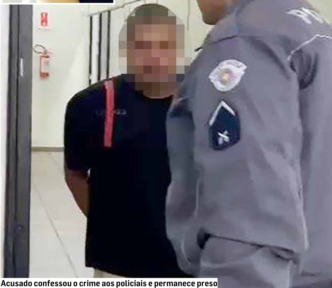
Acusado confessou o crime aos policiais e permanece preso