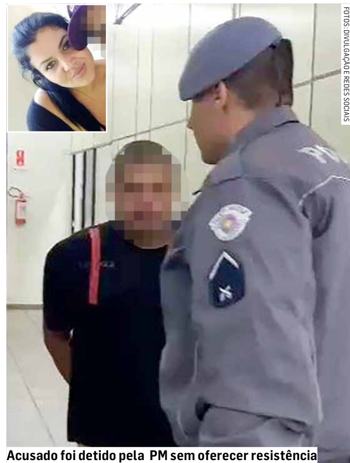
Acusado foi detido pela PM sem oferecer resistência