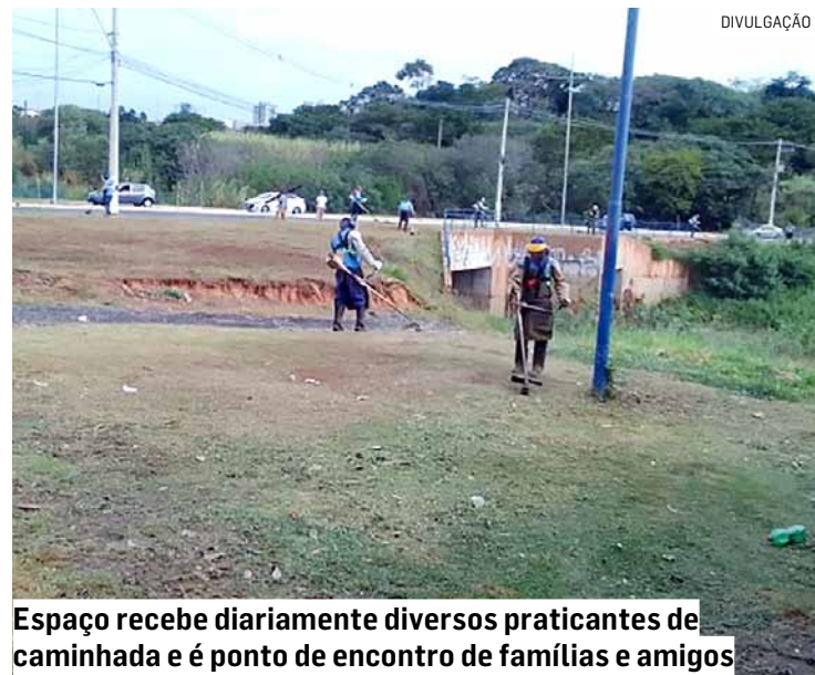
Espaço recebe diariamente diversos praticantes de caminhada e é ponto de encontro de famílias e amigos

Da Redação • HORTOLÂNDIA tribunaliberal@tribunaliberal.com.br