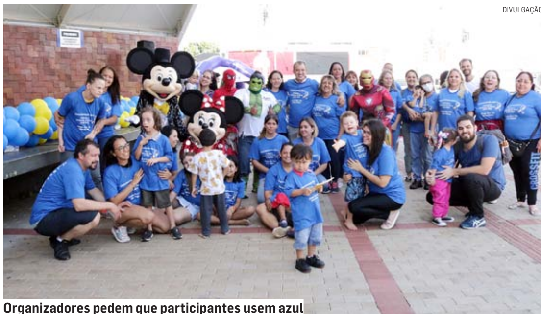
Organizadores pedem que participantes usem azul

Para participar da ação, não é necessária inscrição prévia, mas a