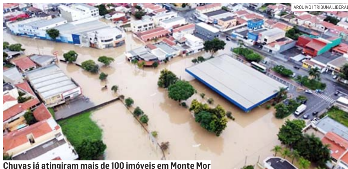
Chuvas já atingiram mais de 100 imóveis em Monte Mor

A divisa entre Nova Odessa e Sumaré tem sofrido com os alagamentos, deixando carros ilhados.