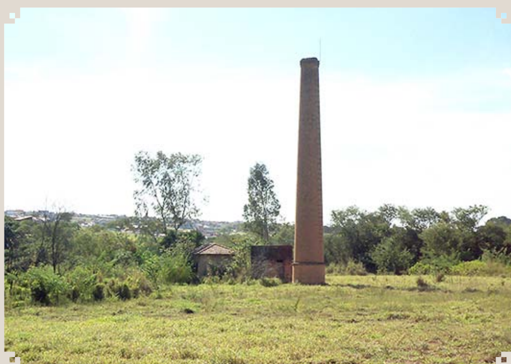
Foto atual do que restou do antigo Alambique dos Fantinatti, localizado na zona rural do Bairro do Matão. Ali se fabricava um aguardente de primeira qualidade, muito procurado pelos moradores da região. Com o crescimento do município, surgiram vários loteamentos próximos, que inviabilizaram as atividades agrícolas da Família Fantinatti.