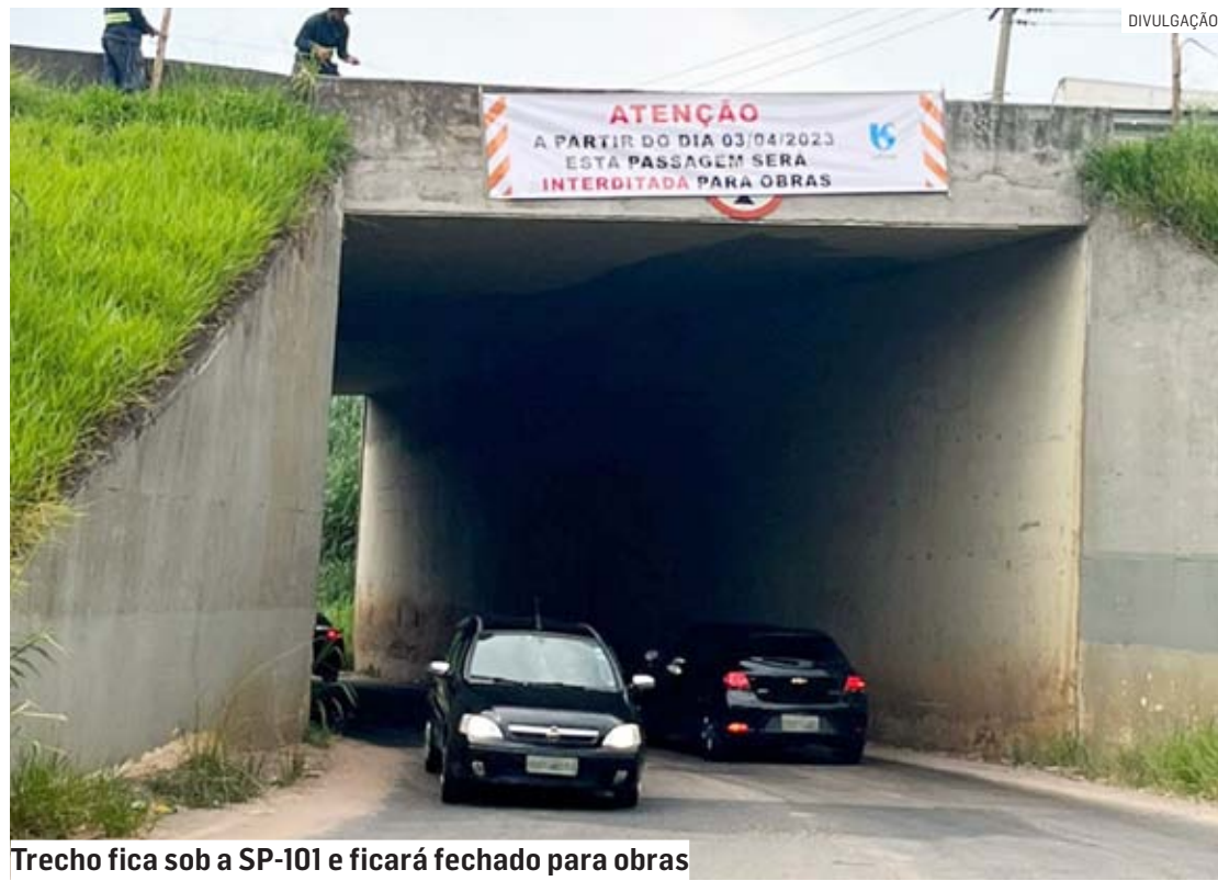
Trecho fica sob a SP-101 e ficará fechado para obras