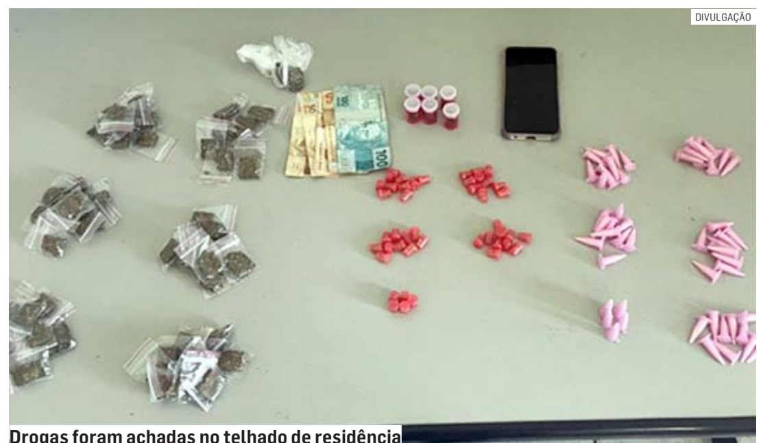
Drogas foram achadas no telhado de residência

Os suspeitos foram levados para o 2º DP (Distrito Policial) de Hortolândia, onde foi registrado o boletim de ocorrência. Ambos foram presos.