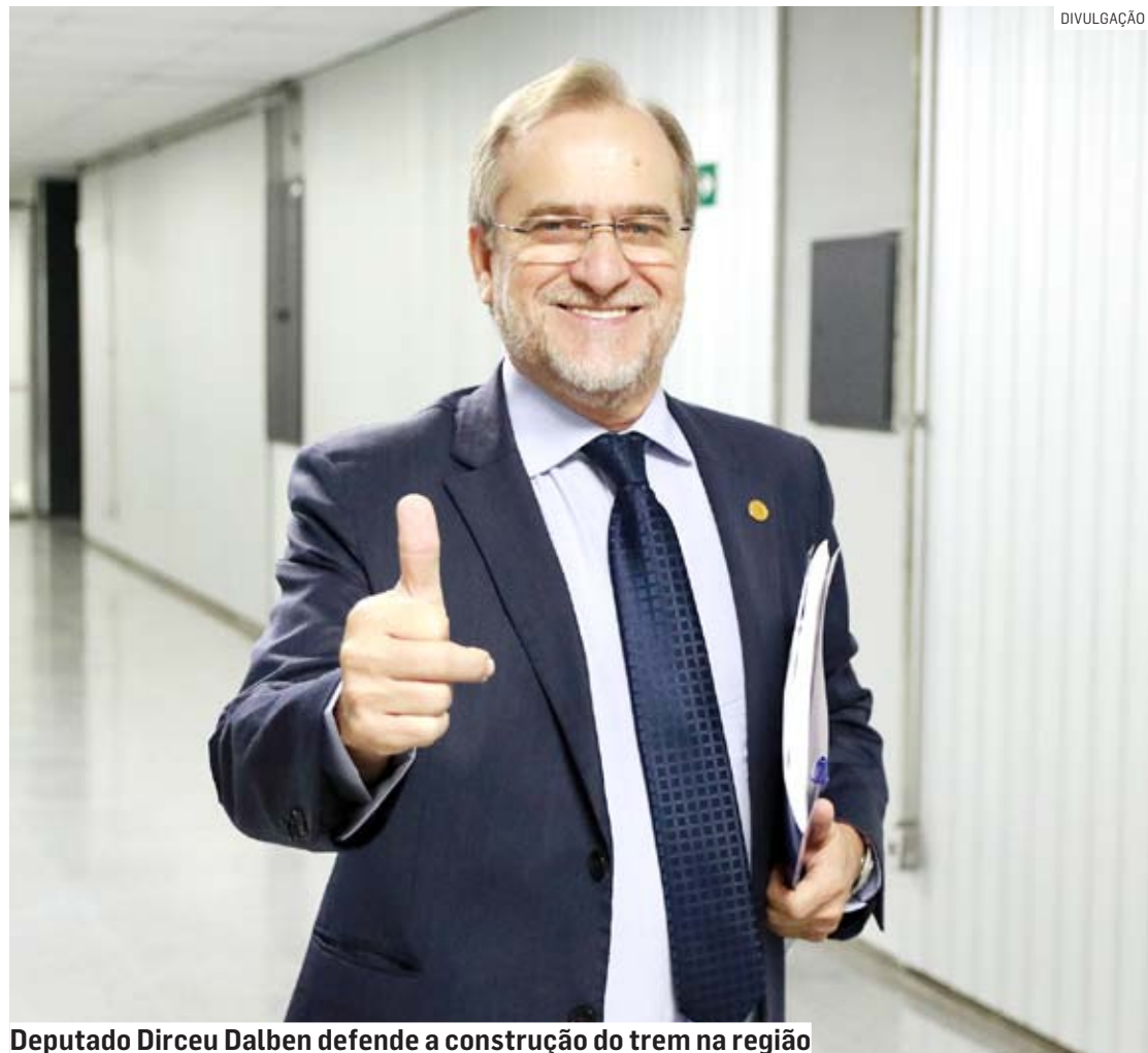
Deputado Dirceu Dalben defende a construção do trem na região

Deputado Dirceu Dalben acredita que a obra do trem entre Campinas e São Paulo trará ganhos ambientais, redução de carros nas rodovias, além de facilitar o dia a dia da população entre as duas regiões metropolitanas