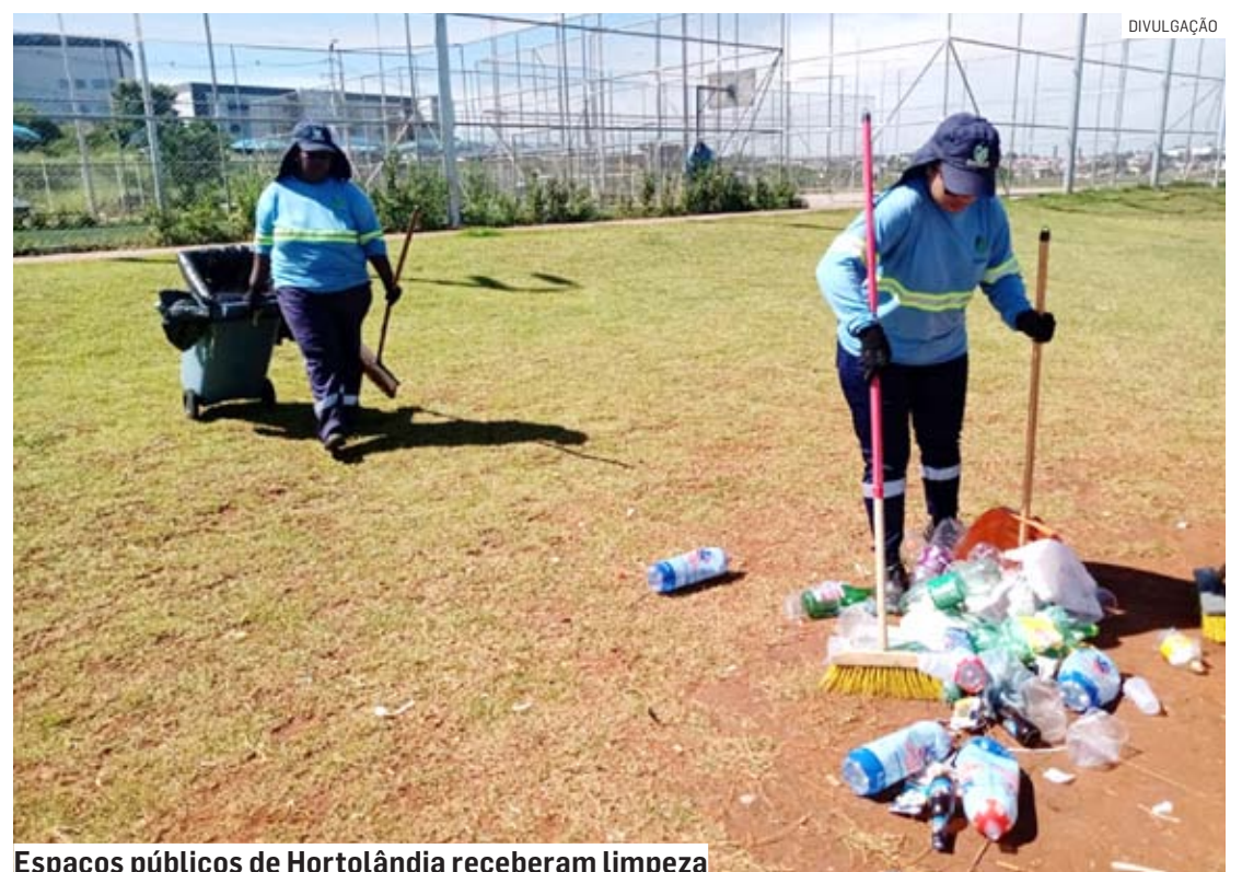
Espaços públicos de Hortolândia receberam limpeza

“A poda do mato foi um trabalho de zeladoria que aconteceu durante toda a semana para manter a limpeza, a visibilidade e, consequentemente, a segurança viária em canteiros centrais e áreas verdes das avenidas Olívio Franceschini, Tereza Ana Cecon Breda e São Francisco de Assis. A unidade de saúde do Jardim Nova Hortolândia também recebeu o serviço com o objetivo de receber a população e os profissionais que trabalham no espaço”, informou a Prefeitura.