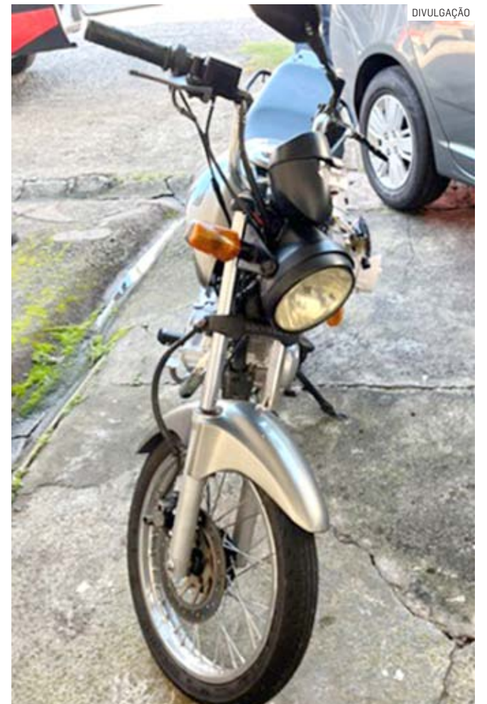
Policiais constataram que Honda/CG era roubada

O suspeito foi conduzido ao Plantão Policial de Hortolândia, onde foi registrado o boletim de ocorrência e permaneceu à disposição da Justiça.