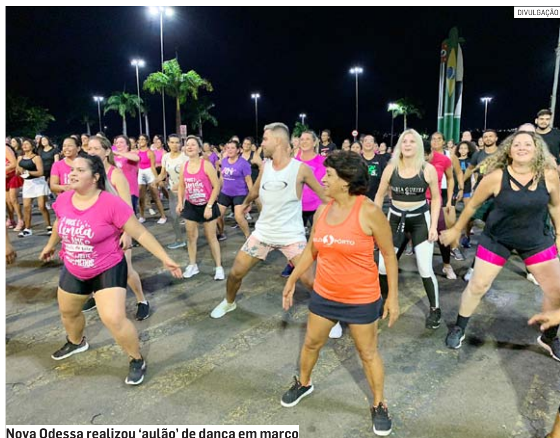
Nova Odessa realizou 'aulão' de dança em março

Da Redação | NOVA ODESSA tribunaliberal@tribunaliberal.com.br