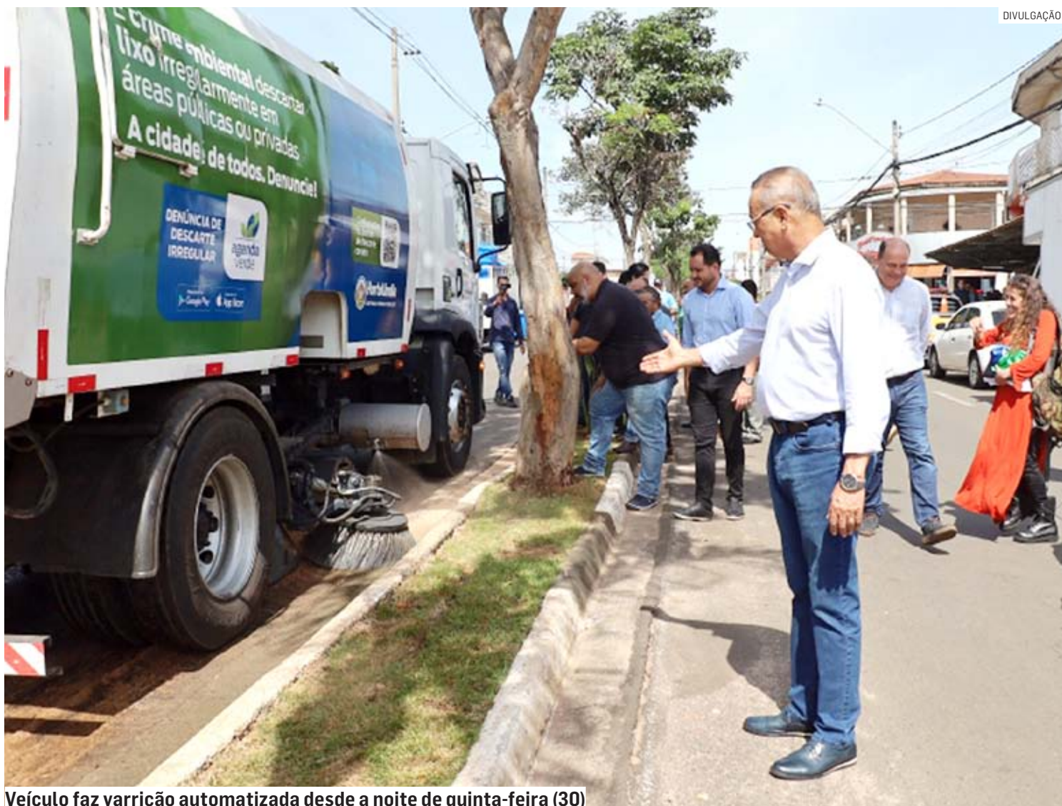
Veículo faz varrição automatizada desde a noite de quinta-feira (30)

Quem passa pelas avenidas Cora Coralina e Santana, no Jardim Amanda, visualiza os contêineres