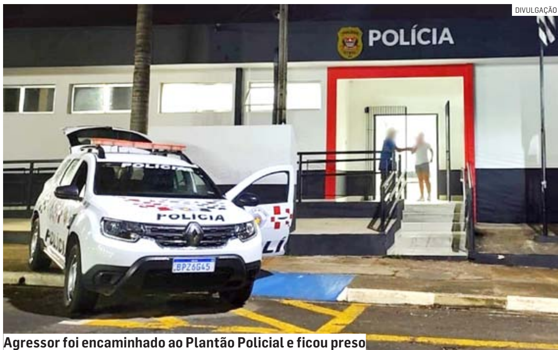
Agressor foi encaminhado ao Plantão Policial e ficou preso

Cézar Oliveira | MONTE MOR tribunaliberal@tribunaliberal.com.br