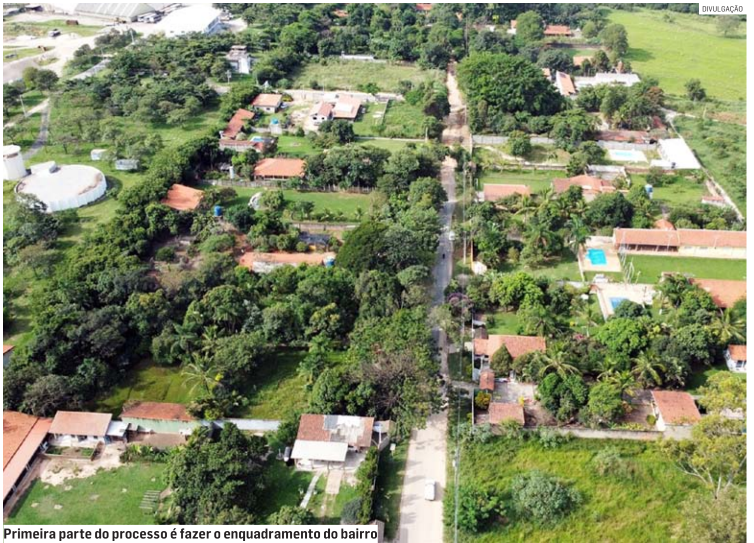
Primeira parte do processo é fazer o enquadramento do bairro