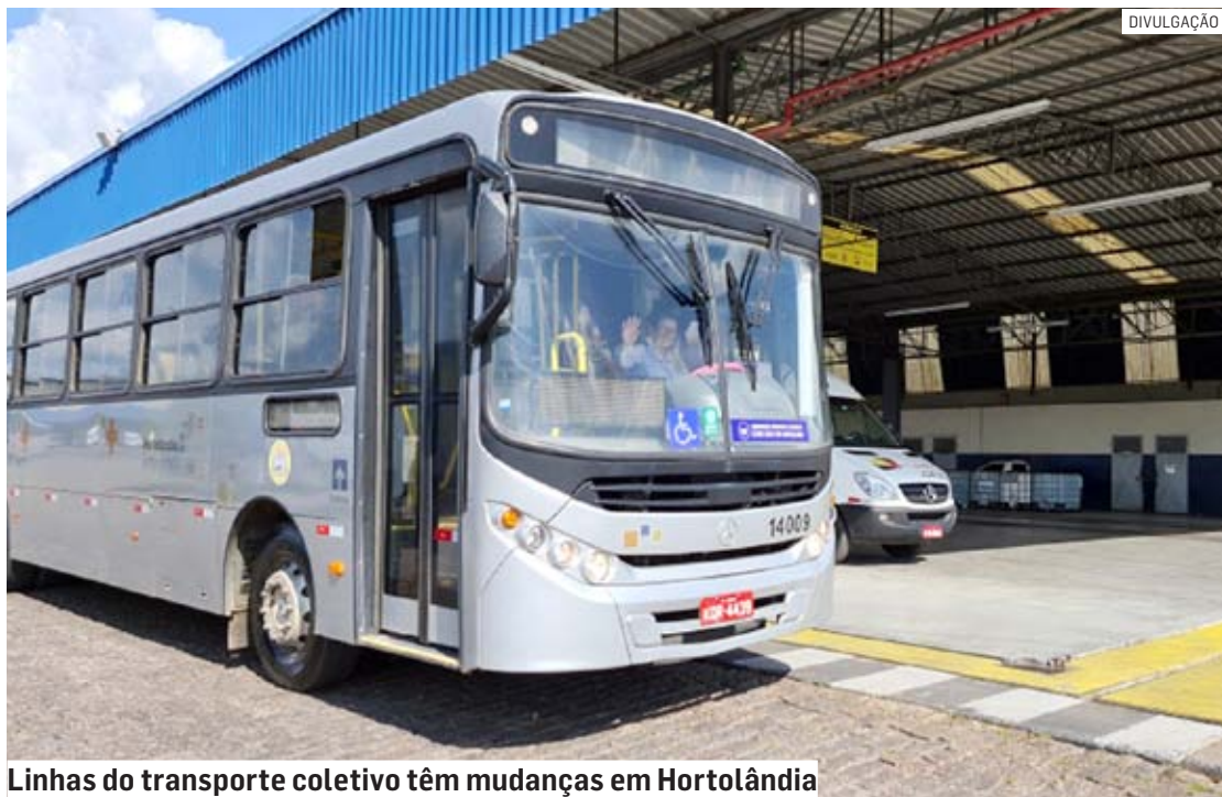
Linhas do transporte coletivo têm mudanças em Hortolândia

Da Redação | HORTOLÂNDIA tribunaliberal@tribunaliberal.com.br