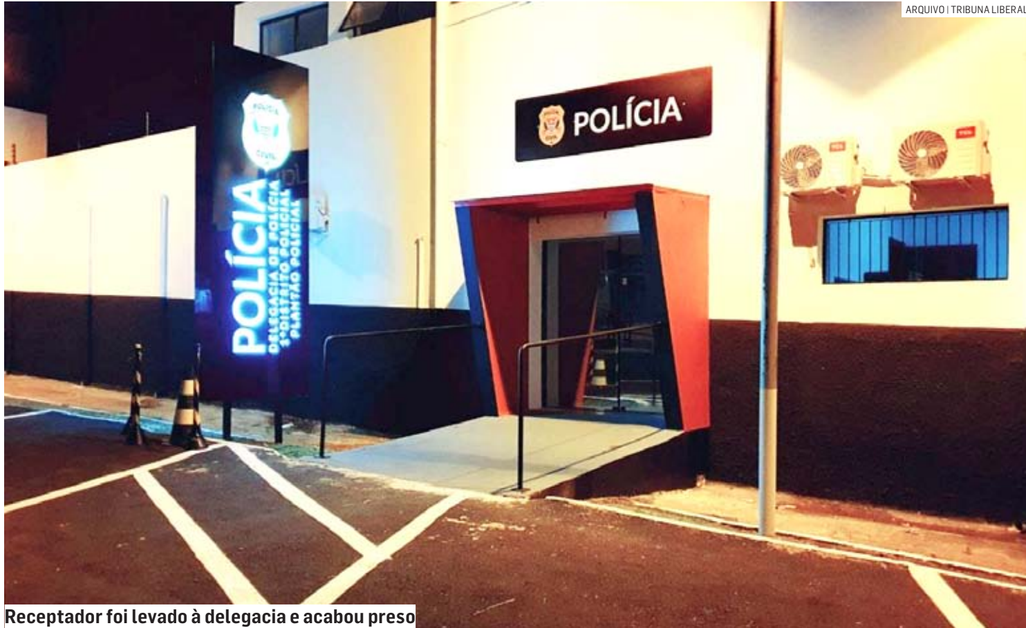
Receptador foi levado à delegacia e acabou preso

Depois de ter veículo e celular roubados, vítima conseguiu rastreamento através de um dos aparelhos, acionou a polícia e o suspeito que estava com seus pertences foi localizado e detido na região do Jardim Amélia