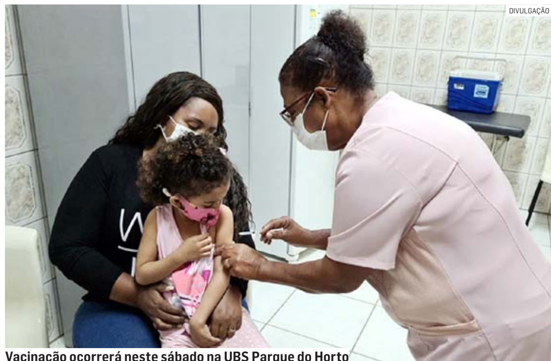
Vacinação ocorrerá neste sábado na UBS Parque do Horto

“A Prefeitura reforça para as pessoas atrasadas que é importante completar o esquema vacinal contra a doença. Essa é a maneira mais eficiente para evitar que haja aumento de casos positivos, internações e óbitos na cidade”, apelou.