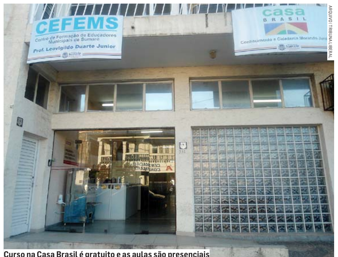
Curso na Casa Brasil é gratuito e as aulas são presenciais

Para efetuar a inscrição é necessário apresentar cópia dos documentos pessoais (CPF